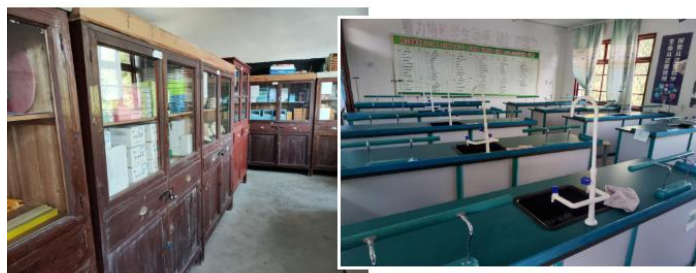
▲实验室改造前，笨重的理化实验长桌

9 月，对贵州省榕江县 3 所乡村小学科学实验室进行改造，完成学校实验室内桌凳、柜子的安装。