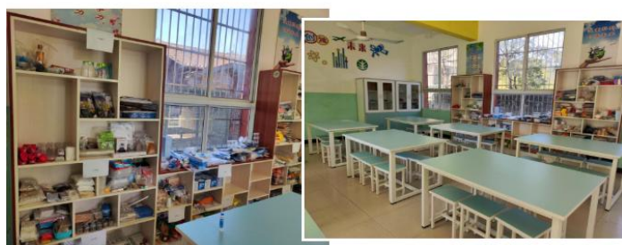
▲实验室改造后，适合孩子们小组开展探究活动的桌椅