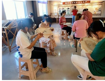
右图：安徽望江县望马楼村童伴之家开展“学习刺绣，传承文化”主题活动