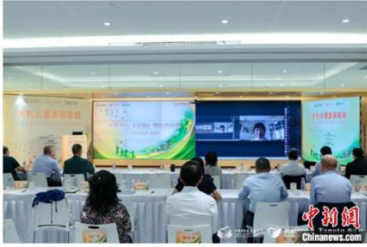
2022年“乡村儿童发展论坛”现场

中新网北京9月29日电 (门睿)中国乡村发展基金会(原中国扶贫基金会)和北京师范大学中国公益研究院29日在2022年“乡村儿童发展论坛”上联合发布《中国乡村儿童发展报告2022》(下称“报告”)。