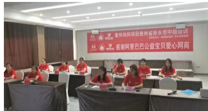
童伴妈妈项目贵州第3、4批中级培训顺利开展