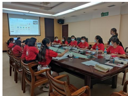
童伴妈妈项目赣皖TOT中级培训顺利开展