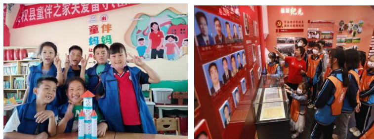
左图：河南民权县王各庄村童伴之家日常开放，孩子们一起制作火箭纸模

第三季度，项目区开童伴之家共开放 2.93 万余次，组织活动 2.09 万余次，有 17.91 万余人次的儿童，3.18 万余人次的家长参加童伴之家的日常活动和“爱国主义教育”、“爱护环境”、“学习刺绣，传承文化”等主题活动。孩子们在活动中学习传统文化知识，培养孩子们对传统文化的兴趣。