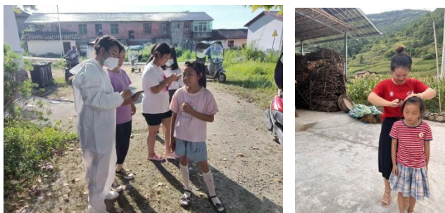
左图：江西靖安县石境村童伴妈妈疫情期间入户走访，宣传防疫知识