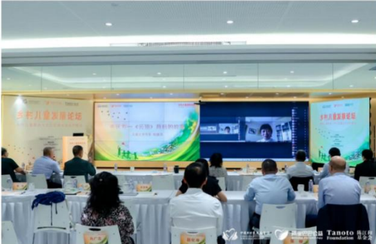
图为论坛活动现场

9月29日,由中国乡村发展基金会联合阿里巴巴公益、北京陈江和公益基金会主办的2022年“乡村儿童发展论坛”以线上线下结合的方式举行。论坛以“乡村儿童服务人才队伍建设与乡村振兴”为主题,发布《中国乡村儿童发展报告2022》,邀请政府部门、专家学者、公益机构等相关方参与,围绕乡村儿童发展和人才队伍建设等话题进行了交流分享。