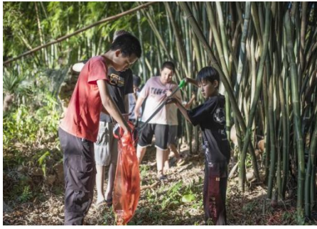
左图：江西信丰县大桥村童伴之家开展“爱护环境”主题活动