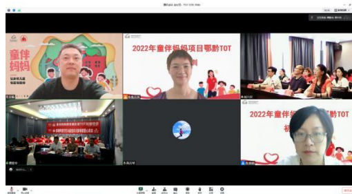
童伴妈妈项目黔鄂TOT中级培训顺利开展