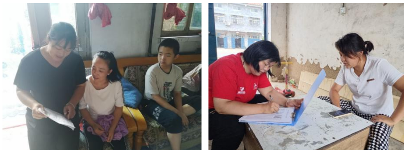
左图：河北阜平县砂窝村童伴妈妈入户走访，了解儿童生活情况

第三季度，童伴妈妈共解决项目区儿童福利信息 2.05 万余例，其中协助申请农村合作医疗、协助办理低保、协助辍学儿童返校、协助户籍登记等 0.51 万余例，提供其他服务包括资源链接、辅导儿童作业等 1.54 万余例。