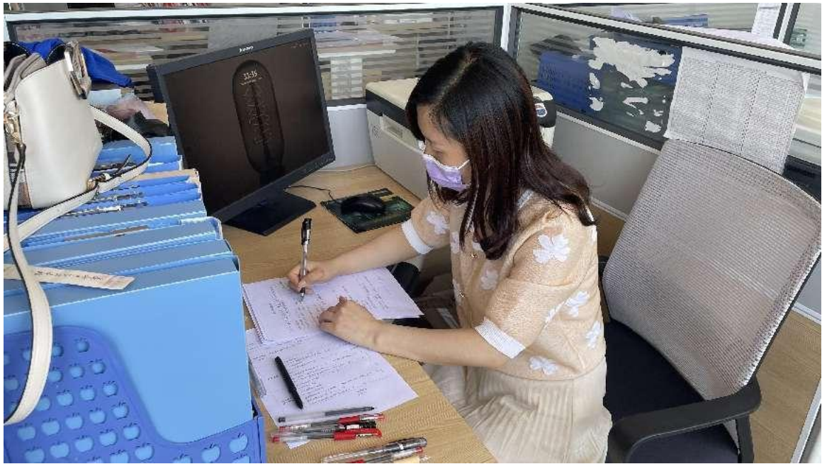
自强班班主任填写监测问卷

为提升新长城高中生项目质量，保证项目平稳规范运行。2022 年 7 月，项目组对冕宁中学校、仪陇中学校、甘孜藏族自治州高级中学、康定中学校开展项目实地监测工作，检查学校项目操作实施情况，了解受益学生选拔和资助款发放情况，并对项目档案管理是否规范、材料保存是否完整、班级活动是否按要求开展等项目环节进行检查。