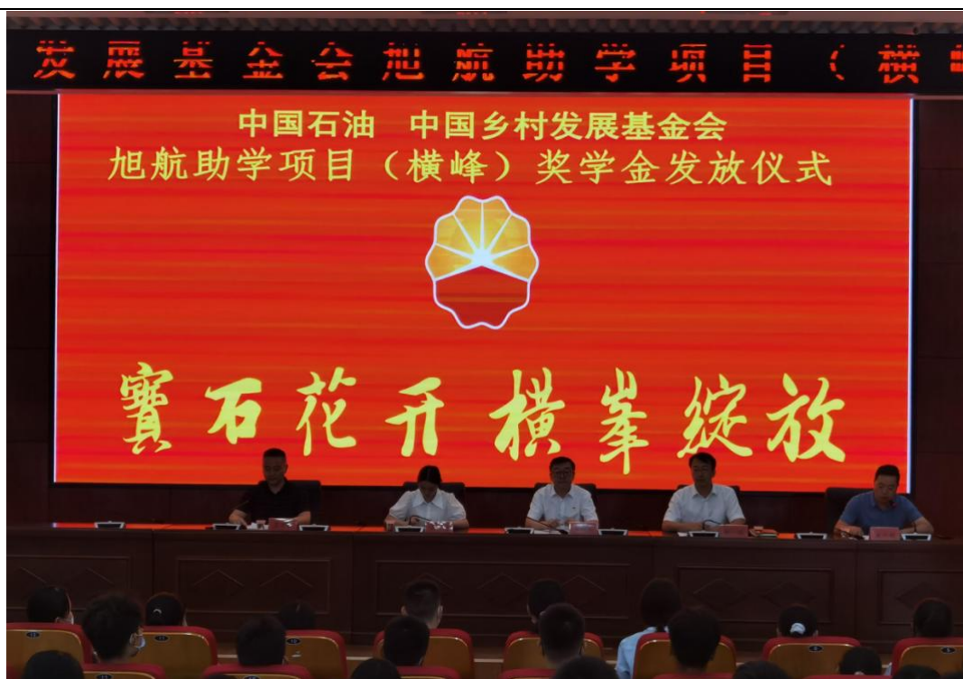
横峰中学举行旭航助学项目奖学金发放仪式