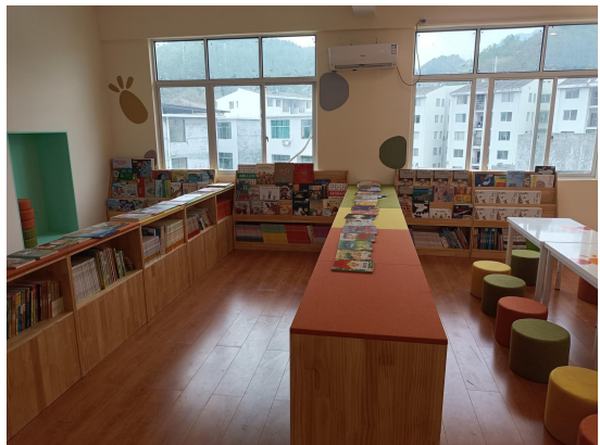
(阅读空间完成建设)