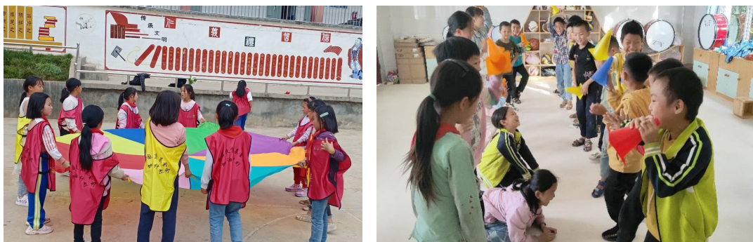
(孩子们上社会情感课)