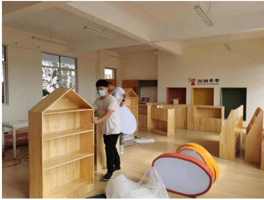
(阅读空间施工现场)