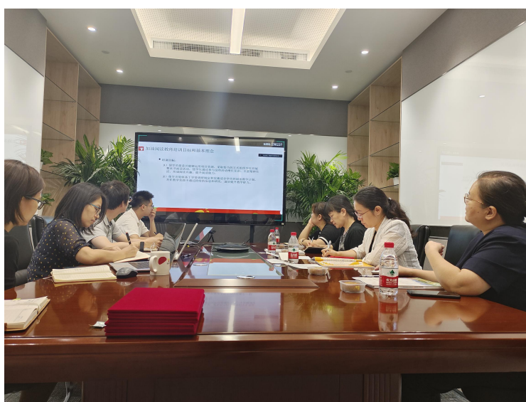
(阅读 ToT 现场)