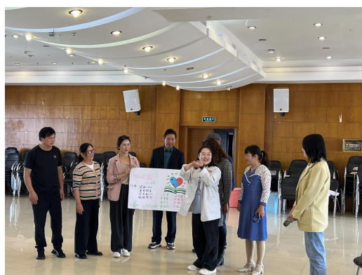
（社会情感课程培训）

加油社会情感课程在镇雄县、会泽县、赫章县、广南县、印江县和织金县正常开展。课程陪伴乡村的孩子们度过快乐的校园生活，孩子们的自尊心、耐挫力、建设性交流和团队合作能力逐渐得到提升。