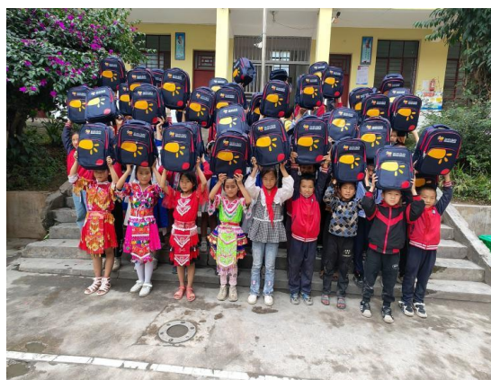
（孩子们展示收到的社会情感包）