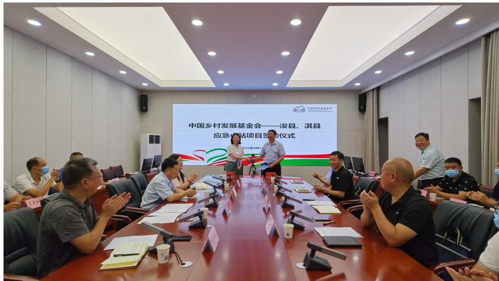
签约仪式现场照片

3、9月17日,在辉县市涧头村童伴之家举行揭牌仪式,省市县各级民政部门负责人、捐赠方哔哩哔哩公司代表参加仪式活动并发言。