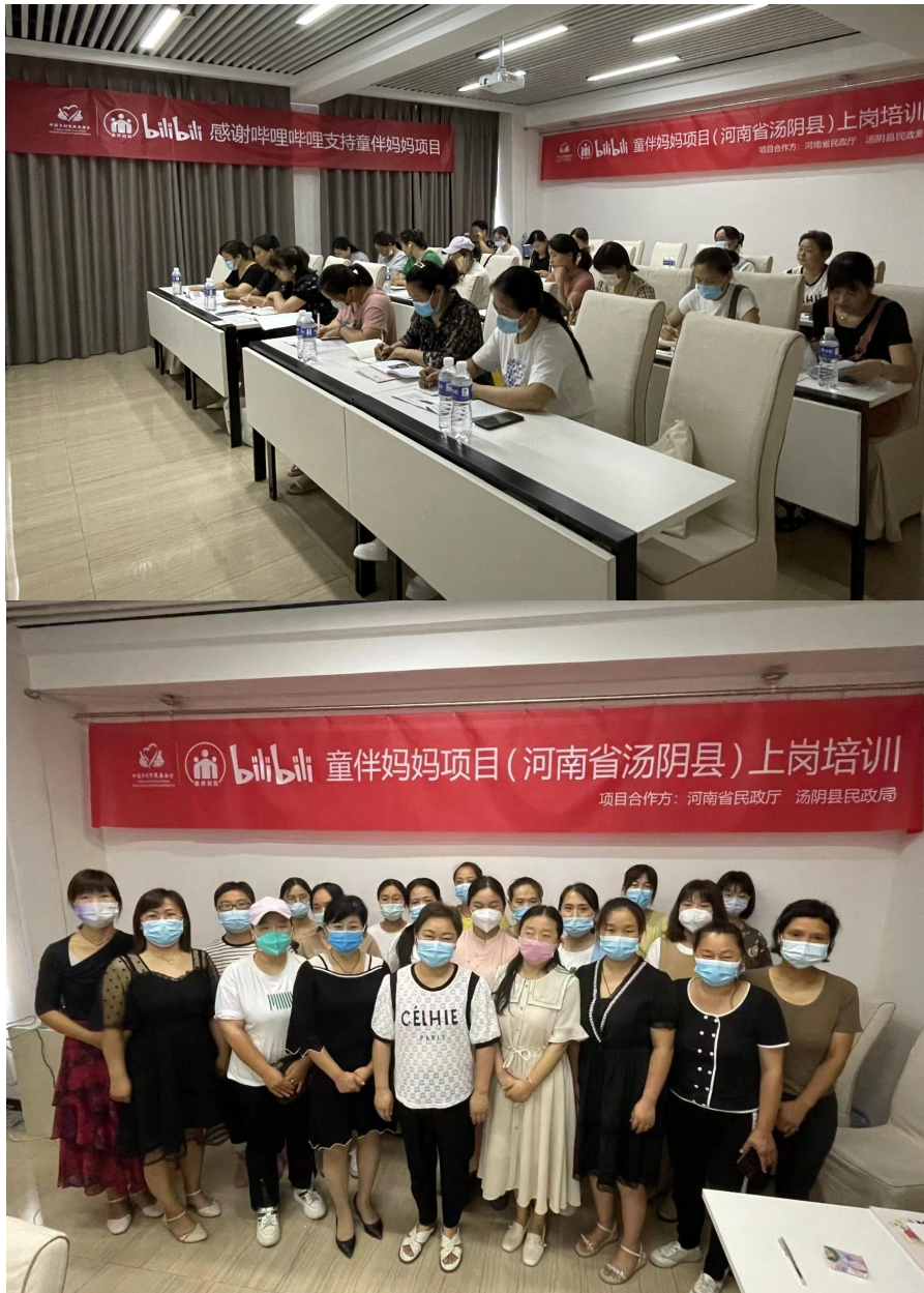
通过“线上+线下集中”的形式开展项目上岗培训