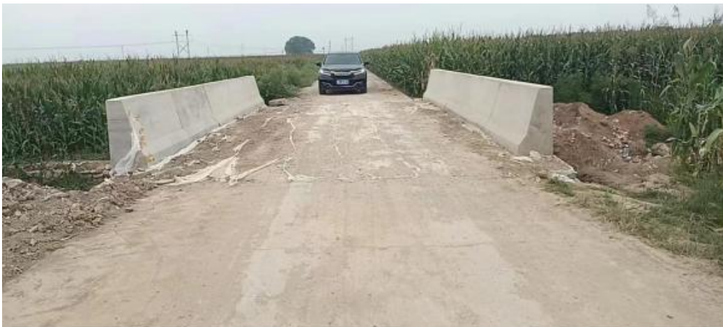
安都乡大谷驼村小谷驼便民桥竣工图

在河南省3市15县确认援建便民桥157座（其中巩义市35座，辉县23座、卫辉市19座、洛阳9县44座、新密18座、登封13座、荥阳5座）。已完成各筹款平台反馈。目前157座便民桥中，待开工4座，建设中26座，竣工完成127座。