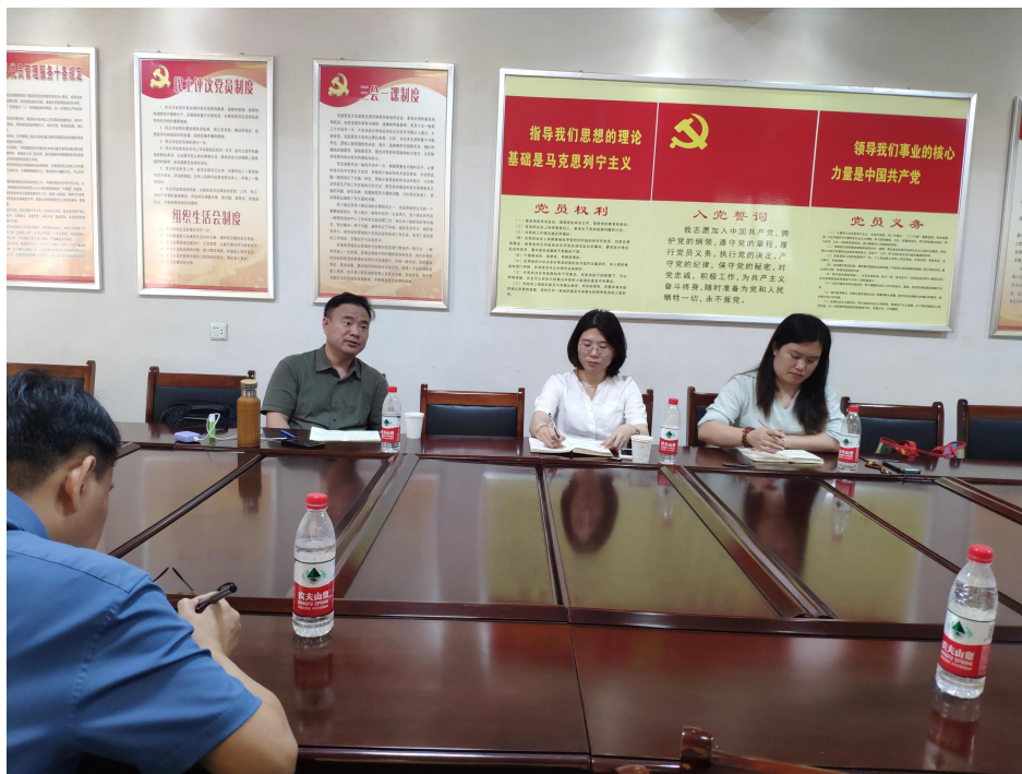
韧性家园项目风险识别座谈会照片

2022年6月，河南水灾救援-韧性家园项目正式立项，2022年8月，项目组邀请风险识别专家前往大石岩村开展村庄灾害风险识别实地工作。2022年9月，项目组沟通多家风险识别及研究型规划意向团队，选定负责项目研究型规划、灾害风险识别及项目评估工作的合作单位。