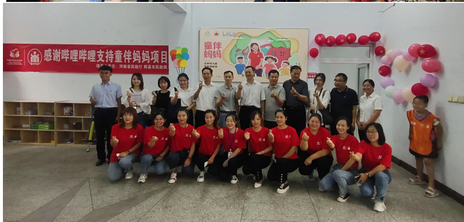
辉县市涧头村童伴之家揭牌仪式