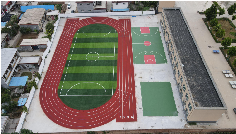
鹤壁市淇县西岗中心小学

在河南省 5 县（区）共计援助跑道项目 18 条，其中浚县 4 条、淇县 3 条、卫辉 5 条、辉县 5 条、凤泉区 1 条。目前 18 条跑道中，已开工 5 条，竣工完成 13 条。