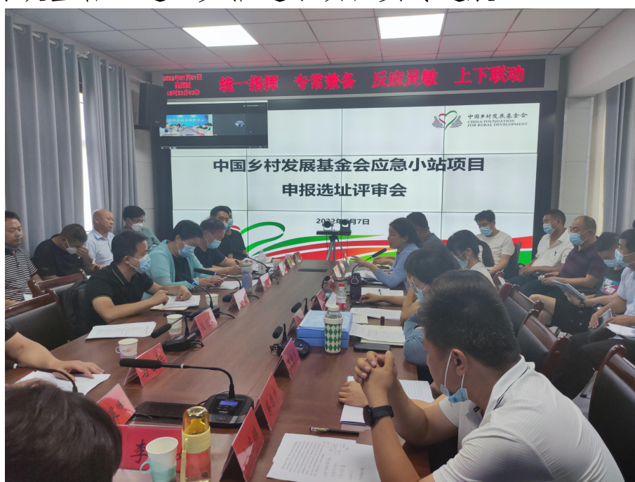
汝阳县应急小站项目选址评审会

设需求，并完成鹤壁市浚县、淇县、洛阳市汝阳县、孟津区4县协议签署，进一步推进了项目实时进展。