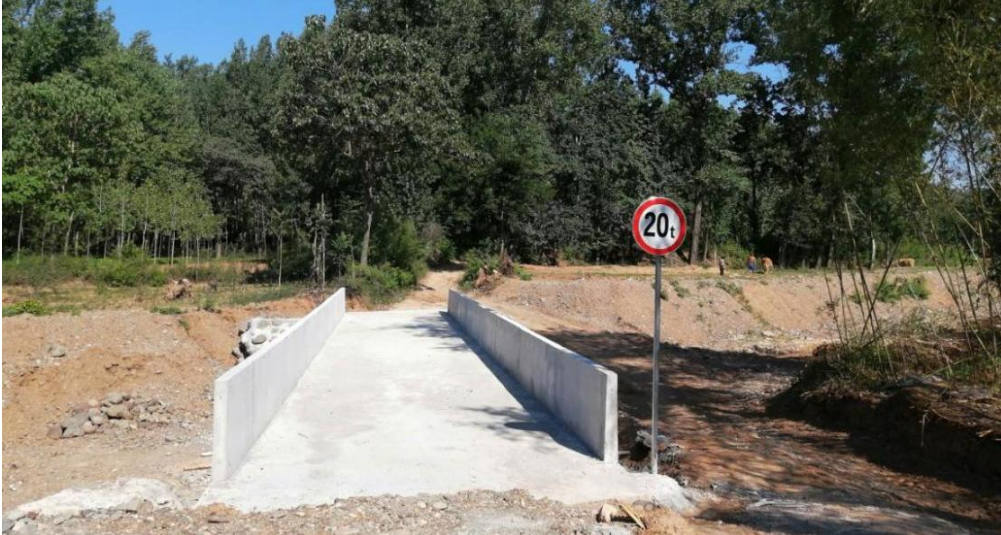
洛阳市洛宁县罗岭乡前河村闫沟桥竣工图