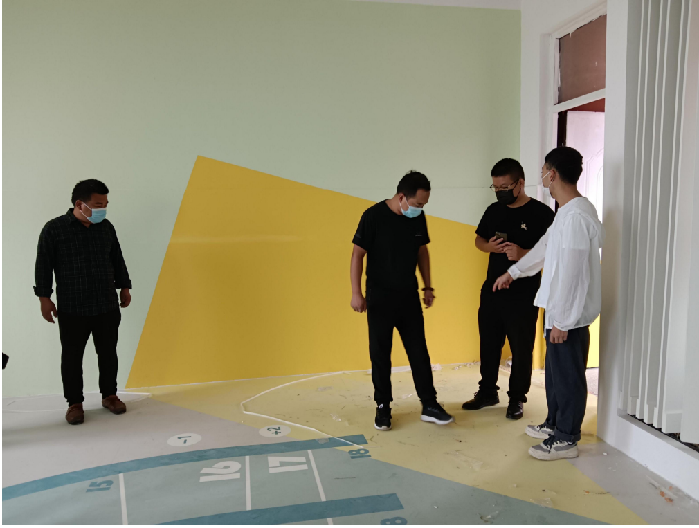
减灾教室现场验收照片