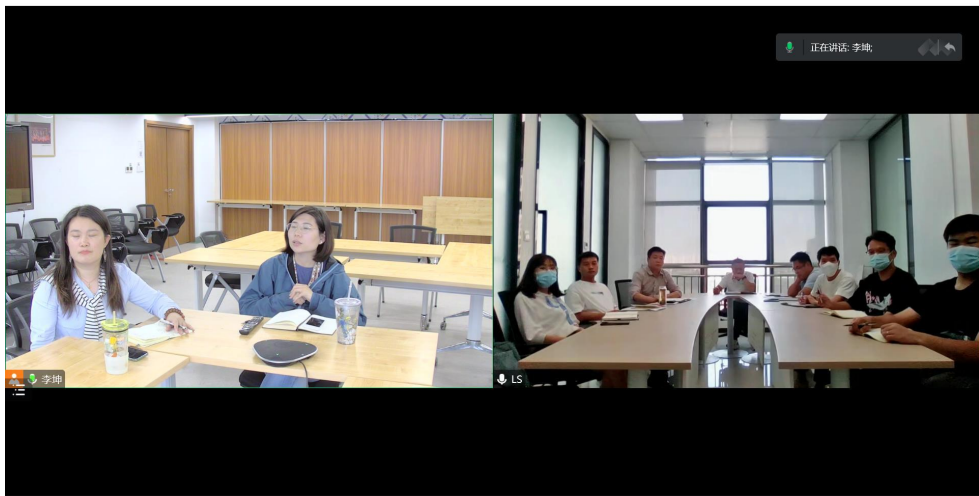
韧性家园项目意向团队沟通会照片