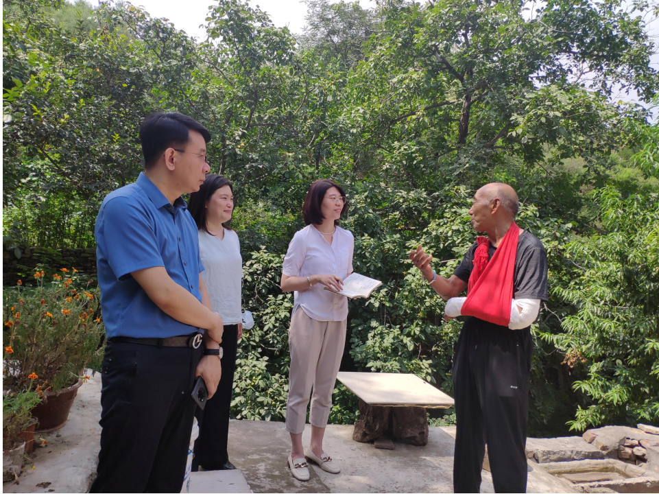
韧性家园项目调研实地走访照片