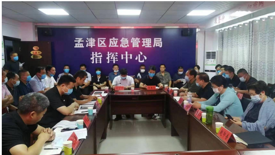
孟津区应急小站项目选址评审会