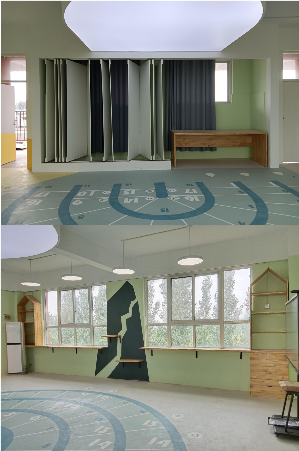
减灾教室建设效果实景照片