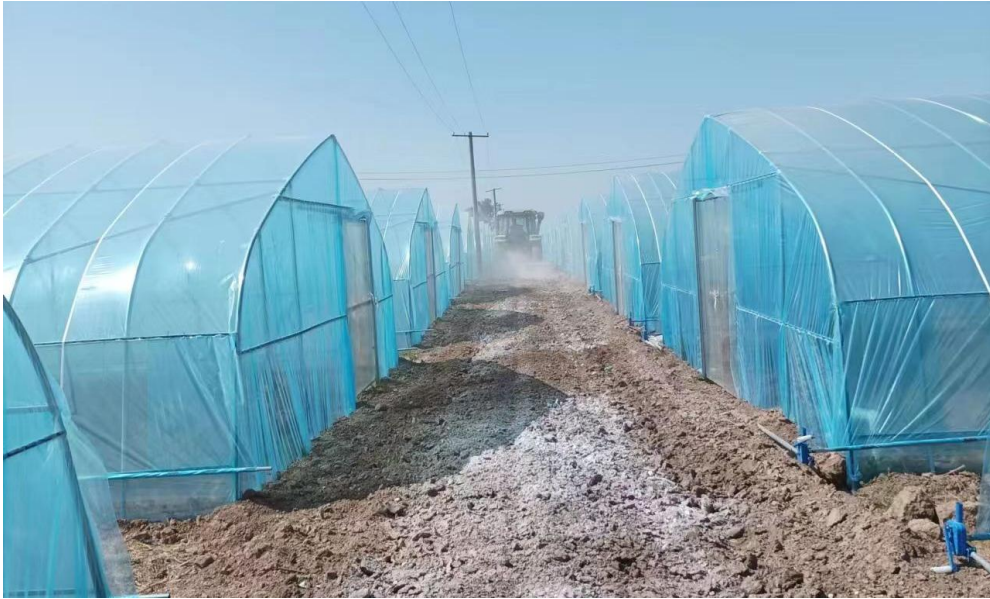
浚县新镇镇韭菜种植示范基地项目

重建，目前已全部完成 99 个项目恢复重建，其中 92 个项目已完成验收拨款，7 个项目已完成验收，资料审核中。