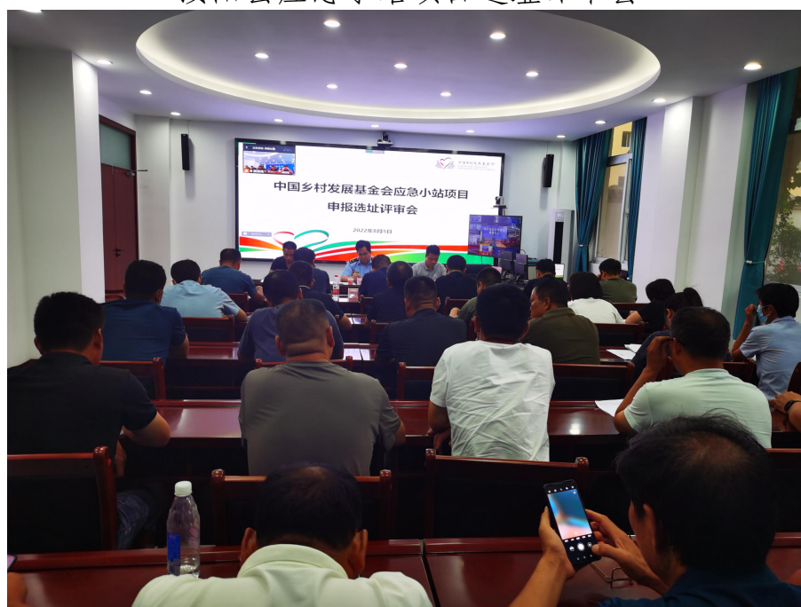
卫辉市应急小站项目选址评审会