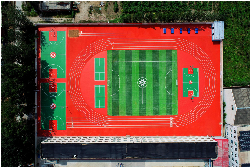
新乡市凤泉区大块第四小学