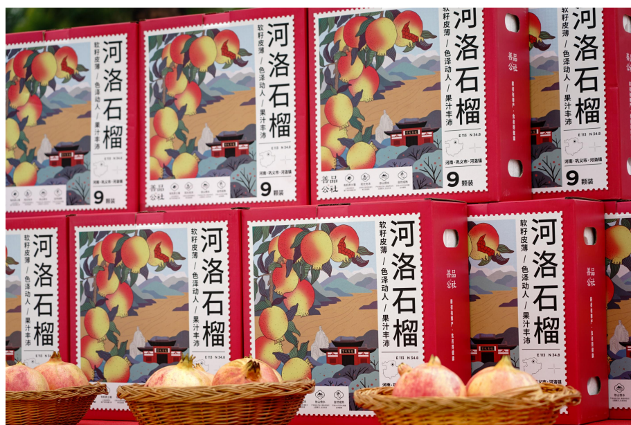
善品公社河洛石榴上市发布会