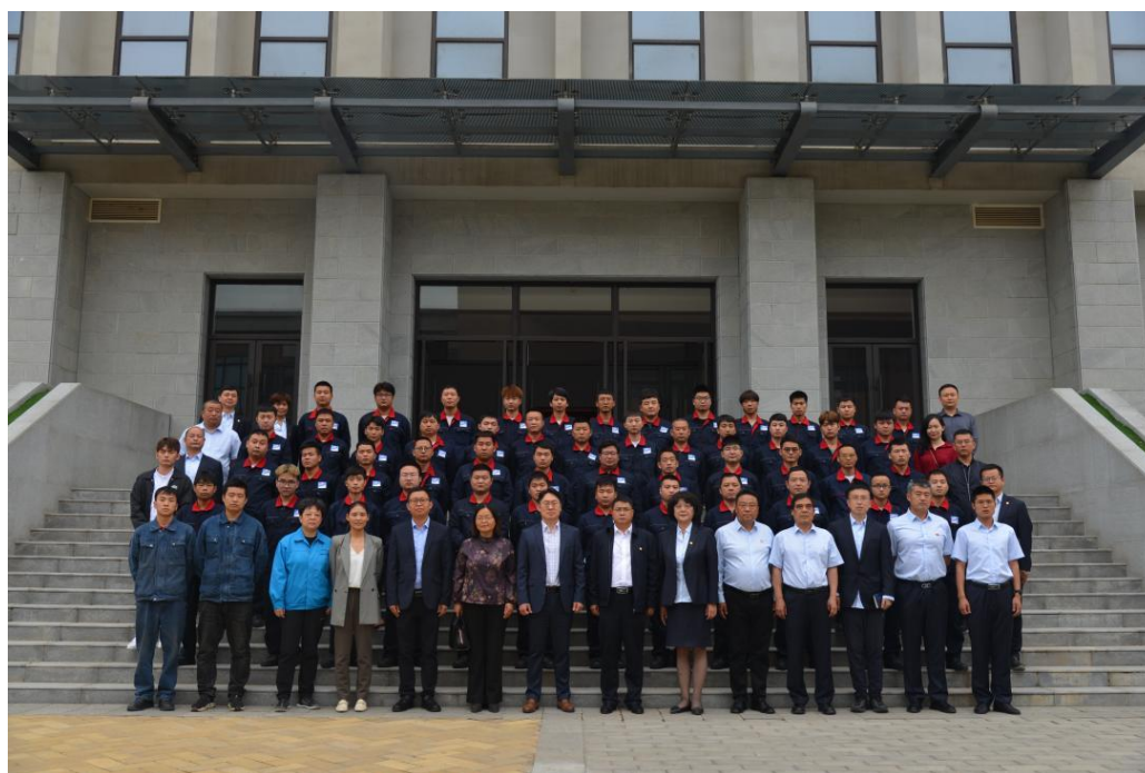
首期三星（中国）半导体职业赋能公益培训项目结业典礼