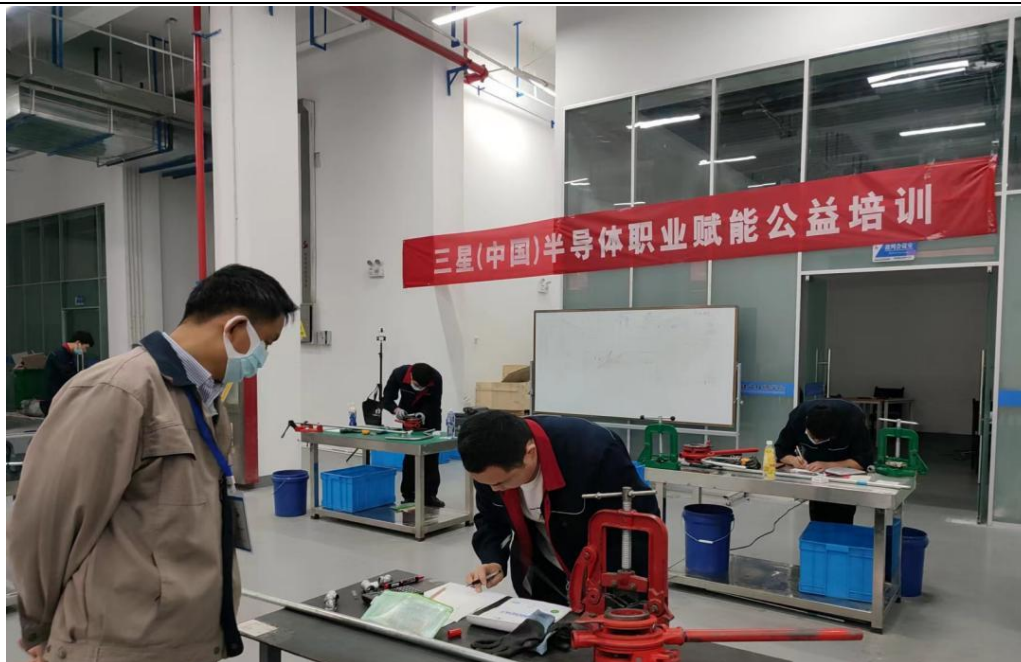
三星（中国）半导体职业赋能公益培训