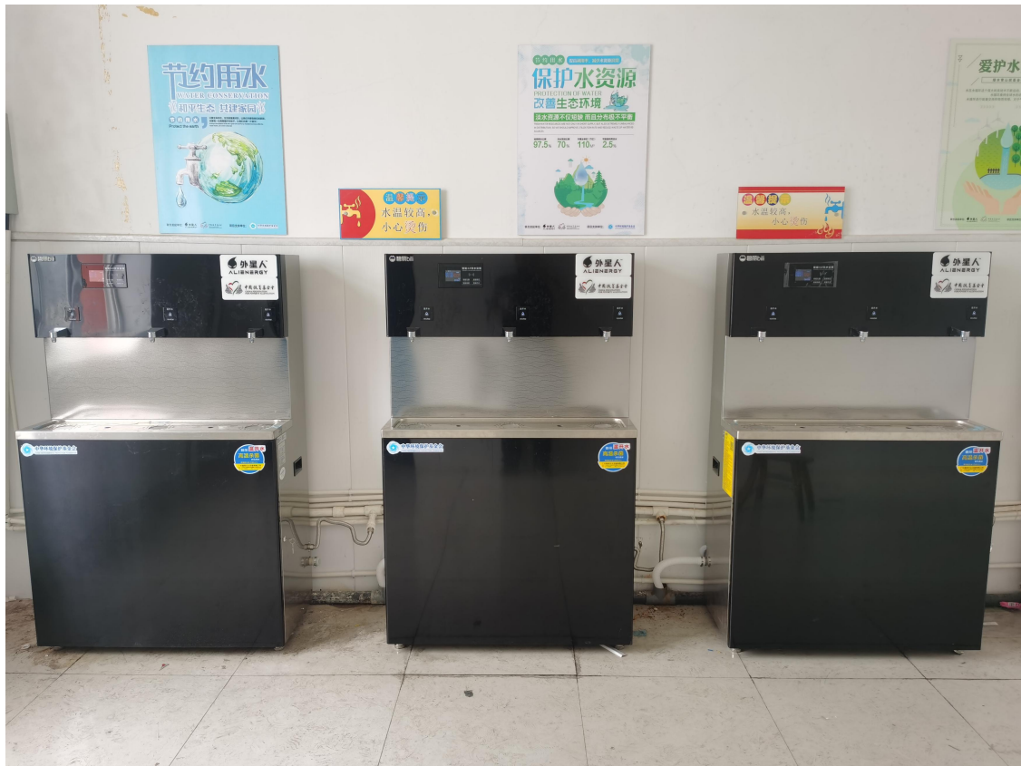
(柳泉小学校园生态补水项目完工图)