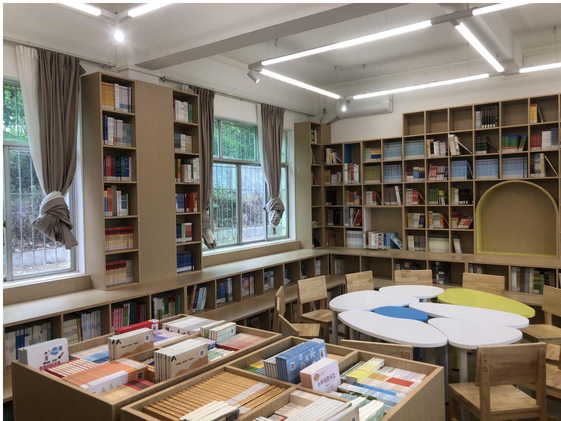
(全面建成后的南网知行书屋)