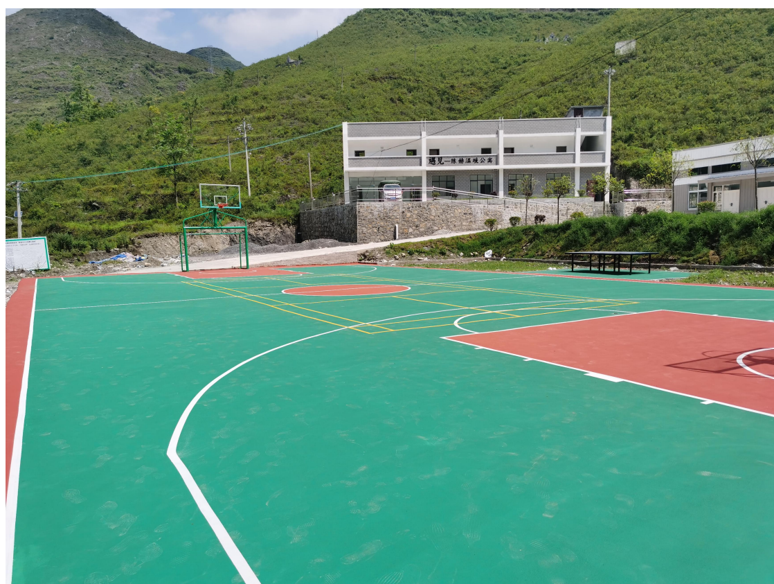
(人才公寓配套设施完工图)