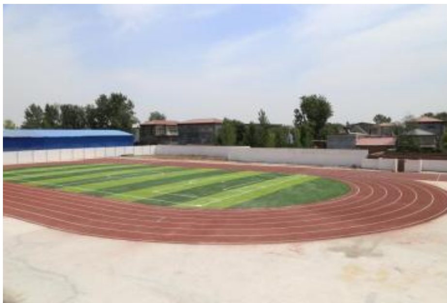
浚县屯子镇周村中心校