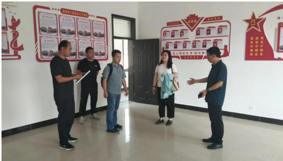
鹤壁市应急小站项目选址调研