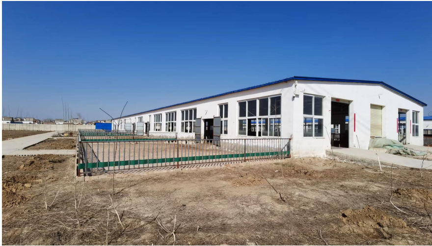
扶贫项目援助项目竣工照片