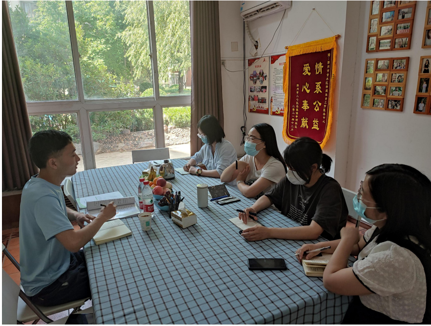
项目执行团队拜访社会组织座谈会照片

3、为推进应急小站项目实施，2022年第二季度项目执行团队组织项目区开展线上申报说明会，并前往实地选址调研；6月24日，完成鹤壁市浚县、淇县应急小站项目申报评审工作。