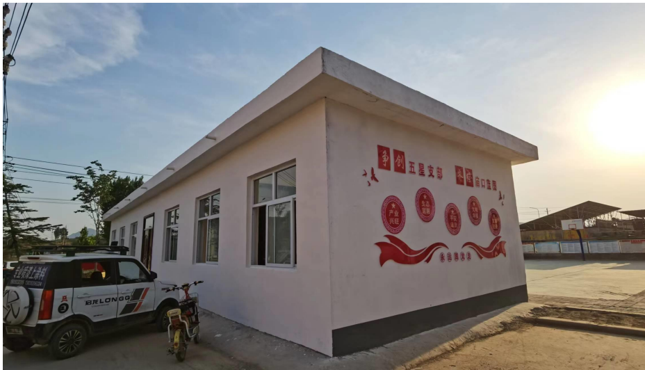
卫生室项目施工照片