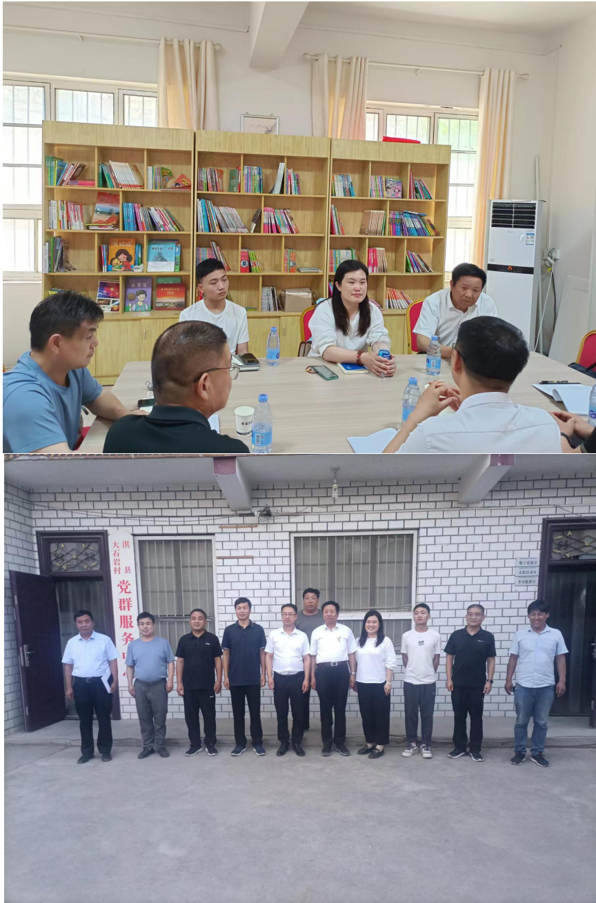
韧性家园项目推进会及调研照片