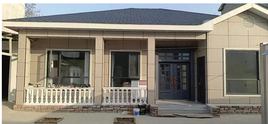
农房补贴项目竣工照片