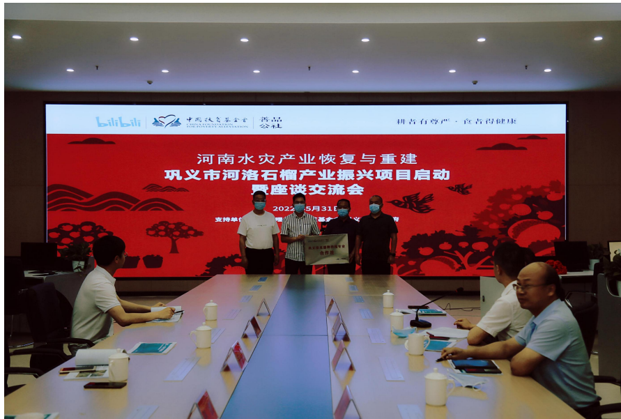
河洛石榴项目启动仪式