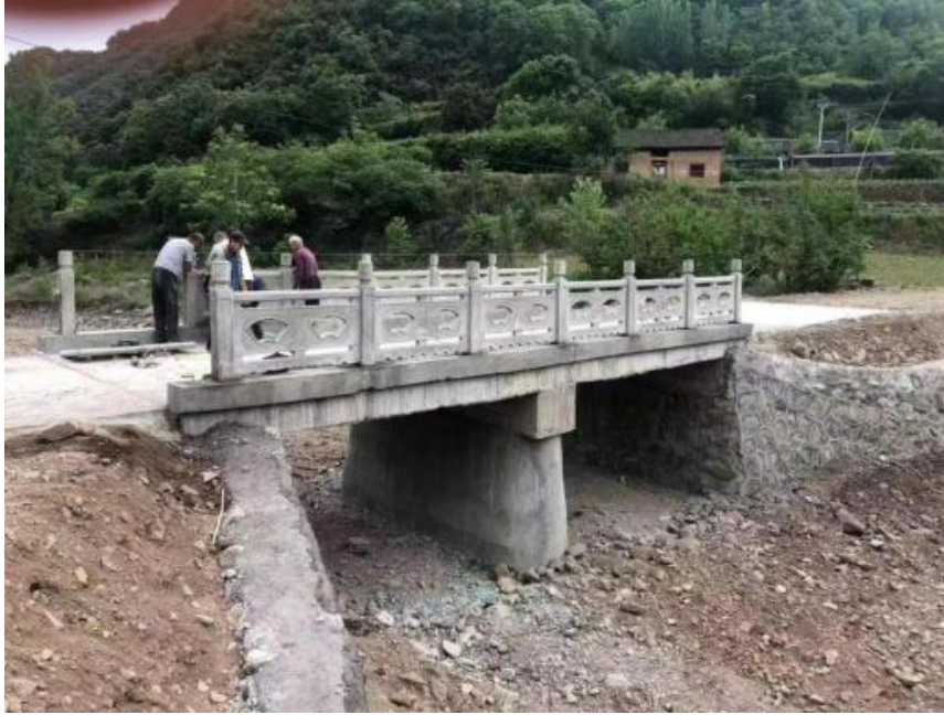
洛阳市栾川县秋扒乡北沟村九月沟门桥竣工图