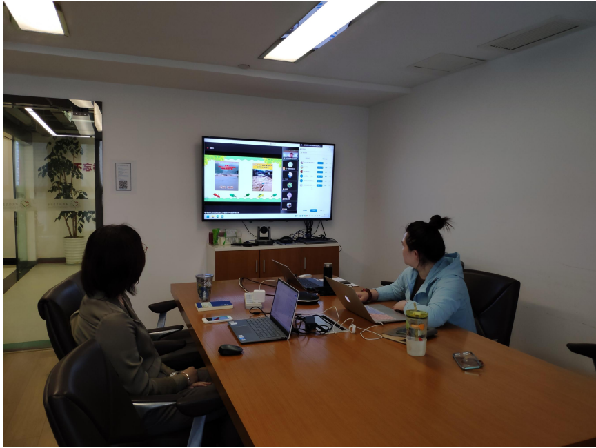
校园减灾教室项目课程培训及督导执行机构评审会照片

2、6月13日至6月14日，我会灾害救援项目部项目执行团队前往郑州市金水区梓闻社会工作服务中心、郑州社会工作协会、濮阳市龙祥社会工作服务中心，就机构发展情况、减防灾经验、减灾教室项目合作等方面进行交流探讨。