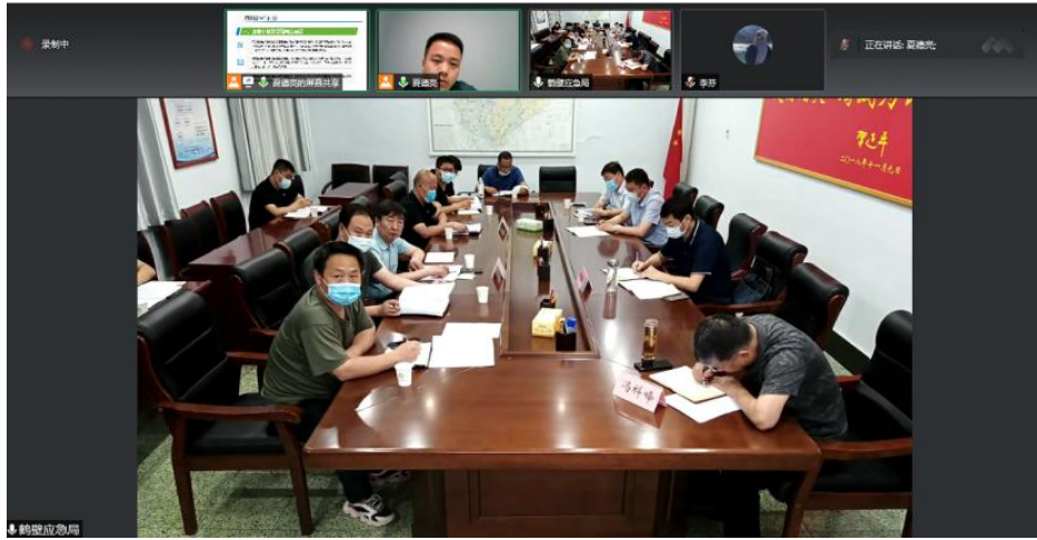
鹤壁市应急小站项目线上申报说明会