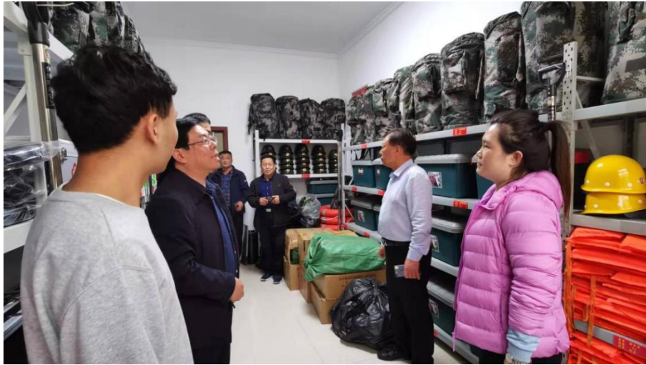
孟津区乡镇备灾库项目实地调研