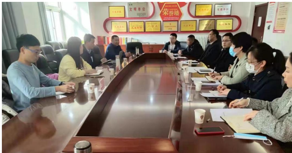
焦作市项目沟通座谈会