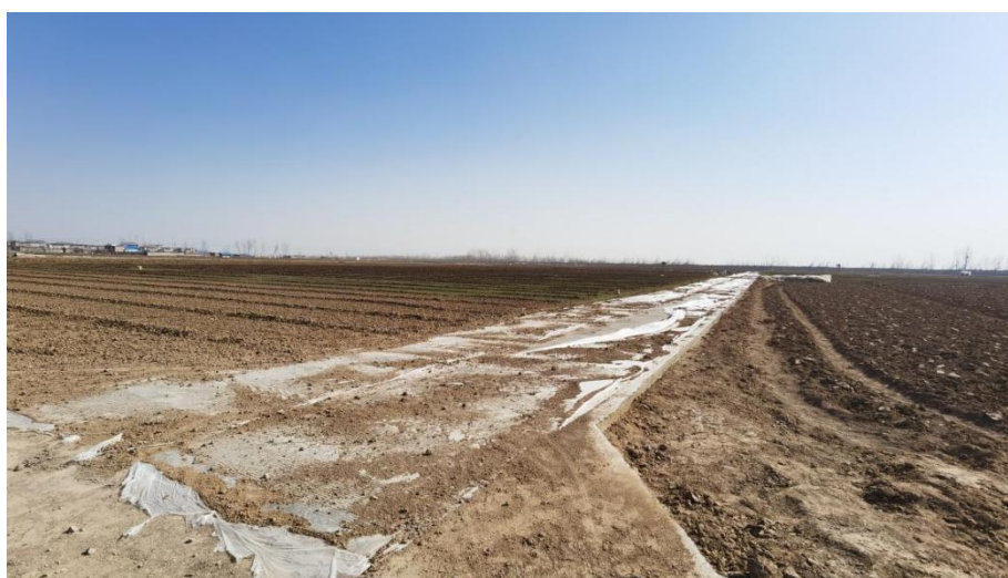
浚县扶贫项目援助项目竣工现场