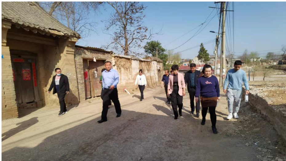
伊川县韧性乡村项目实地调研