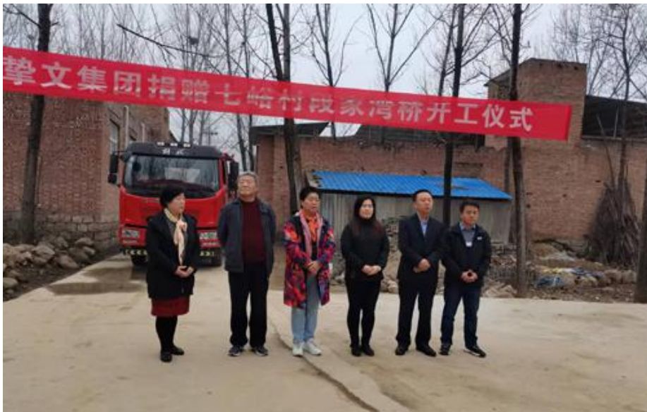
溪桥工程项目——挚文集团捐赠七峪村段家湾桥开工仪式