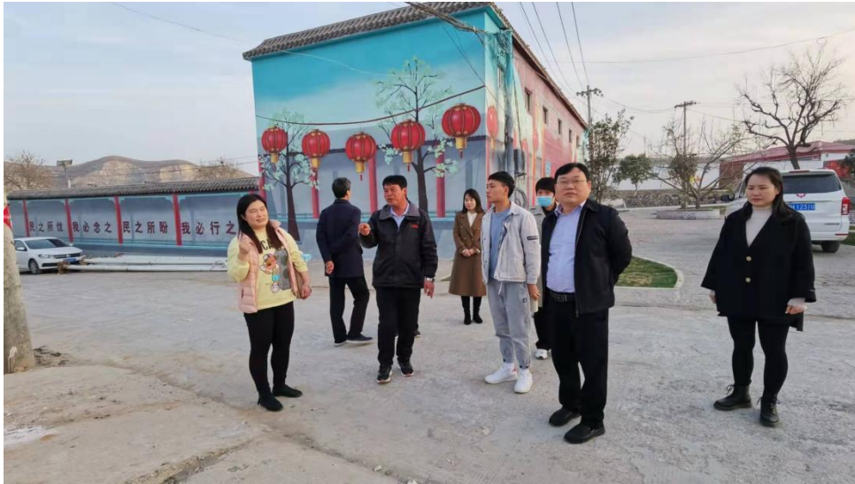
修武县韧性乡村项目实地调研