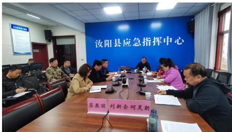
汝阳县乡镇备灾库项目调研座谈会