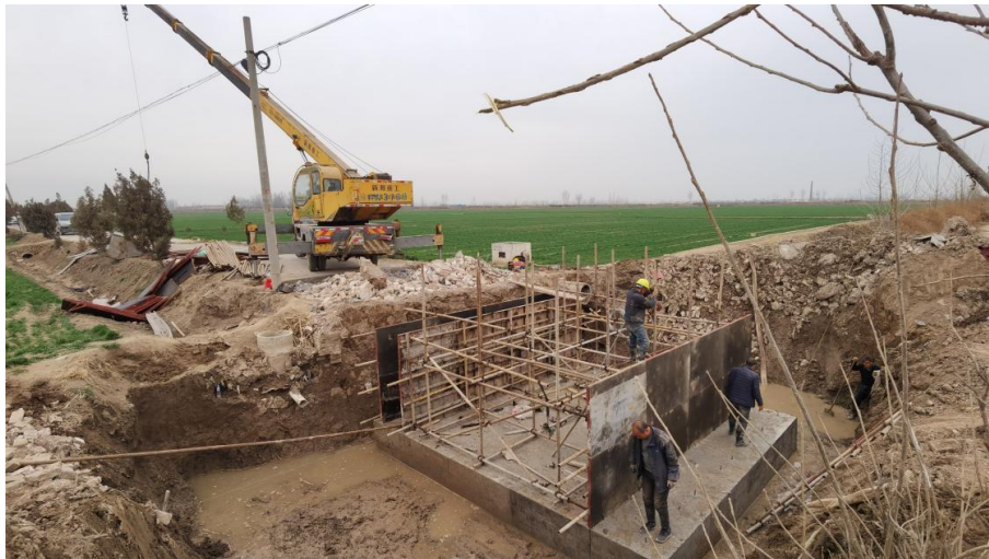
辉县市溪桥工程项目施工现场