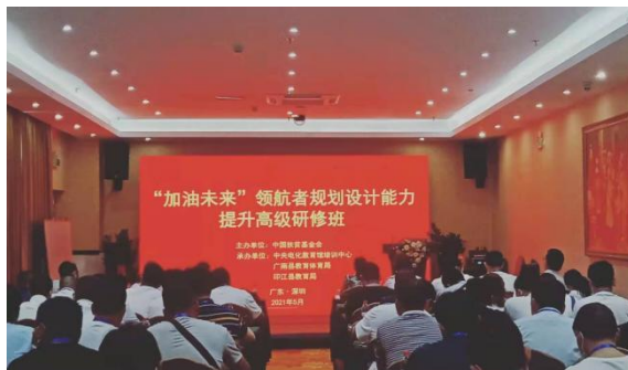
领航者们认真学习中