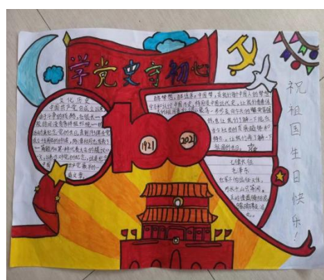
加油未来六一主题活动作品展示