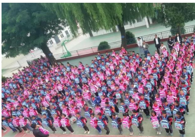
威宁县项目学校为学生发放加油关爱包裹