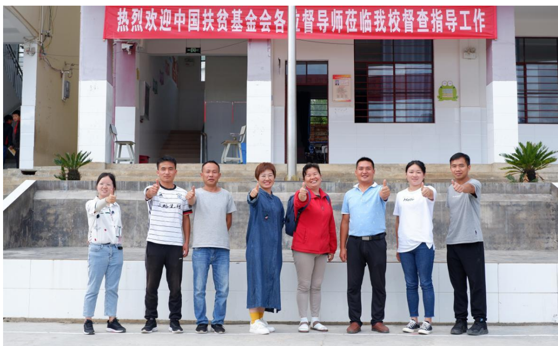
加油未来督导组与加油教练员工作合影