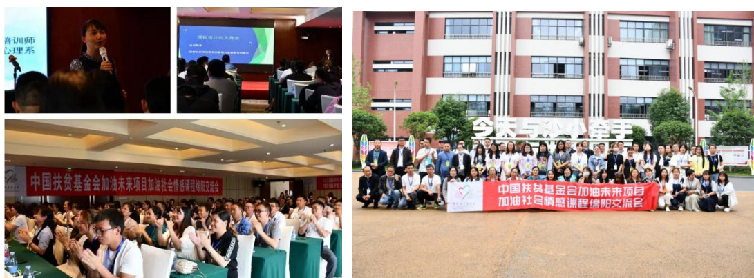
加油社会情感课程交流会活动现场

2021 年，加油未来项目积极组织项目学校参加各类交流会活动，进行交流、研讨和学习。镇雄县、会泽县、赫章县 118 所学校 118 名优秀教练员到四川省绵阳市参加中国扶贫基金会加油未来项目加油社会情感课程交流会。