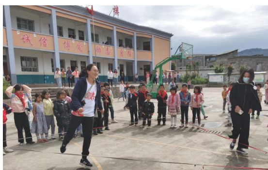
探访时月捐人与学生互动

2021 年第二季度，加油未来项目组织了 2 次 5 场探访活动，覆盖全国各地的 60 余名月捐人；第三季度加油未来项目联合 JK 公益计划、中食安泓爱心公益基金到会泽县者海镇发启小学开展探访活动。