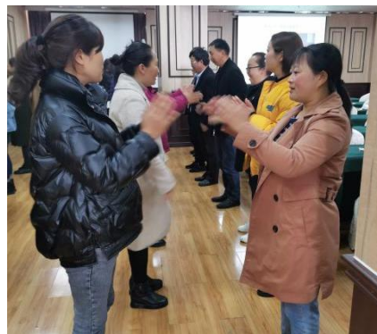
老师们参与培训中的活动