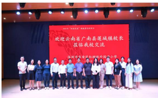
跟岗实习活动合影