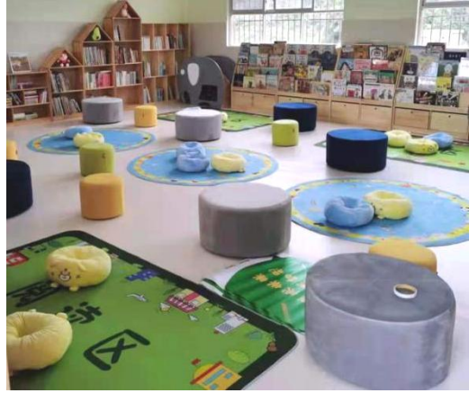
项目学校阅读空间