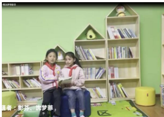
部分诵读比赛视频

2021 年 4 月 23 日，为迎接世界读书日，赫章、会泽和镇雄三地的学生开展了“知识星光·点亮未来”2021 年诵读大赛，共计收到参赛视频 160 余个，33 份作品获奖。为庆祝六一儿童节，发起了“阅读自然”绘文比赛，活动共计收到 100 余幅作品，30 位学生获奖。