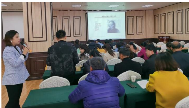
老师们在培训中认真学习