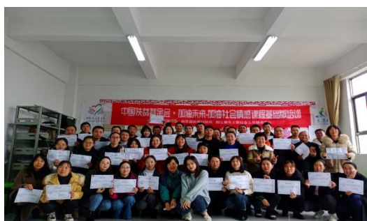
为教练员们发放培训学时证