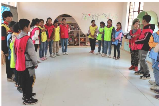
学生们在社会情感空间开展活动