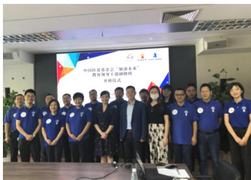
研修活动现场全体合影

2021 年 10 月，加油未来项目在广东省珠海市组织了教育管理干部研修活动，来自贵州、云南 5 个项目区县政府分管领导、教育局领导共计 10 人全程参加。