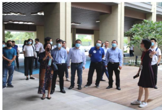
共同参观珠海金凤小学