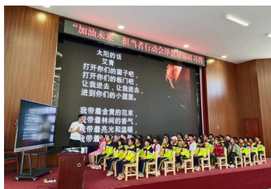
晨诵培训现场晨诵教学示范