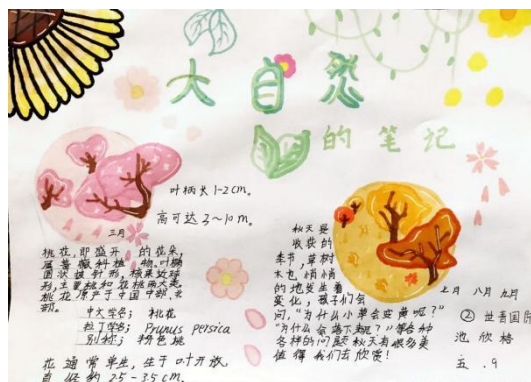
“阅读自然”绘文活动获奖作品