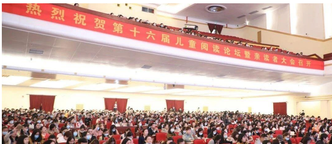
儿童阅读论坛主会场