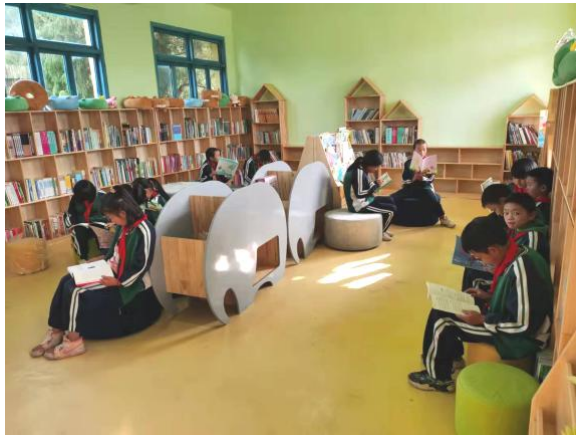
学生们在阅读空间自由阅读