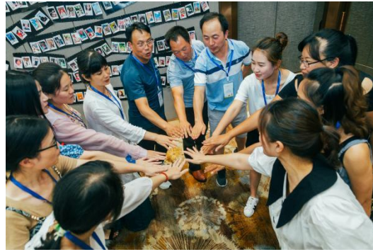
会泽老师们积极参与培训活动

截至目前，项目已经为镇雄 29 校，会泽 30 校修建了图书角，为会泽 2 校建设阅读室，并为项目学校及学生配备适合不同阅读水平学生阅读的优质书籍。