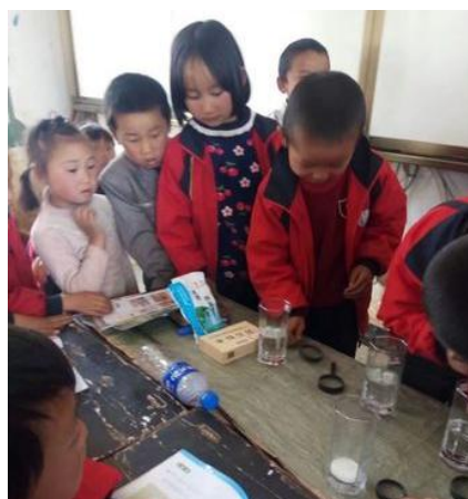
学生使用科学教室实验器材