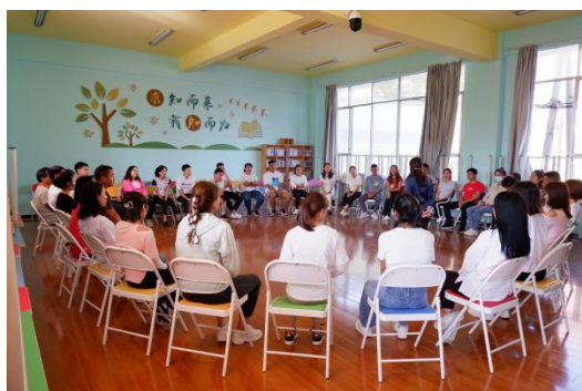
加油教练员们正在上加油培训课

2021 年加油未来为镇雄县、会泽县、赫章县、广南县、印江县和织金县展开加油教练员培训共 25 场，共计 1404 人次参加培训。社会情感课督导师团队分别于春季学期和秋季学期对镇雄县、会泽县、赫章县、广南县、印江县的 176 所学校进行了 2 次督导，通过督导了解各项目学校课程实施和落地情况，促进教练员积极成长，推动课程的持续开展。