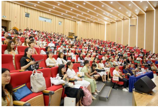
镇雄老师们学习现场