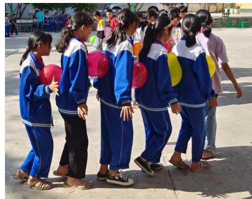
项目学校的学生正在上加油社会情感课