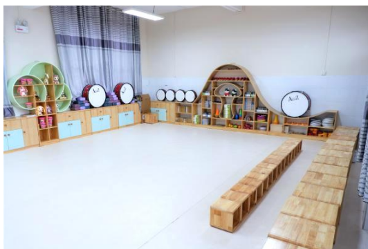
社会情感空间布置

2021 年,加油未来项目完成广南县 45 所项目学校社会情感空间打造,并已开放使用。截至 2021 年,项目已为镇雄县、会泽县、赫章县、广南县 4 县共计 167 所乡村小学建设完成社会情感空间并投入使用。