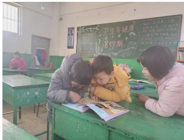
学生们一起阅读图书角图书