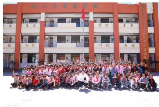
张继科与探访学校学生合影