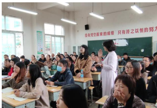
镇雄阅读培训老师们互动

2021 年，加油未来项目对镇雄县、会泽县的项目学校开展了一系列的阅读培训：组织镇雄县 29 所学校 59 位老师参加项目一阶阅读培训，组织会泽县 30 所学校 116 位老师参加晨诵课程培训；组织镇雄县 28 所学校 61 位老师参加在长沙举办的“踏上阅读的心灵奇旅”教师阅读研习营，组织会泽县 9 所学校 59 位老师参加在成都举办的“第十四届儿童阅读种子”教师阅读研习营。组织镇雄县 5 名优秀教师参加南京第十六届儿童阅读论坛暨亲读者大会，就儿童本位阅读主题与论坛专家、名师交流学习；组织会泽县 32 所学校的 32 位校长/老师前往四川成都、德阳参加以“好的教育与阅读之美”为主题的校长外出访学活动。