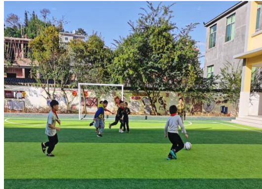
学生们在新建足球场开心踢球