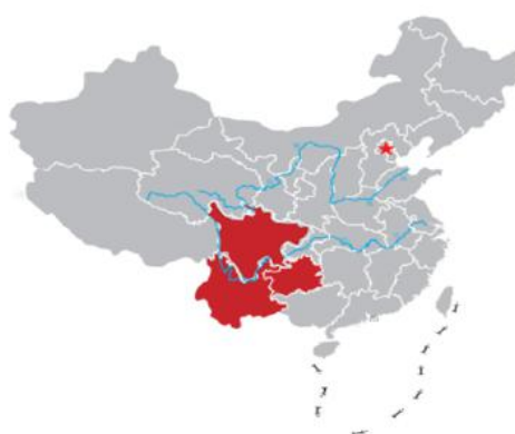
项目累计受益地图