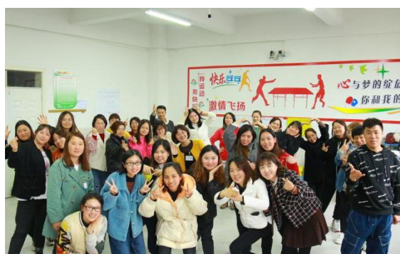
项目老师们培训合影