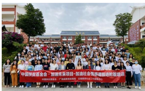
加油社会情感课程培训合影