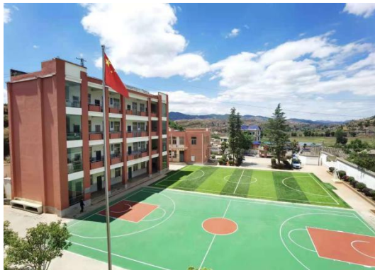
加油塑胶篮球场和足球场建设

2021 年，加油未来项目为镇雄县中屯镇朱家沟小学和赫章雉街乡木戛小学完成悬浮板篮球场建设，为会泽乐业镇丫口小学完成塑胶篮球场和足球场建设；为广南县坝汪小学建设足球场，为太康县清集镇二郎庙小学修建篮球场，使学生在更安全、专业的环境中开展运动活动。