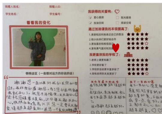
结对学生填写的成长档案卡