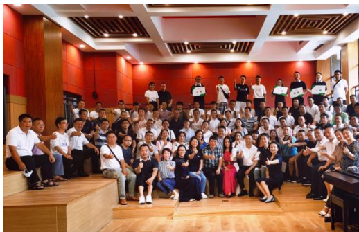
领航者游学活动合影