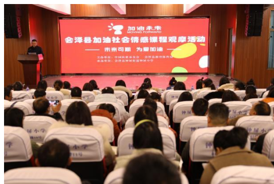
示范课程上课现场