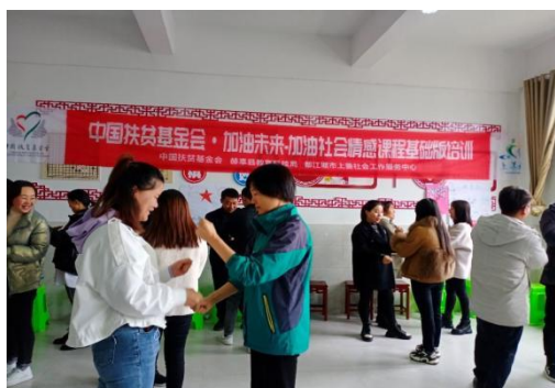
培训师进行教学示范