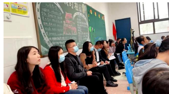
校长们深入课堂学习