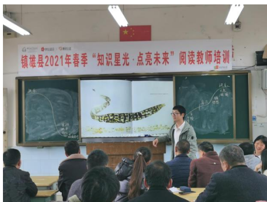
老师们正在上阅读培训课