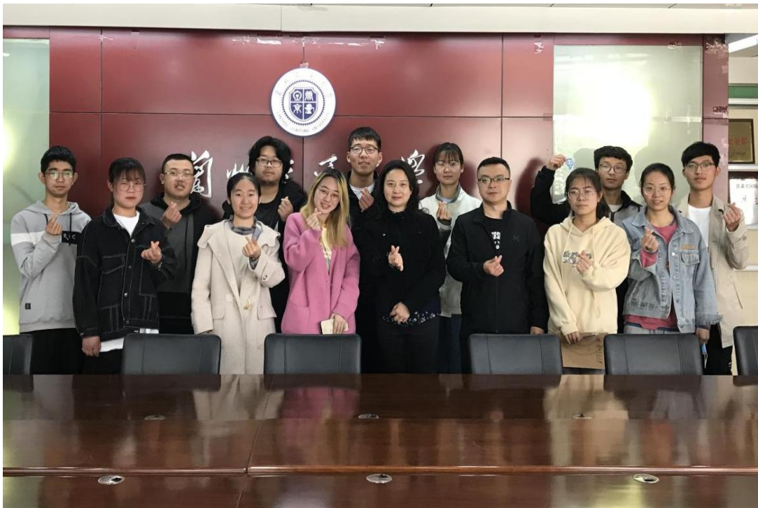
(图 5: 兰州交通大学交流合影)