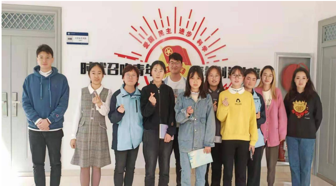
(图 7: 甘肃中医药大学交流合影)