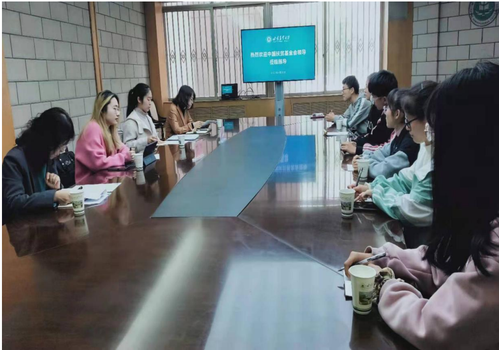
(图 4: 甘肃农业大学项目受益学生分享)