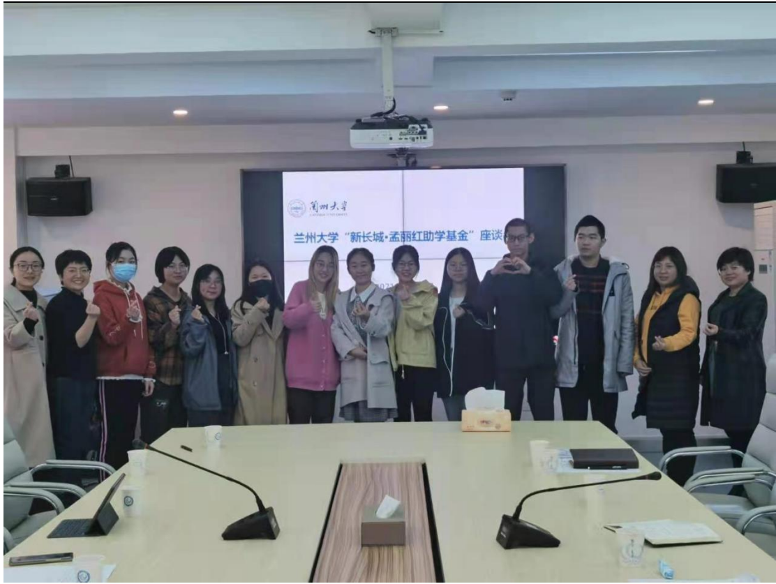
(图 6: 兰州大学交流合影)