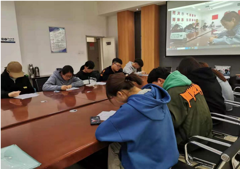
(图 3: 西北民族大学项目受益学生填写回访问卷)