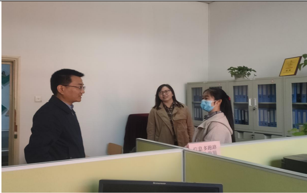
(图 8：项目组工作人员与西北师范大学资助中心老师交流)