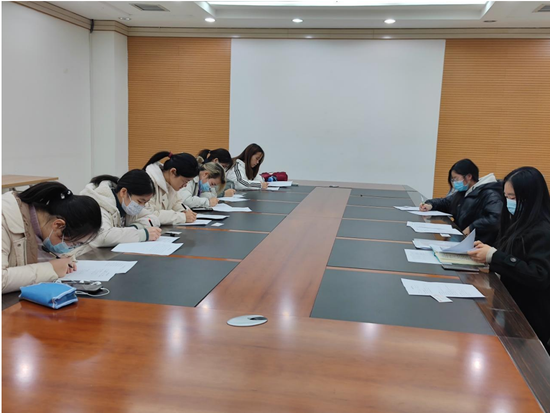
(图 10: 中国农业大学项目受益学生填写回访问卷)