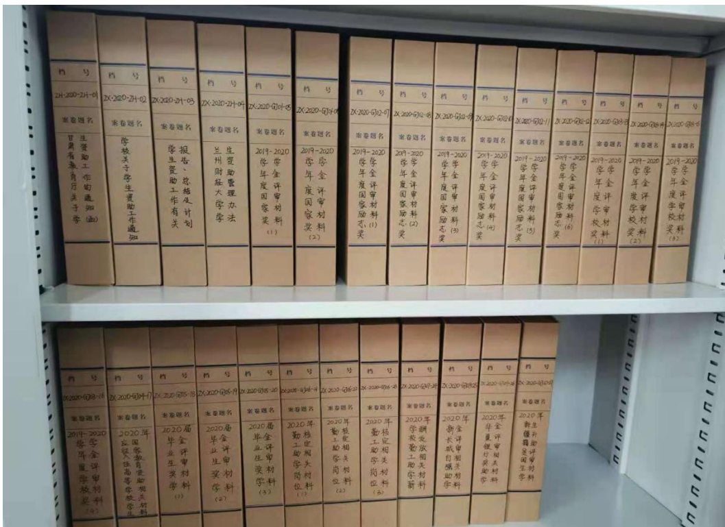
(图 9：兰州财经大学项目档案管理)