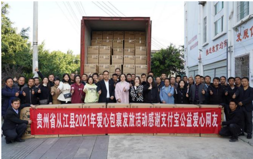
从江县发放包裹照片

2021 年度，项目陆续在河南滑县、陕西西乡县、青海杂多县等 22 个县开展发放活动，累计组织 20 场项目县操作培训会，为 419400 名农村小学生送去爱心包裹。