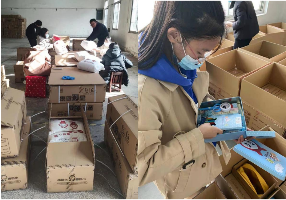
爱心包裹志愿者验货