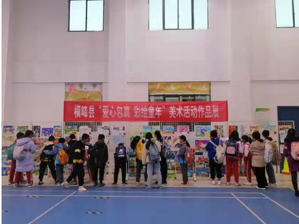
横峰县“爱心包裹·绘彩童年”美术作品展