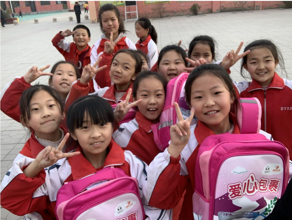
学生领取爱心包裹开心的笑容