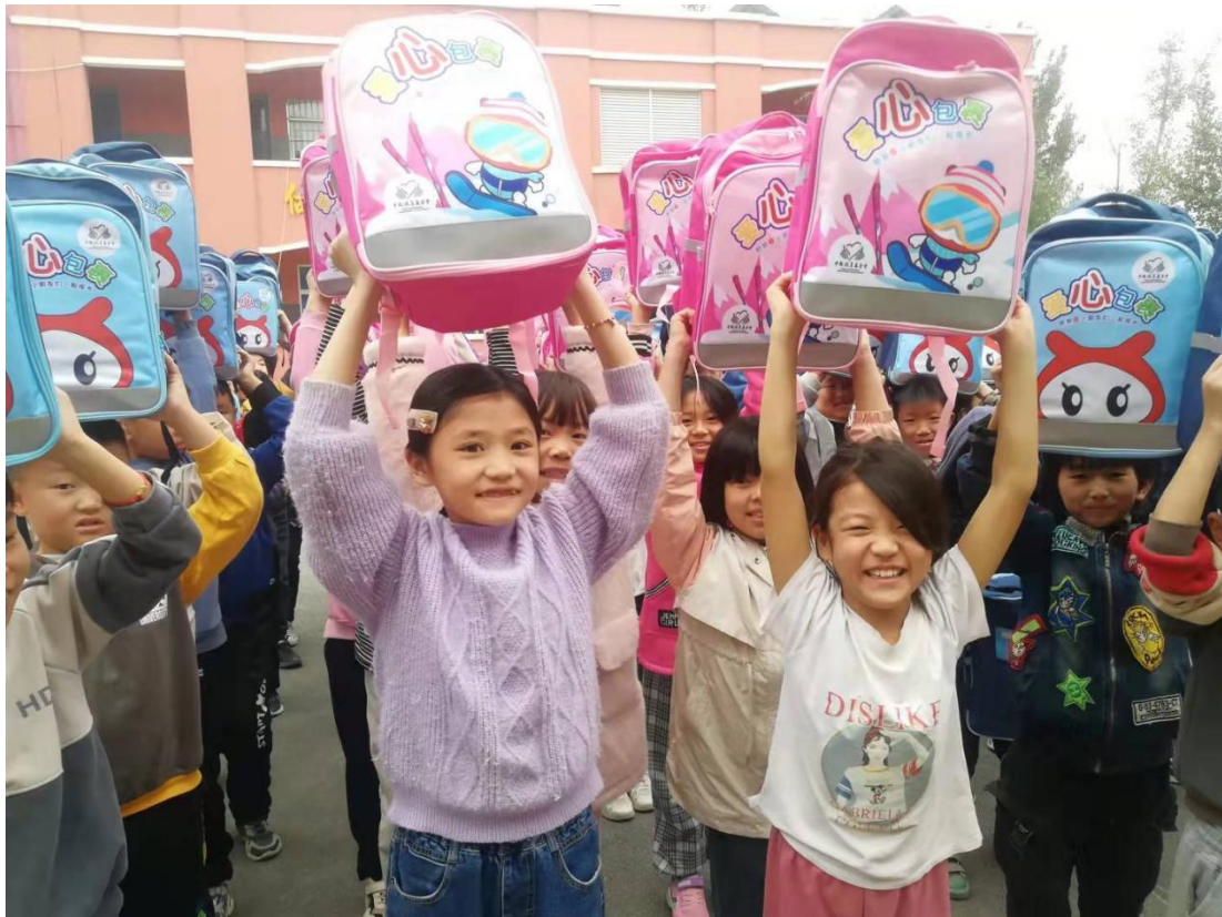
受益学生高举爱心包裹