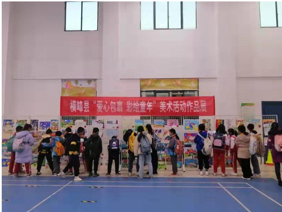
横峰县“爱心包裹·绘彩童年”美术作品展