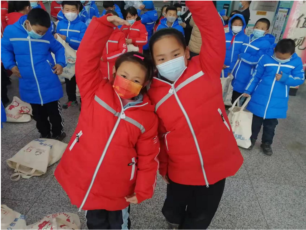
学生穿上温暖包的羽绒服后合影