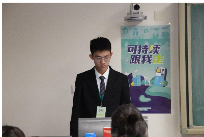
(北京化工大学校内赛选手答辩)