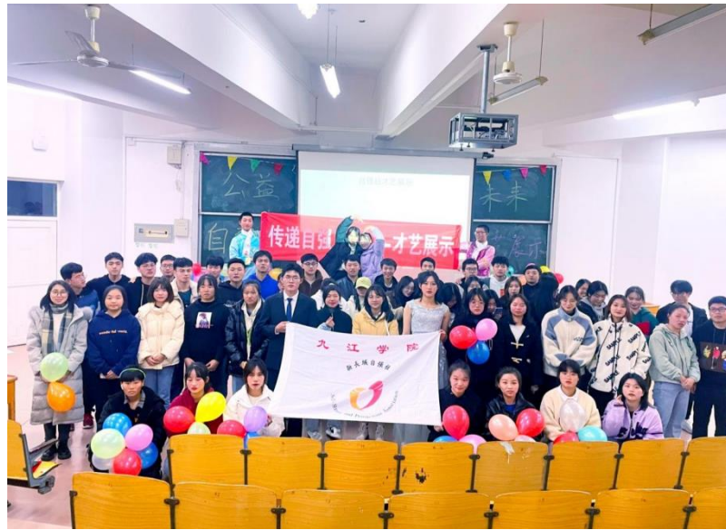
(图：九江学院自强社开展“传递自强之后-才艺展示”活动)