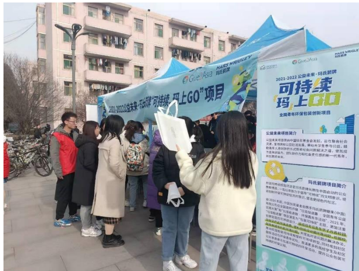
(图：山西农业大学线下宣传)