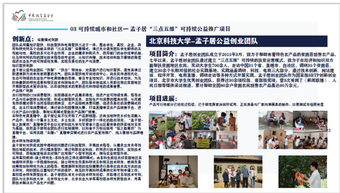
(图：北京科技大学团队项目介绍)

入围全国赛的项目都提出了极具现实意义的问题，以创新性思维提出解决思路。如北京科技大学的孟子居三点五维可持续公益推广项目，实现创业+实践+扶贫相结合，在全国签约建立 30 余个长期对接的社会实践基地；四川大学的“性心乡息”乡村儿童性教育活动项目关注儿童性教育发展，致力于保护乡村儿童；上海交通大学的解忧杂货铺自闭症患儿融合教育项目，提出对自闭症儿童进行多样化的教育培训方式。所有入围队伍继续完善项目并开展实践活动。