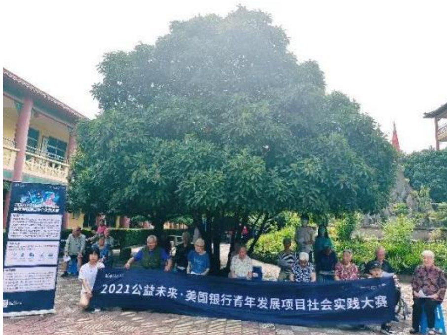
（图：西安建筑科技大学线下实践活动合影）