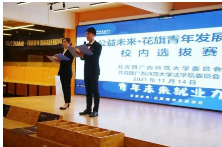
(图：广西师范大学校内赛答辩)