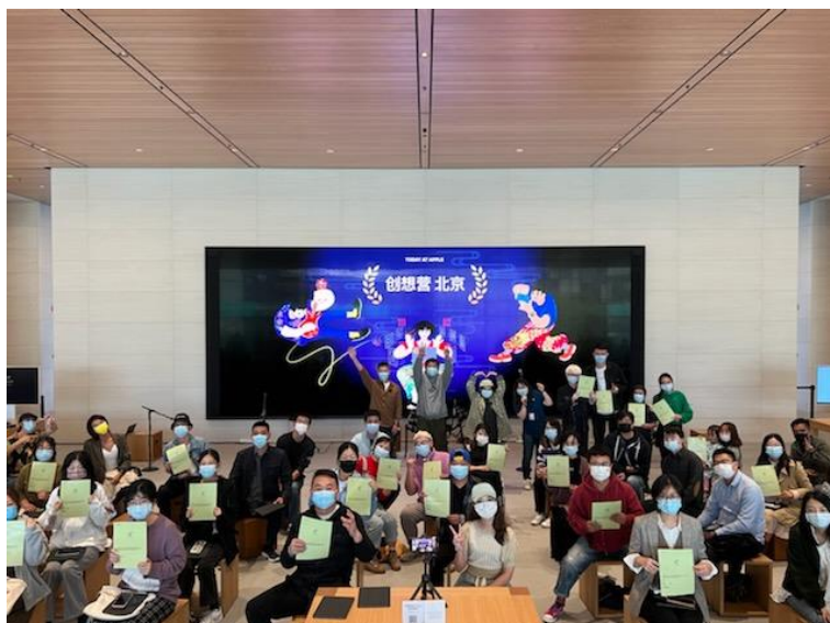
(图：结营仪式全场大合影)