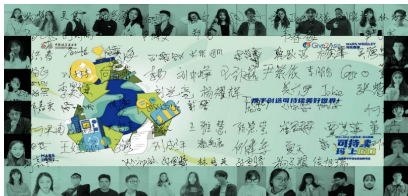
(图：启动大会电子手写版签名墙留念)

2021-2022 年公益未来·玛氏箭牌 可持续，“玛”上 Go 项目旨在鼓励大学生关注包装可持续议题，并且运用可持续思维和创新意识开展公益实践活动，影响更多社区居民参与。今年的项目在线上以互动直播的方式正式启动，并继续在校园开展，且在活动形式、高校支持、传播推广等方面进行了创新和升级，将分为包装可持续设计大赛、社区倡导活动、环保青年大会三个部分。