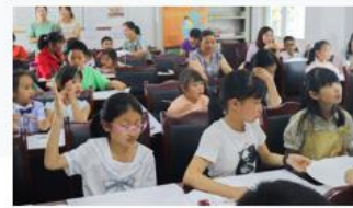
(图: 四川大学团队项目介绍)