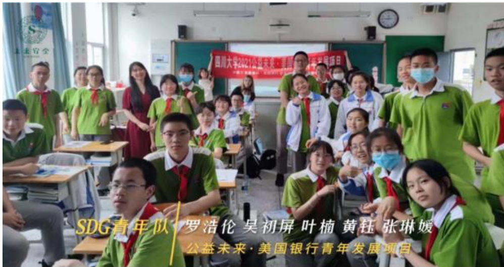
(图：四川大学线下实践活动合影)