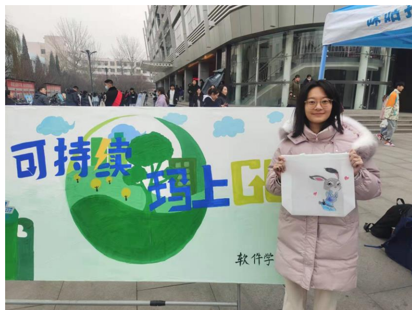
（图：山西农业大学线下活动）

在高校社团负责人培训会顺利结束后，各社团在校内展开了大赛宣传活动及校内赛评选。经过 55 所高校学生校内的传播和动员，截至目前全国有 784 报名参赛，提交 670 份方案。