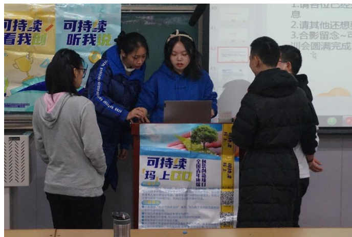
(图：南开大学线下宣讲)