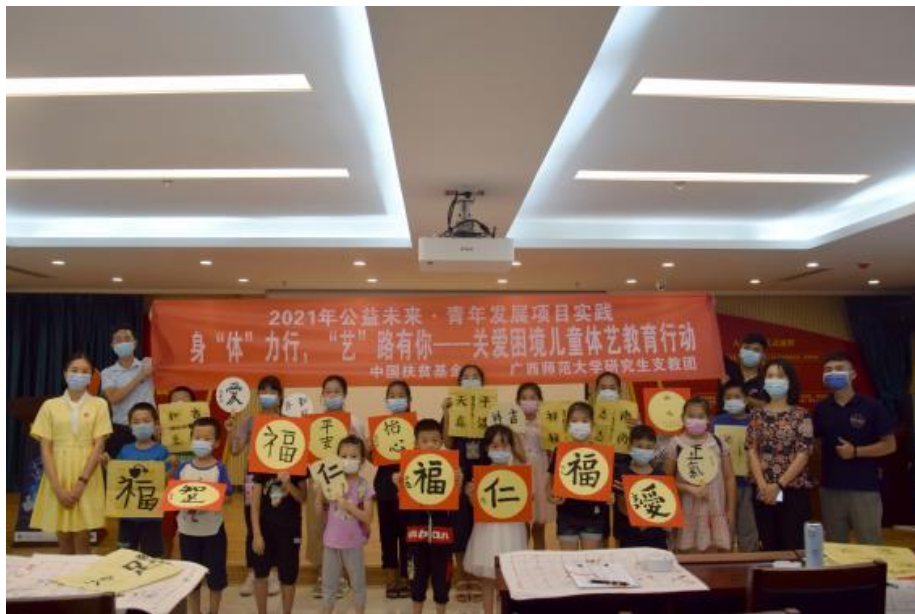
(图：广西师范大学线下实践活动合影)