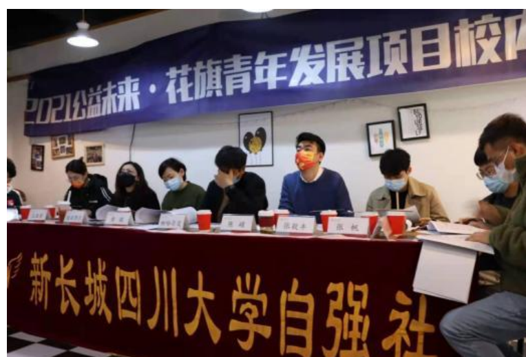
(图：四川大学校内赛评审现场)

截至 2021 年 12 月 31 日，2021 公益未来·花旗青年发展项目共招募到参与高校 7 所，分别为四川大学、中国海洋大学、长沙理工大学、河北工业大学、广西师范大学、天津天狮学院、晋中信息学院。截至目前社会实践挑战大赛共收集报名方案 315 份，1429 名高校大学生参与，影响青年弱势群体 1560 人。目前共 126 支队伍已获资金支持晋级校内初赛。青年就业力课程已举办 10 期，累计影响 2400 人次。