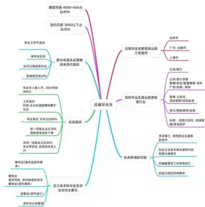
(图：青年就业力思维导图)