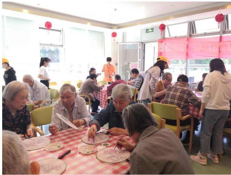
(图：南京中医药大学聚宝山老人院志愿服务活动现场)