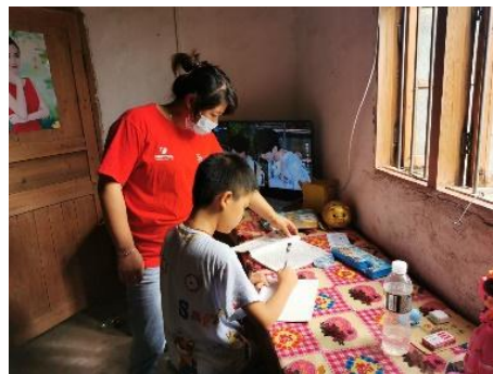
左图：贵州赤水市五里村童伴妈妈入户走访，登记孩子基本情况 右图：江西乐安县前团村童伴妈妈入户走访，辅导儿童功课