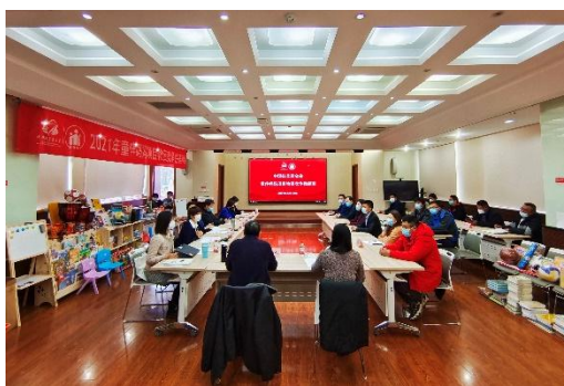
童伴妈妈项目物资竞争性磋商