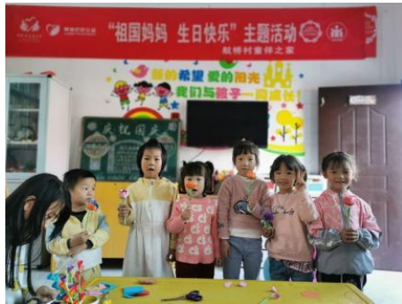
左图：湖北竹山县罗家坡村童伴之家开展“感恩有你，伴我同行”主题活动 右图：江西乐安县航桥村童伴之家开展“折支花儿赠祖国”主题活动