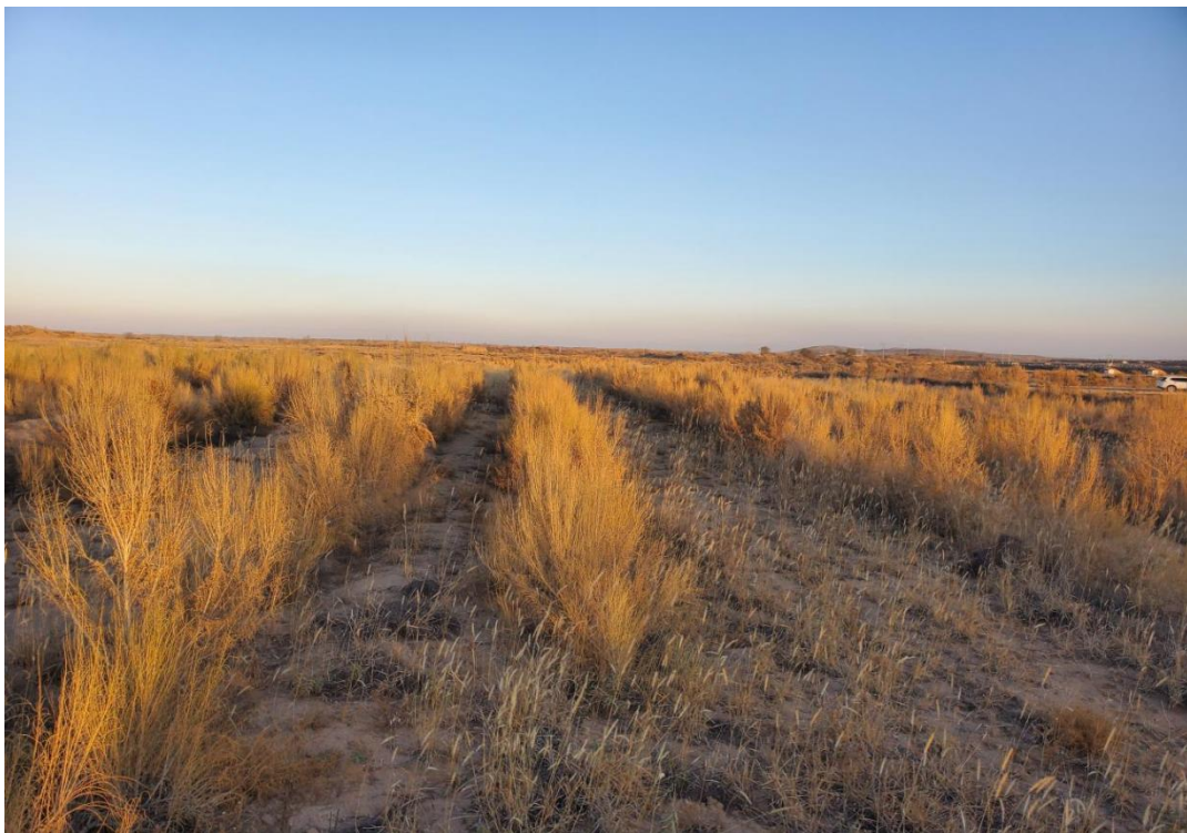
图 2 项目区梭梭照片