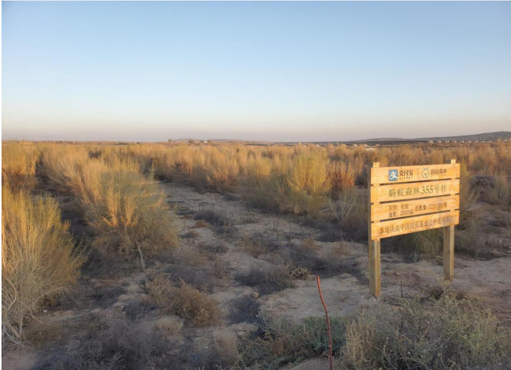
图 1 项目区梭梭