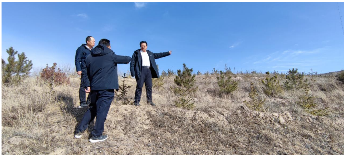
图 2 渭源县地块考察照片