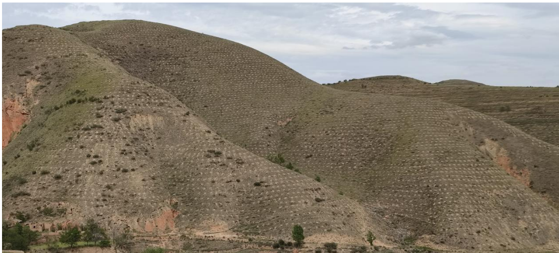
图 4 项目区照片