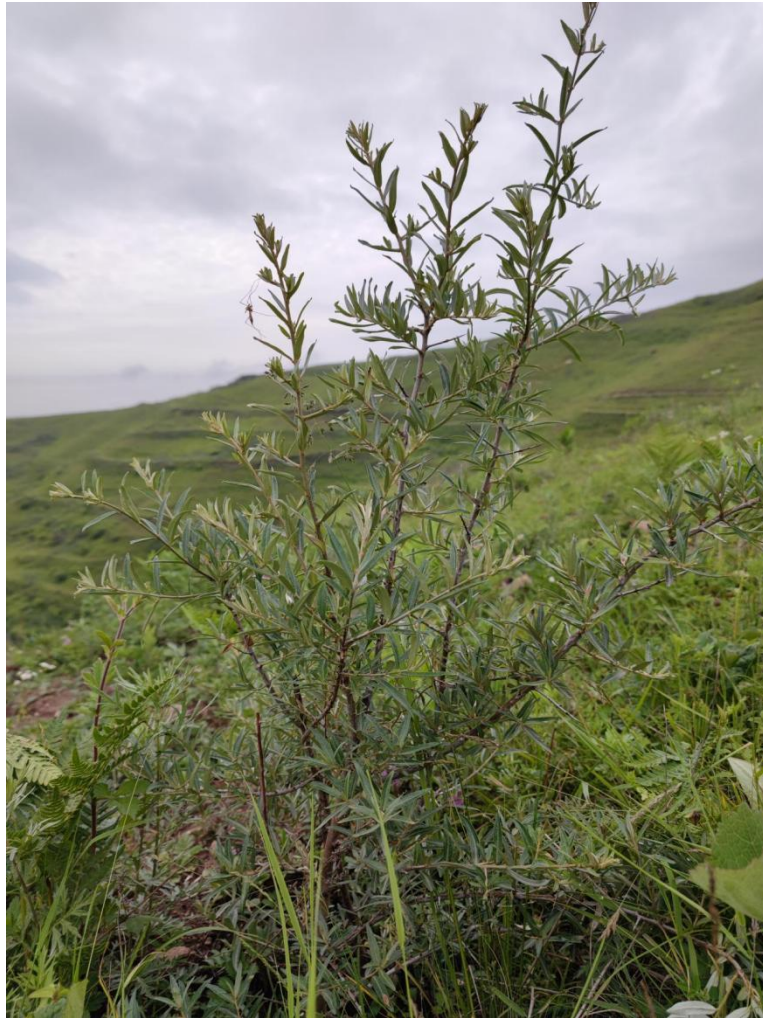
图 3 项目区沙棘照片