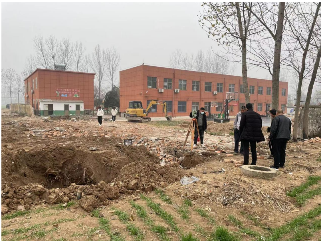
二郎庙小学开工建设图

横峰县港边石油中心小学建设项目于2020年9月底开工建设，截至2021年12月已综合楼和2栋教学楼、食堂、宿舍、200米塑胶运动场基层浇筑、硬化、