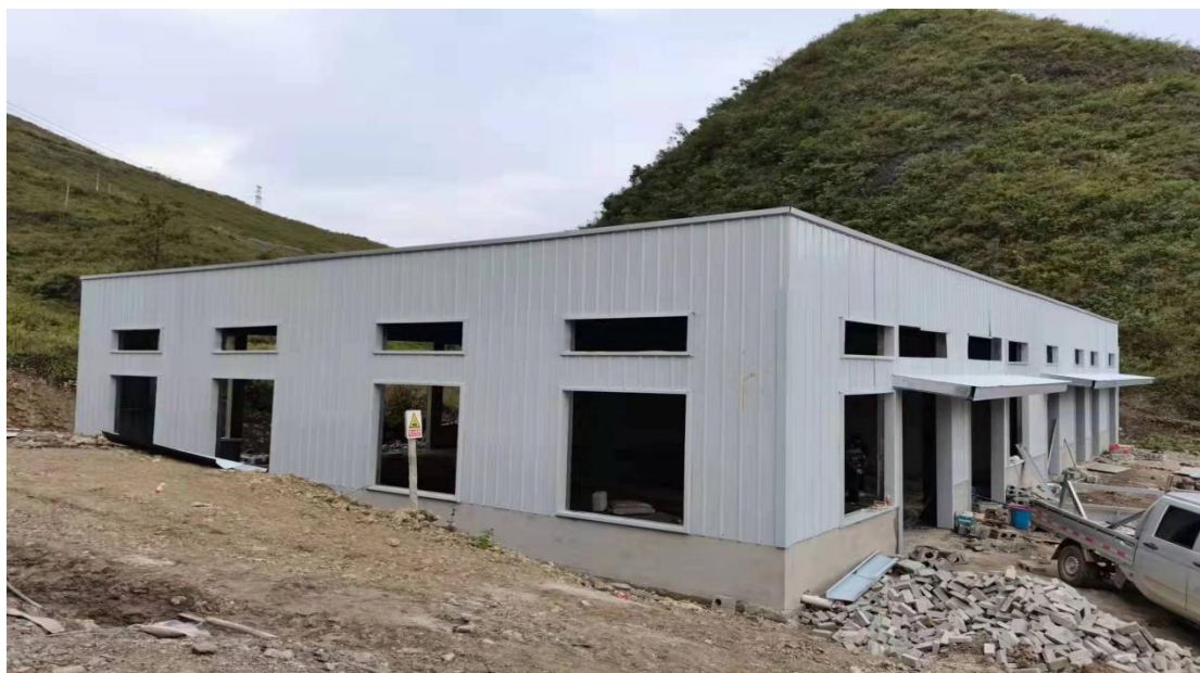
电商孵化馆主体建设完成图

2020年5月16日，陈赫联合中国扶贫基金会宣布成立“陈赫乡村公益爱心基金”，重点帮扶国内欠发达地区的乡村，通过乡村基础设施建设、农产品推广等方式助力乡村振兴。于4月确定对晴隆县茶马镇人才公寓及电商孵化馆进行援助建设，5月签订项目援助协议，6月初项目开工建设。截至12月31日，人才公寓及电商孵化馆建设已进入内部装修阶段，预计于2022年1月完成并竣工。