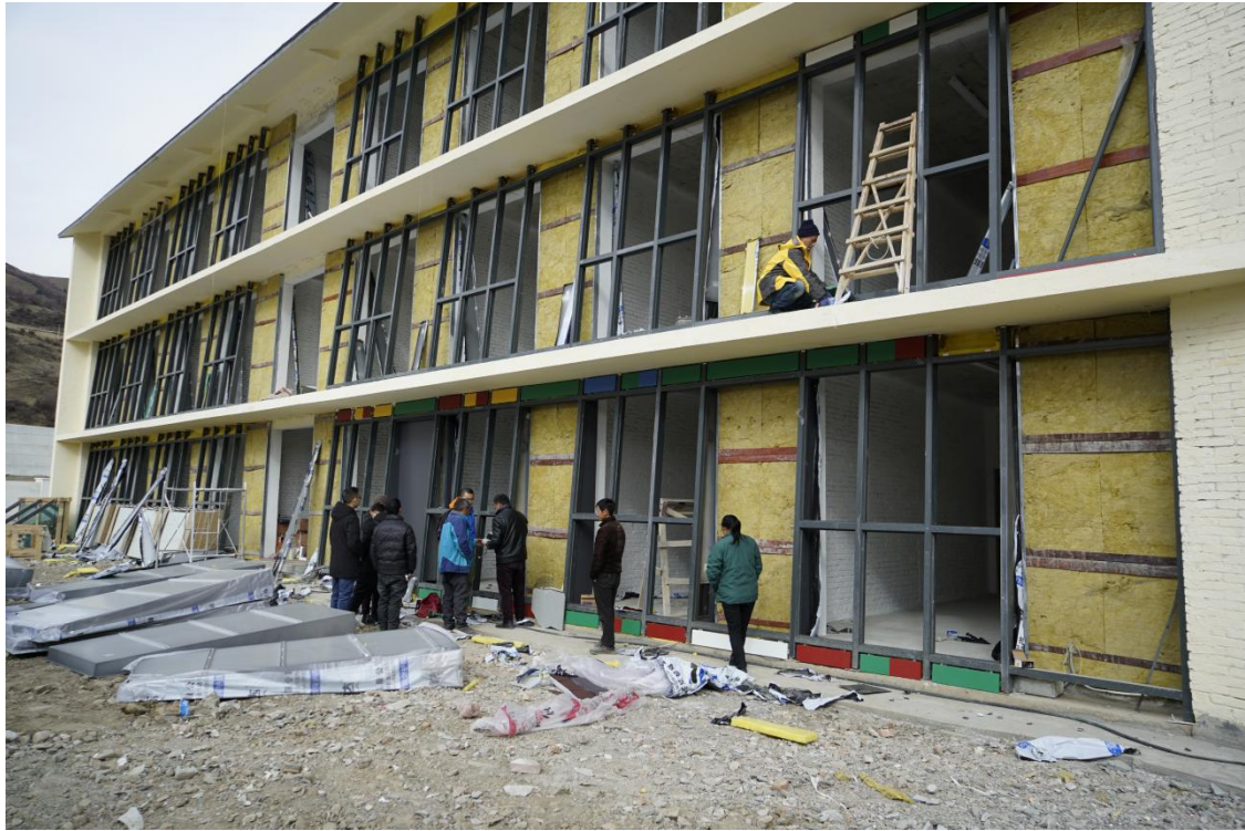
安羌乡中心校建设图