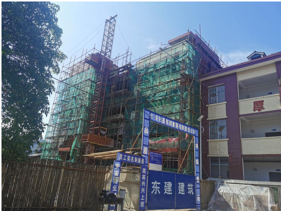
奎溪坪完小建设图