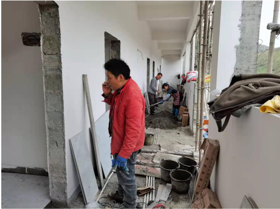
人才公寓内部装修图

“生态校园补水计划”于2021年12月14日，在宁夏回族自治区吴忠市红寺堡区马渠小学正式启动。12月20日至21日，在宁夏回族自治区吴忠市红寺堡区包括马渠小学在内的五所学校展开考察。