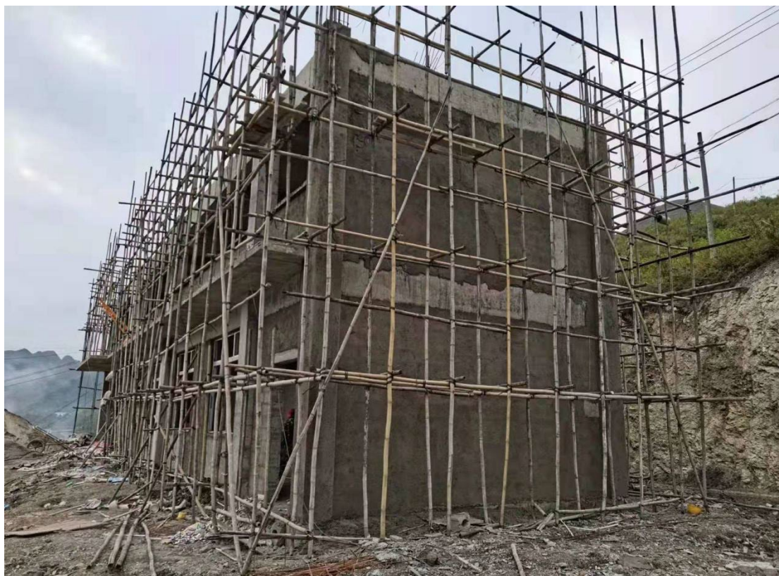
人才公寓主体建设完成图