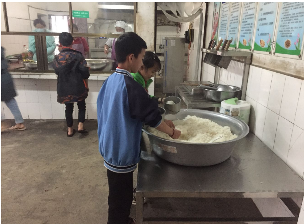
金平县老勐心安里小学学生就餐

米香计划项目于 2020 年春季学期启动实施，从金平县教育体育局到项目实施各学校均安排专人负责米香计划项目，截至目前，弥渡县完成 19 所项目学校共计 145161 公斤大米配送，完成食堂设施设备补充协议签订，正在实施；金平县完成了 36 所项目学校共计 172950 公斤大米的配送。2021 年，本项目为金平县 4170 名学生、弥渡县 3010 名学生提供一整年午餐所需的大米，改善孩子们的午餐营养问题。