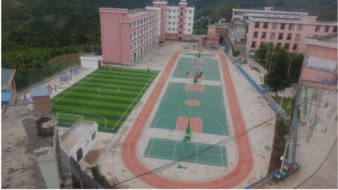
麻栗坡县六河中学