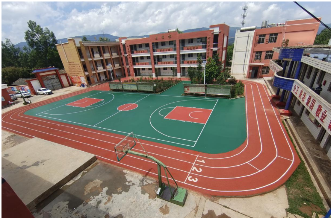
会泽县赵家村小学