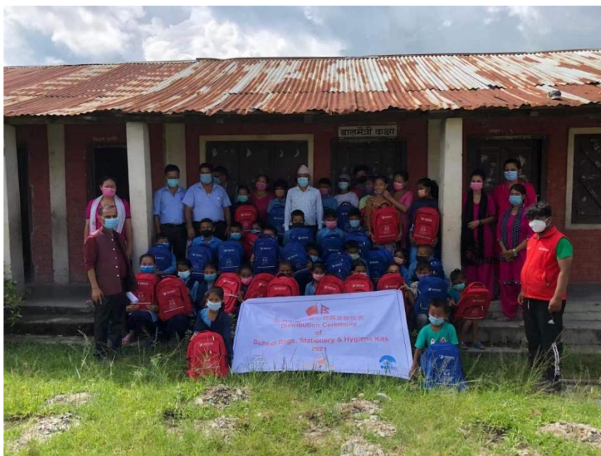
受益学校师生共同迎接包裹到来