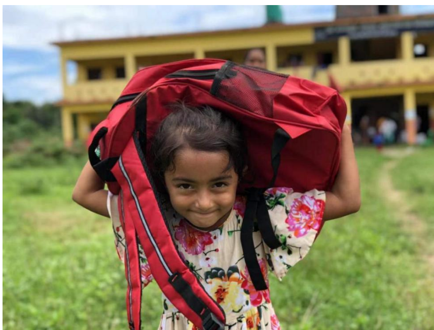
受益学生背起包裹