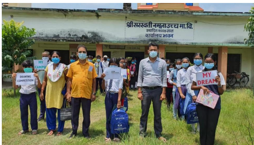
参与绘画比赛的师生