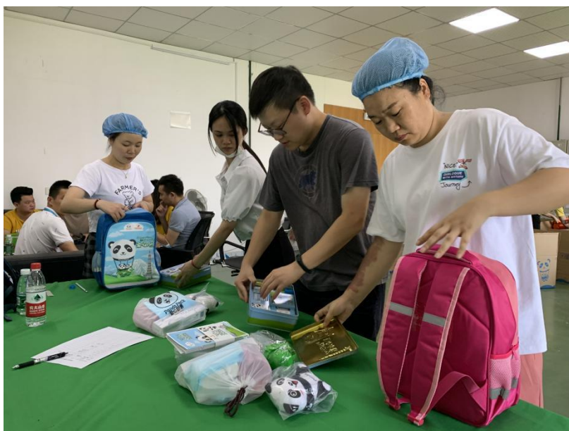
项目人员检验包裹内的物品