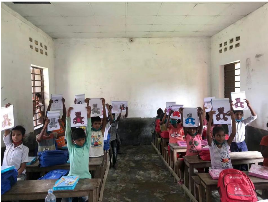
孩子们展示自己的画作