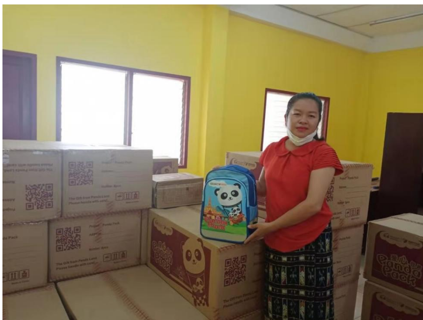
农冰村小学工作人员展示收到的包裹