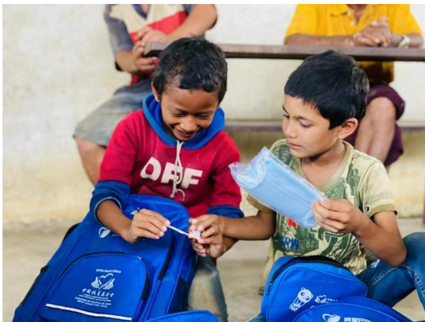
受益学生分享喜悦