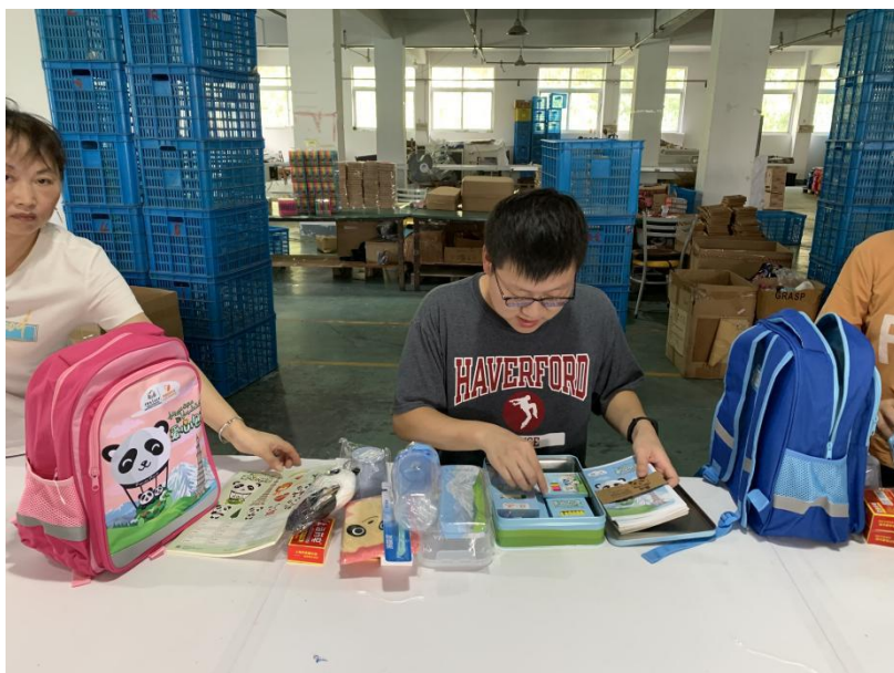
项目人员清点美术用品盒内的用品