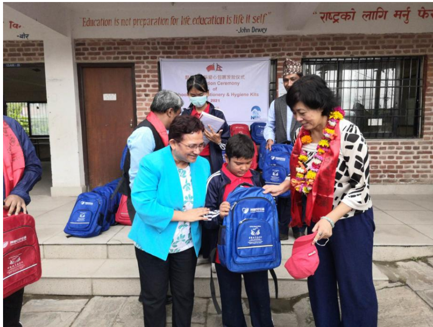
项目工作人员将包裹送到孩子们手中