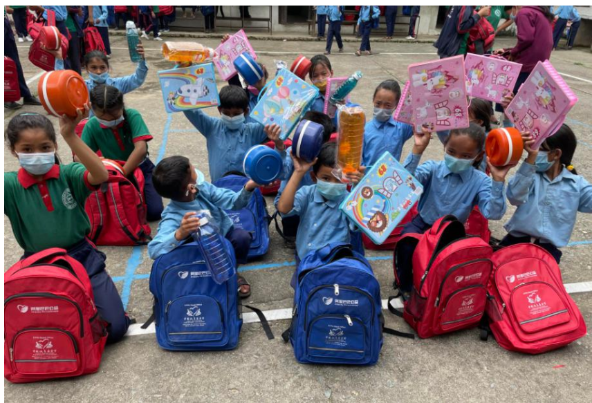
尼泊尔的孩子们收到心爱的包裹