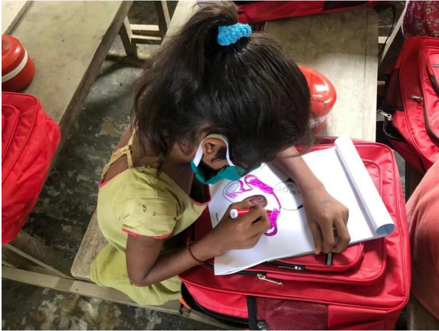
受益学生用画笔画出自己的彩色梦想