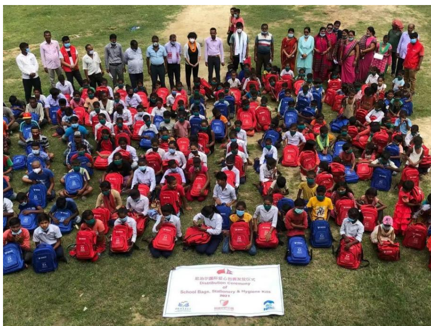
受益学生展示自己收到的包裹