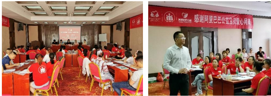
童伴妈妈云贵鄂骨干中级培训在江西井冈山举行

2021年第三季度，项目组共开展4次培训，不断提升童伴妈妈专业能力和服务技巧。省项目办和县项目办也到项目点进行实地督导和考察，指导童伴妈妈工作。