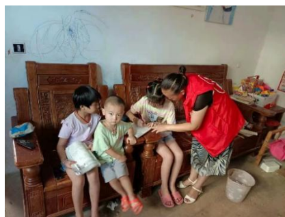
左图：江西万载县仙源村童伴妈妈入户走访，了解孩子学习情况 右图：江西乐安县尧门村童伴妈妈入户走访，宣传防溺水知识