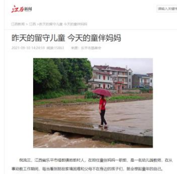
左图：《楚天都市报》对大冶市童伴之家主题活动进行报道 右图：《江西新闻》对乐平市童伴妈妈进行报道