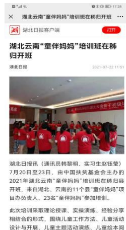
左图：《农民日报》对江西遂川县童伴之家“迎国庆”主题活动进行报道 中图：《中国社会报》对湖北崇阳县童伴妈妈项目进行报道 右图：湖北日报对湖北云南童伴妈妈骨干初级培训进行了报道