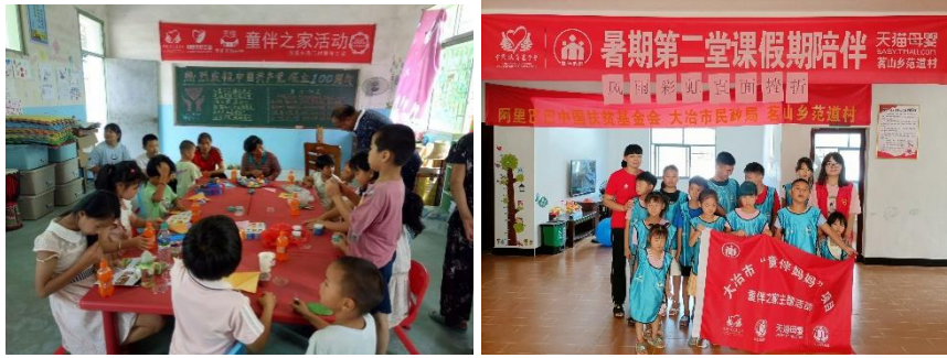
左图：江西乐安县尧门村童伴之家开展“庆祝中国共产党成立100周年”主题活动 右图：湖北大冶市范道村童伴之家开展“风雨彩虹，直面挫折”主题活动