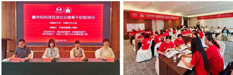
童伴妈妈湖北云南骨干初级培训在湖北秭归举行