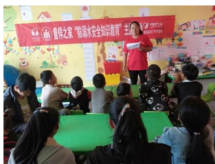
左图：贵州绥阳县高坊子村童伴之家举办“防溺水安全知识教育”主题活动 右图：云南会泽县尹武村童伴之家举办“防溺水教育”主题活动