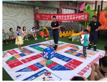
童伴妈妈项目江西 10 县安全培训