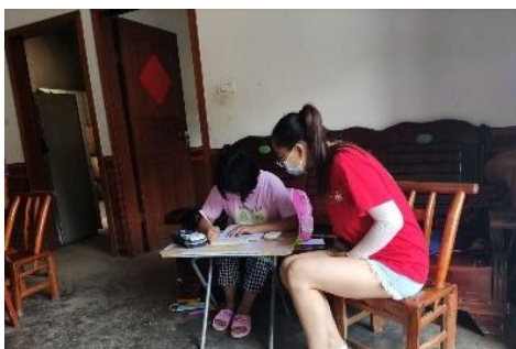
左图：贵州赤水市平滩村童伴妈妈入户走访，了解孩子生活情况 右图：湖北五峰县富裕冲村童伴妈妈入户走访，为孩子辅导功课