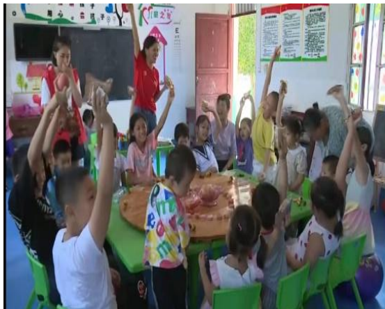
左图：学习强国对巴东童伴妈妈项目进行报道 右图：学习强国报道万安县童伴之家“中秋节”主题活动