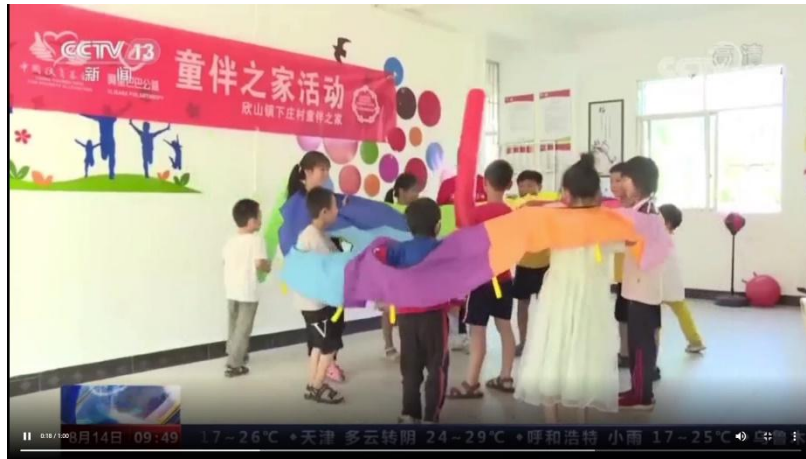
央视《新闻直播间》对安远县童伴之家进行报道

2021 年 7 月-9 月，央视、新华社、农民日报、中国社会报、贵州日报、湖北日报、江西新闻、江西晨报、学习强国等媒体对童伴妈妈项目、人物故事及项目区主题活动进行了报道。