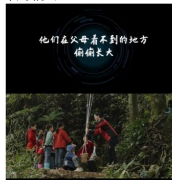
左图：阿里巴巴公益对童伴妈妈项目进行报道 右图：《今日同程》对乡村儿童发展论坛进行预热宣传