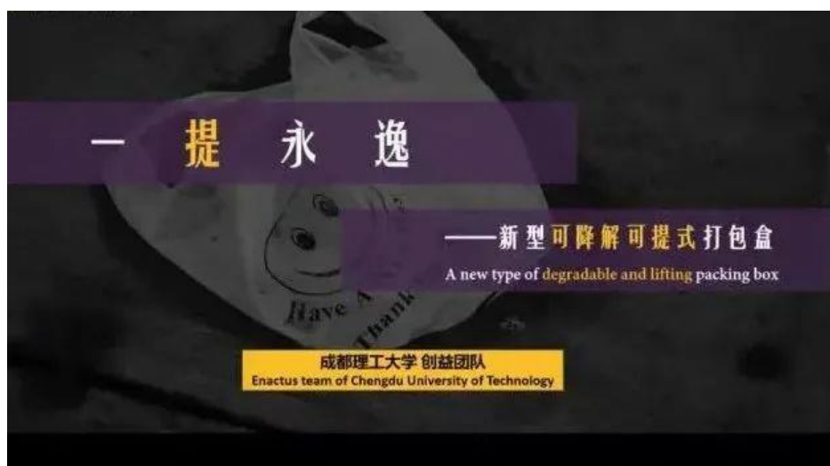
(图：区域活动赛团队项目展示中)