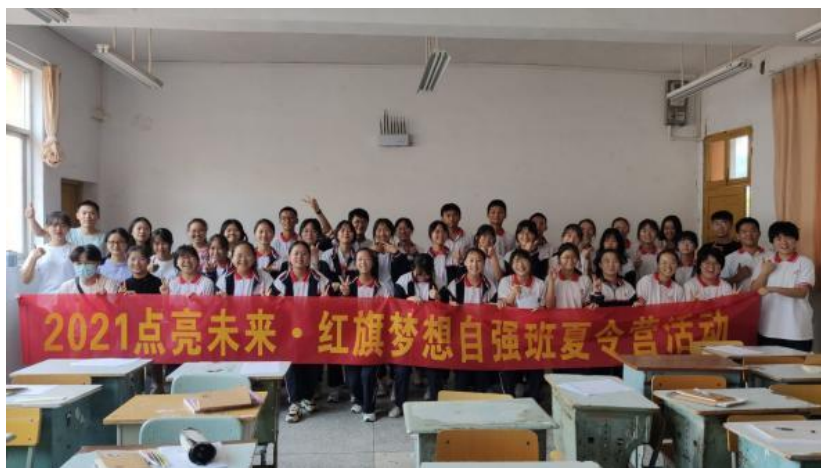
(中南大学活动反馈)