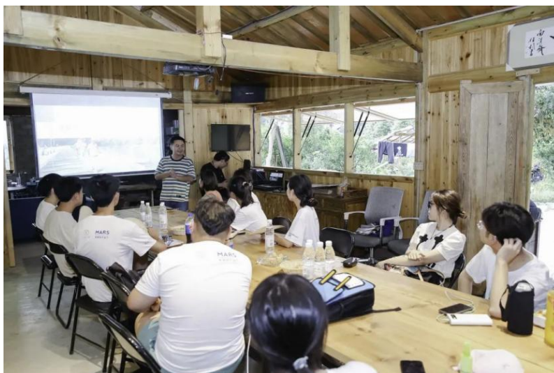
（图：环保小分队参与工作坊环节）