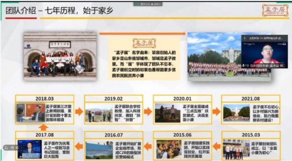
（图：区域活动赛团队项目展示中）

入围全国赛的项目都提出了极具现实意义的问题，以创新性思维提出解决思路。如北京科技大学的孟子局三点五维可持续公益推广项目，实现创业+实践+扶贫相结合，在全国签约建立 30 余个长期对接的社会实践基地；四川大学的“性心乡息”乡村儿童性教育活动项目关注儿童性教育发展，致力于保护乡村儿童；上海交通大学的解忧杂货铺自闭症患儿融合教育项目，提出对自闭症儿童进行多样化的教育培训方式。所有入围队伍将继续完善项目并开展实践活动。