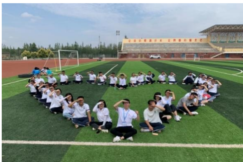
(绵阳师范学院与项目高中合影)