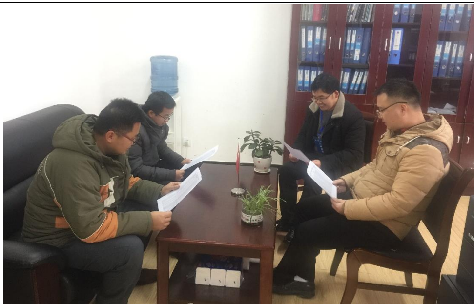
雷山县民族中学评审照片