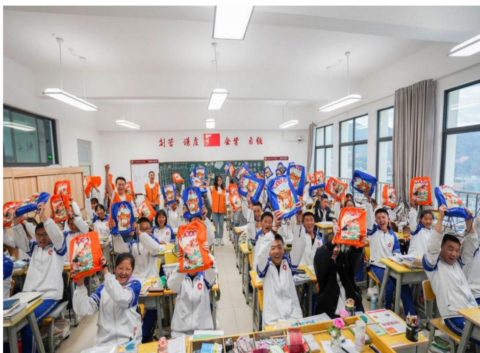
陽光保險集團為學生提供高考加油包