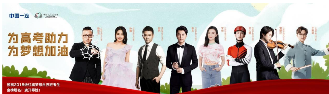
中国一汽汇聚名人助力高考

6月7日-9日，高考期间，项目组联合阳光保险集团、致同会计师事务所、中国石油、中国一汽红旗品牌通过邀请明星线上支持、提供高考文具包、组织高考加油站等活动为参加高考的自强班学生加油。