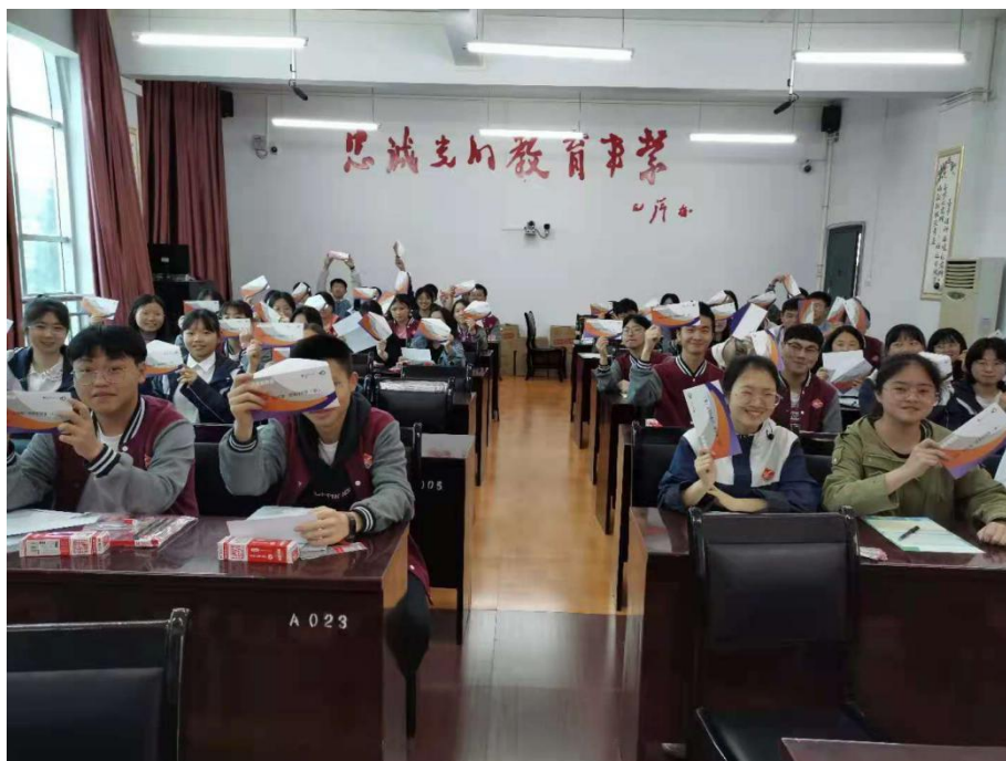
致同會計師事務所為學生提供高考文具包