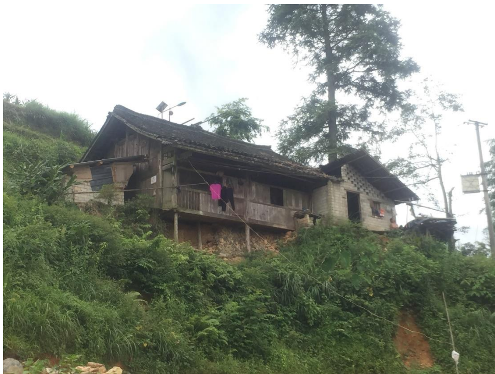
贵州省雷山县民族中学家访照片

第二季度，项目为甘肃、青海、四川、贵州 5 所学校 394 名家庭经济困难学生发放助学金共计 496,720 元。