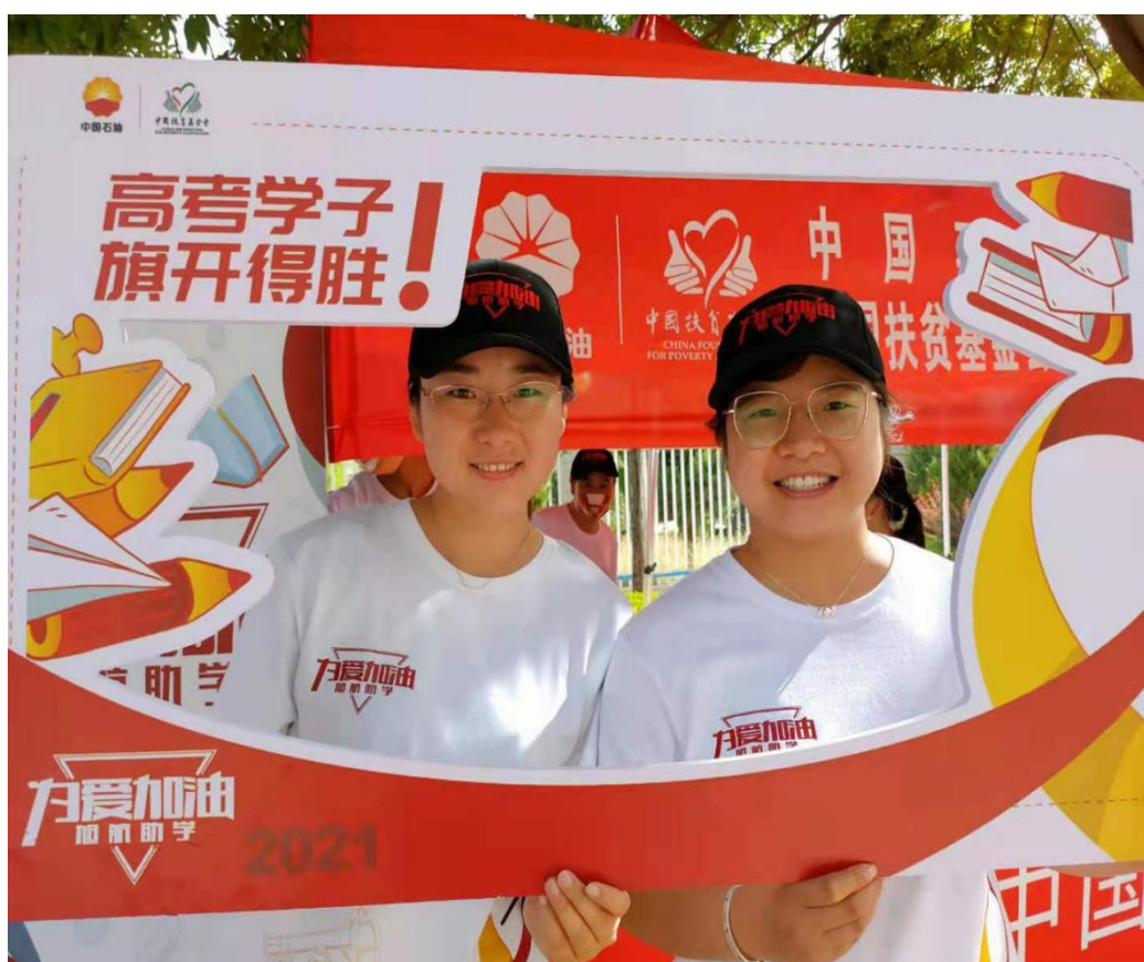
旭航高考服务站中石油员工志愿者