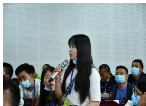
社会情感课程交流现场优秀教练员发言