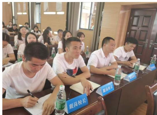
到长沙市岳麓区第二小学跟岗学习