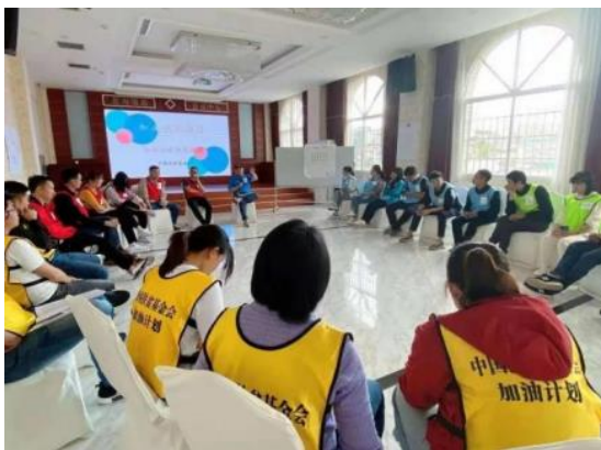
加油社会情感课加强版培训现场

2021年5月15日-17日,加油未来项目开展镇雄加油社会情感课加强培训,18个乡镇47所学校,141名加油未来教练员参加培训。