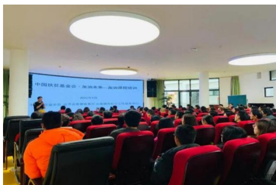
加油社会情感课培训现场照片