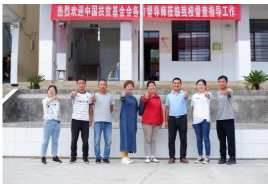
督导师与那克小学教练员合影