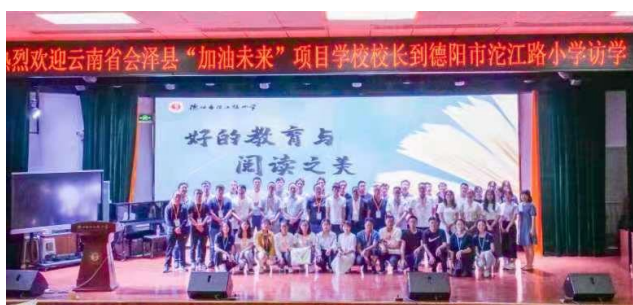
阅读访学活动合影