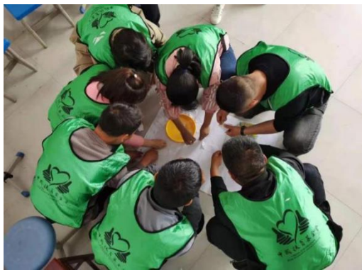
加油教练员破冰活动

2021年5月21-23日，由赫章县中国扶贫基金会、赫章县教育科技局、都江堰上善机构联合举办的加油社会情感强化班培训在赫章县第三小学顺利举行。来自30所学校的102位老师参与了此次培训。