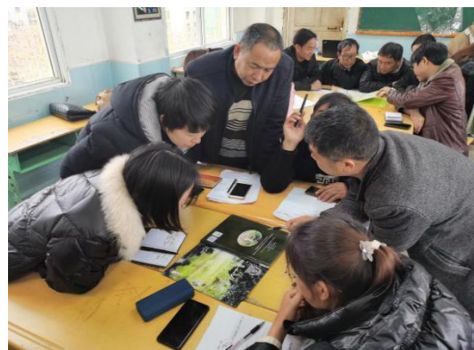
培训中任课教师们积极讨论

2021年5月24日-26日，47所项目学校加油教练员代表赴绵阳市参加加油未来项目加油社会情感课程参访交流活动。