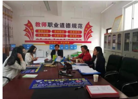
加油社会情感课程走访