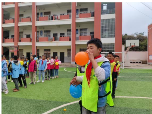
加油社会情感课程督导观摩

目学校进行督导走访。督导师分别对项目学校加油社会情感课程开展情况做了督导反馈，也听取了学校负责人对于加油未来项目开展情况作了详细汇报，学校纷纷表示，加油课堂让孩子们文化课外的闪光点被发现，逐步认识到了另一个不一样的自己；让老师的性格愈发开朗。师生间由文化课堂上的师生变成伙伴；同事间，加油的平台给老师间更多合作交流；同学间，游戏中建立起的友谊成为一颗种子。