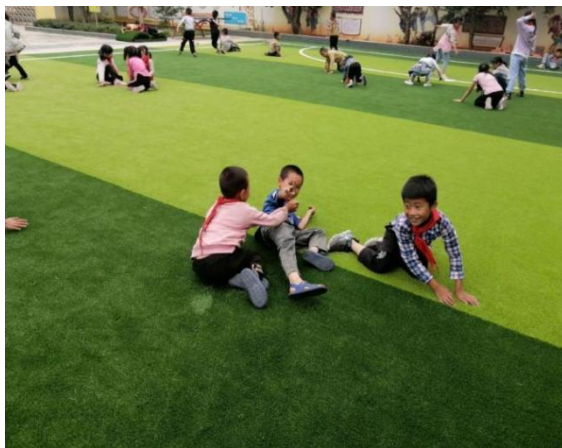
坝汪小学阳光操场

目前，45 所项目学校已按合同要求完成加油空间的建设，坝汪小学同时完成了阳光操场、阅读空间的建设，9 月份均可投入使用。