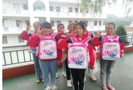
孩子们领到美术包

2020年6月，“加油未来”项目为威宁31所项目学校建设了艺术空间教室，为威宁24所项目学校建设了触碰世界科学教室。