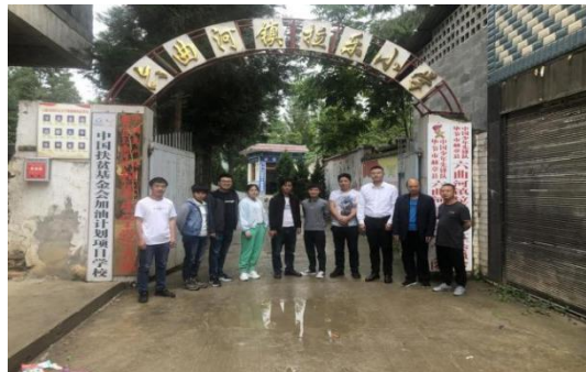
督导与教练员合影