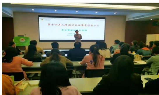
第十六届儿童阅读论坛暨亲读者大会

4 月 15 日-19 日，会泽阅读空间项目学校共 13 名教师到南京参加第十六届儿童阅读论坛暨亲读者大会。