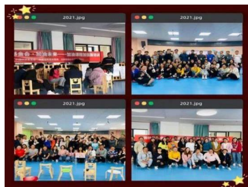
加油社会情感课培训照片集锦

4 月 15 日-19 日，会泽阅读空间项目学校共 13 名教师到南京参加第十六届儿童阅读论坛暨亲读者大会。