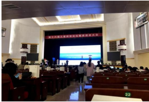
第十六届儿童阅读论坛暨亲读者大会

2021年5月21-23日，由赫章县中国扶贫基金会、赫章县教育科技局、都江堰上善机构联合举办的加油社会情感强化班培训在赫章县第三小学顺利举行。来自30所学校的102位老师参与了此次培训。