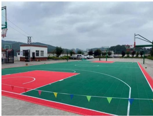
悬浮板篮球场建设