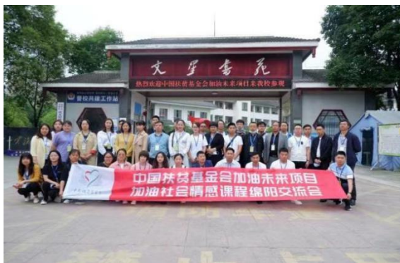
社会情感课程交流会合影

2021年5月24日-26日，由中国扶贫基金会组织，经赫章项目区各项目学校选派30名优秀加油教练员赴四川绵阳与其他项目区优秀教练员进行交流学习，并分组到绵阳当地知名学校进行参访学习。