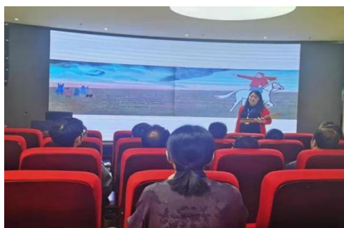
第十六届儿童阅读论坛暨亲读者大会

4 月 24 日-25 日，13 所阅读空间项目学校共 39 名教师在会泽县中铁第三幼儿园开展阅读培训。