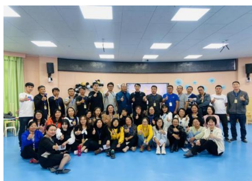
加油阅读培训合影

5 月 21 日，30 所图书角项目学校共 120 名教师在会泽县以礼小学参加担当