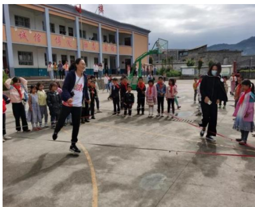
月捐人与孩子们一起做活动