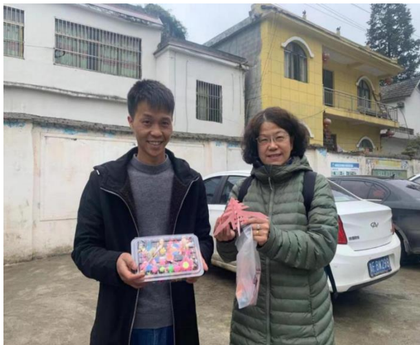
北京垂杨柳中心小学副校长为古达乡观音小学校长赠送学生手工课作品

30 多名校长和中层管理者走访了赫章县 30 所乡村小学及所在的 18 所乡镇中心校，结合当地学校实际情况，围绕校园管理、校长培训、学科融合、学生培养、远程培训等内容，为当地校长提出建议及个性化参考方案。