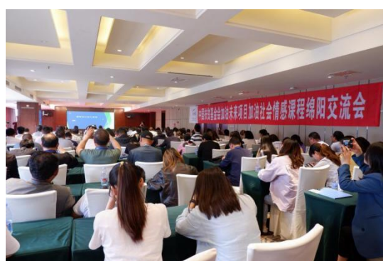
主培训师正在进行理论的补充

2021年5月31日-6月4日由中国扶贫基金会加油社会情感课督导师团队对全县47所项目学校进行了加油社会情感课程督导走访，针对部分任课教师在授课过程中的疑虑把脉开方。