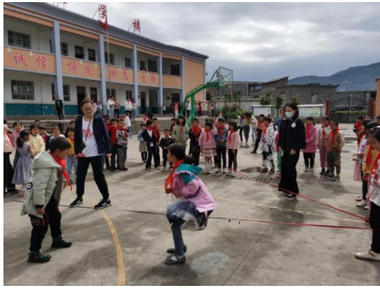
学生参加加油课程活动