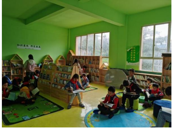
学生在阅读空间学习

2021年4月15日-19日组织在南京人民大会堂参加儿童阅读论坛，23名教师参加。