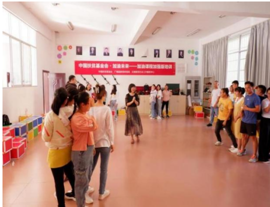
教练员积极参与活动