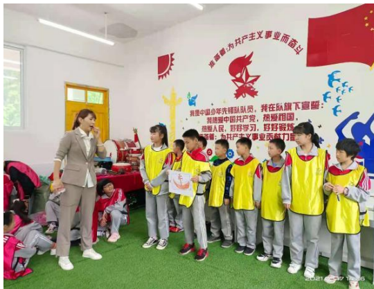
黔江小学加油社会情感课督导