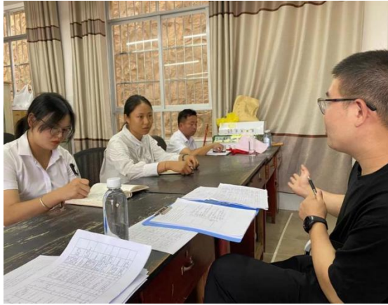
督导师与加油教练员交流