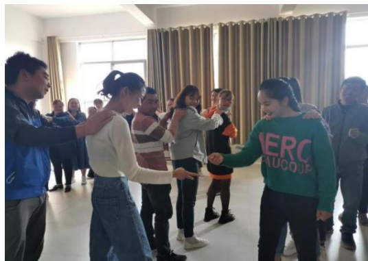
加油教练员实战演练

2021年5月24日-26日，由中国扶贫基金会组织，经赫章项目区各项目学校选派30名优秀加油教练员赴四川绵阳与其他项目区优秀教练员进行交流学习，并分组到绵阳当地知名学校进行参访学习。