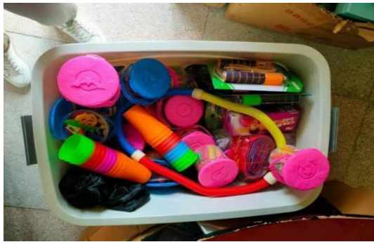
“加油未来”加油教具及加油箱