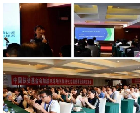
加油社会情感课程交流会活动现场