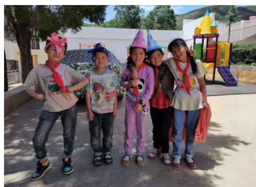
活动中孩子们的笑脸

2021 年 4 月 10 日，45 所项目学校 182 名加油教练员在会泽县中铁第三幼儿园参加为期三天的加油社会情感课程培训，其中基础版培训 30 人，加强版培训