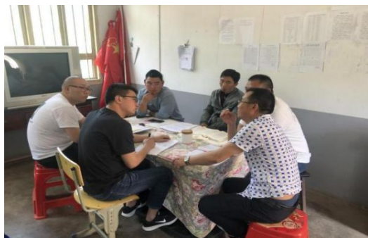
督导与教练员进行交流

2021年5月31日-6月4日，由中国扶贫基金会组织的8名督导师分赴到30所项目学校进行为期一周的加油社会情感课程督导。