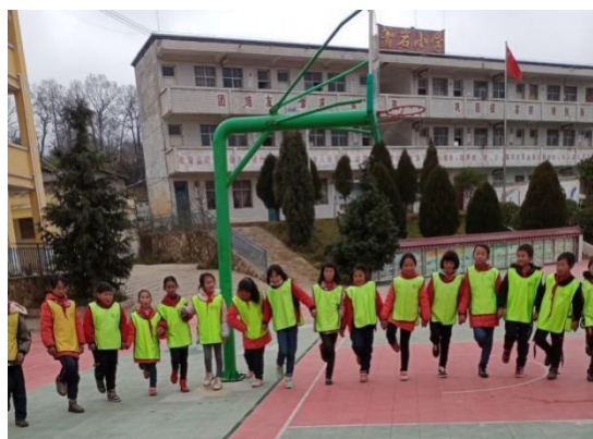
学生参加加油课程活动

2021 年第二季度，42 所学校均按要求每周 1-2 节正常开展加油社会情感课。