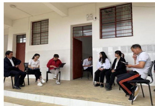
督导师与加油教练员交流

目前，45 所项目学校已按合同要求完成加油空间的建设，坝汪小学同时完成了阳光操场、阅读空间的建设，9 月份均可投入使用。