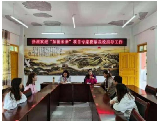
加油社会情感课督导反馈