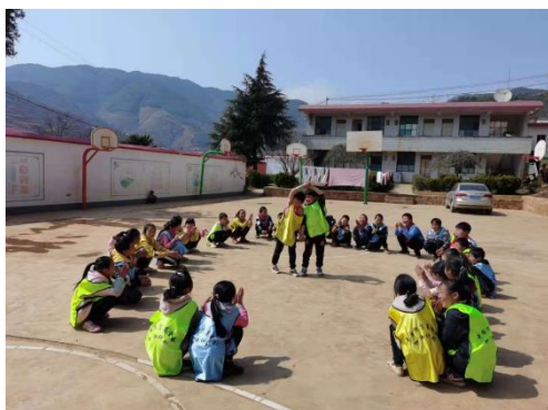
孩子们参加加油社会课程

2021 年第二季度，45 所学校均按要求每周 1-2 节正常开展加油社会情感课程。