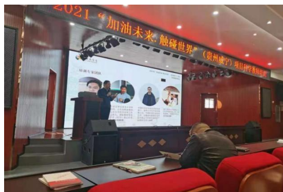
“加油未来”项目科学培训会