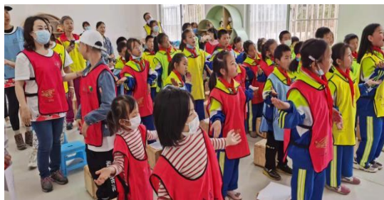
月捐人和孩子们一起上加油社会情感课