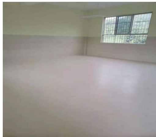
坝汪小学阅读空间建设