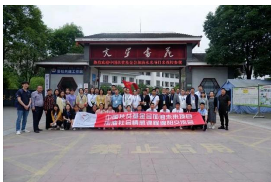
加油社会情感课程参访交流活动

2021年5月24日-26日，47所项目学校加油教练员代表赴绵阳市参加加油未来项目加油社会情感课程参访交流活动。