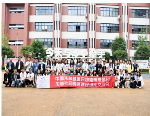
加油社会情感课程交流会合影

5月24日-26日，会泽县45所“加油未来”项目学校45名优秀教练员到四川省绵阳市参加中国扶贫基金会加油未来项目加油社会情感课程交流会。