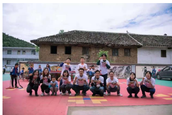
月捐人体验爱心厨房午餐