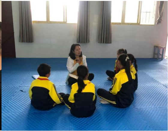
督导师与学生交流