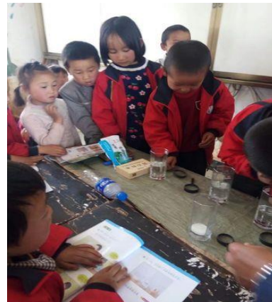
学生在科学教室进行科学实验