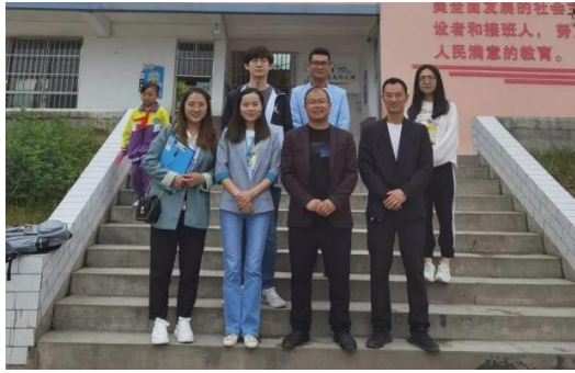
加油社会情感课程督导合影