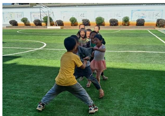
孩子们在足球场上活动