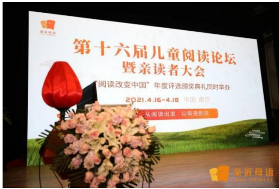
第十六届儿童阅读论坛暨亲读者大会

2021年4月15日-19日组织在南京人民大会堂参加儿童阅读论坛，23名教师参加。