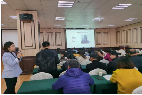
教练员参加音乐培训