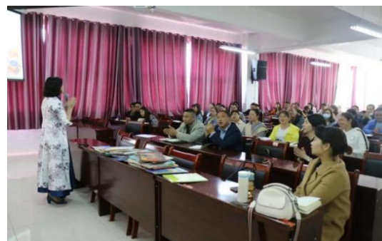
培训现场气氛热烈