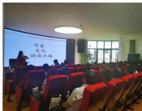
担当者晨诵研习培训活动现场

5月24日-26日，会泽县45所“加油未来”项目学校45名优秀教练员到四川省绵阳市参加中国扶贫基金会加油未来项目加油社会情感课程交流会。