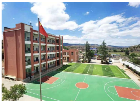
加油塑胶篮球场和足球场建设