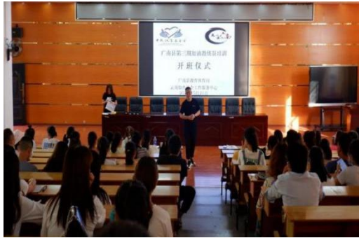
加油教练员培训开班仪式

2021年5月21日-23日，中国扶贫基金会“加油未来”加油社会情感课程培训在广南县第五中学举行，来自45所项目学校的107名教师参训。此次培训分为3个班，进行加强版培训。