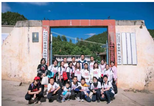
月捐人们在学校门口合影