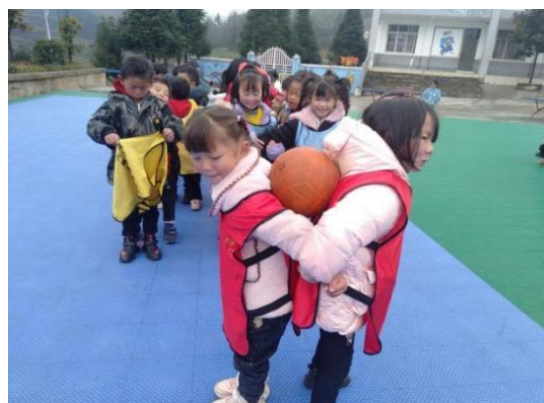
学生参加加油课程活动