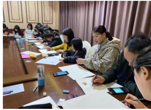
教练员参加美术培训

2020年5月，“加油未来”项目为威宁县共31所学校学生发放了图书包，为威宁县共15所学校学生发放了音乐包和美术包。