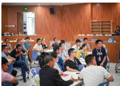
加油阅读培训现场照片

4 月 24 日-25 日，13 所阅读空间项目学校共 39 名教师在会泽县中铁第三幼儿园开展阅读培训。