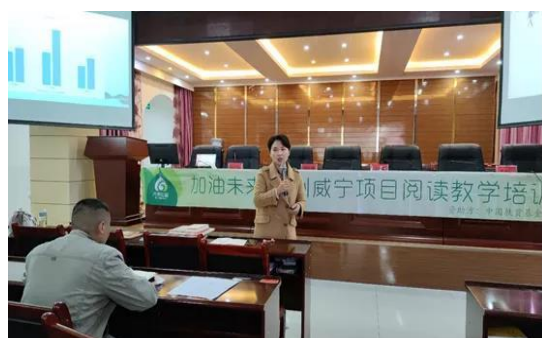
培训讲师讲授阅读课开展相关内容