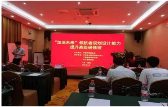
领航者规划设计能力提升