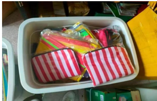
“加油未来”加油教具及加油箱