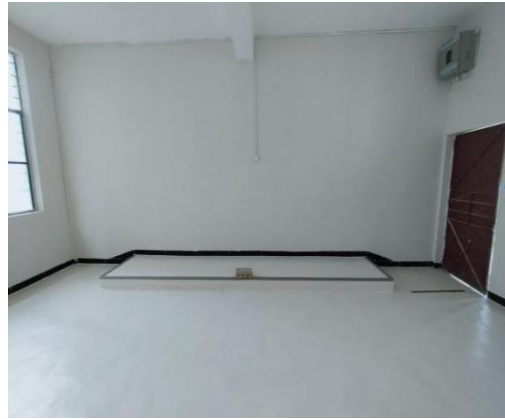
那耐小学加油空间建设