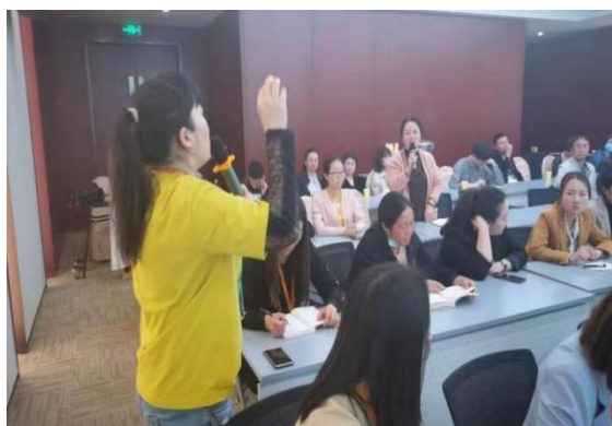
担当者晨诵活动教师发言