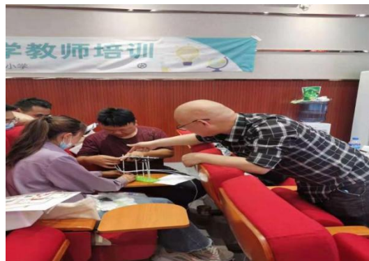
培训会现场互动交流