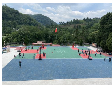
孩子们在悬浮板篮球场上活动