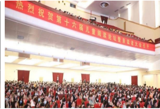
第十六届儿童阅读论坛暨亲读者大会

2021年5月15日-17日,加油未来项目开展镇雄加油社会情感课加强培训,18个乡镇47所学校,141名加油未来教练员参加培训。