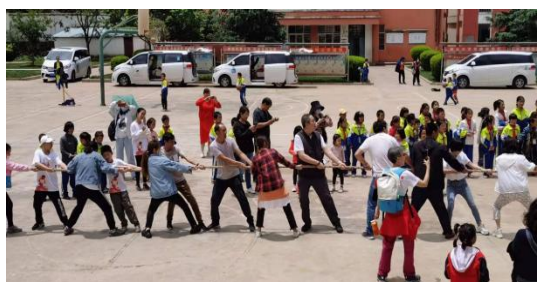
月捐人和孩子们进行拔河活动

5月26-29日，来自全国各地的60余人月捐人到会泽县三岔小学、新云小学、冬瓜林小学、马厂小学4所学校进行探访，月捐人到4所学校参观了学校校园文化、与孩子们一同上加油未情感课程，参与孩子们的大课间活动，到孩子家进行探访，活动结束后，月捐人纷纷表示：此次探访活动非常有意义，实地感受了乡村孩子们的学习生活，以后将会带动更多人加入月捐，一如既往支持乡村教育。