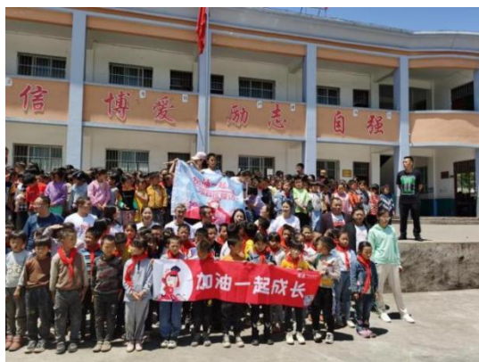
孩子们领取“加油”美术包

2021年5月27日-29日，来自全国各地的月捐人分组先后深入坪上镇小河小学、尖山乡山顶小学、芒部镇元孔小学、坪上镇老场小学实地探访，进班开展交流课程，与乡村孩子同做课间操等多种形式与学生近距离接触。