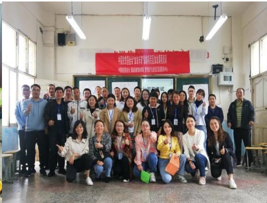
加油社会情感课加强版培训合影