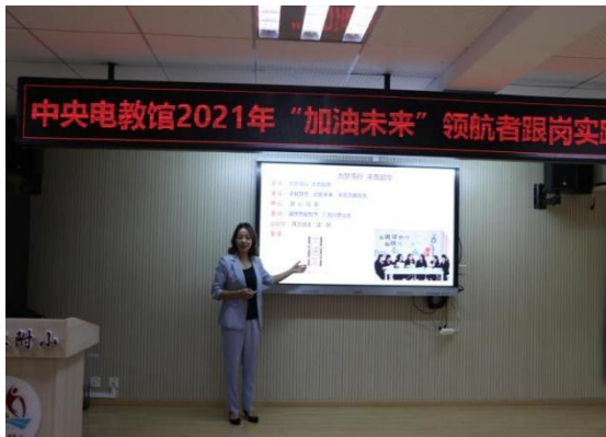
到昆明理工附属小学跟岗学习

2021年6月20日-26日，印江县12名校长分别到昆明理工附属小学、长沙市岳麓区第二小学、绵阳市高新区火炬实验小学进行“加油未来”项目跟岗学习。