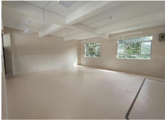
桥头小学加油空间建设