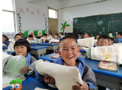
孩子们领到音乐包