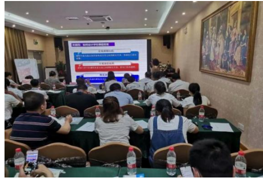
领航者规划设计能力提升

2021年6月20日-26日，印江县12名校长分别到昆明理工附属小学、长沙市岳麓区第二小学、绵阳市高新区火炬实验小学进行“加油未来”项目跟岗学习。