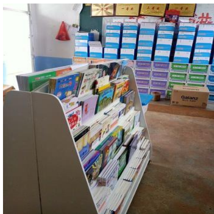
触碰世界科学教室

2020年6月，“加油未来”项目为威宁31所项目学校建设了艺术空间教室，为威宁24所项目学校建设了触碰世界科学教室。