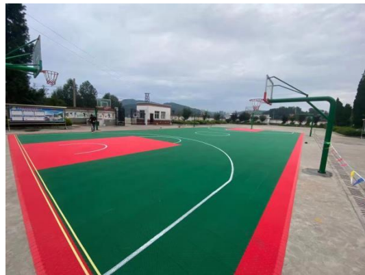
悬浮板篮球场已竣工