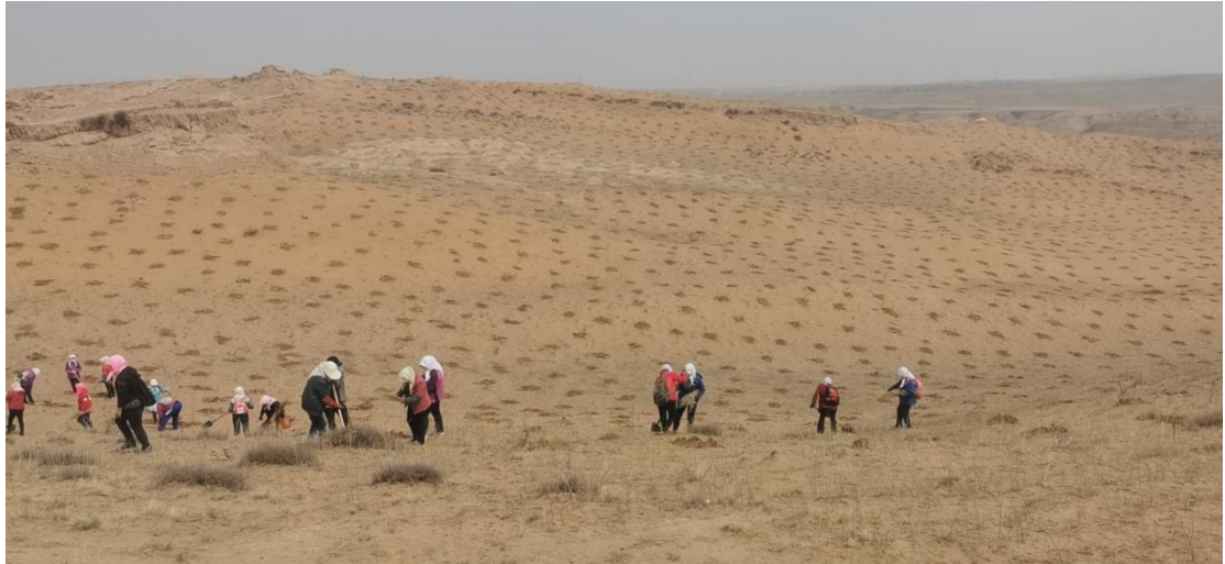
目古浪二期柠条项目造林现场