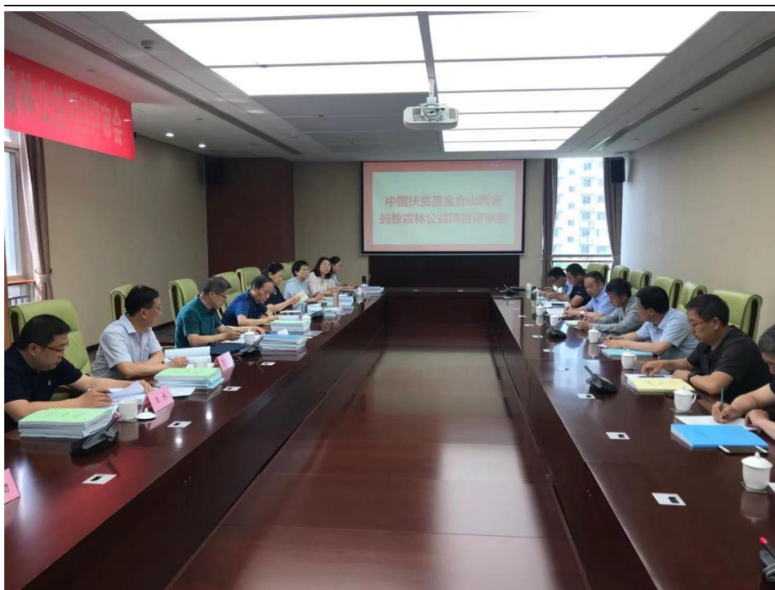
2021 年山西省秋种项目评审培训会现场