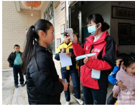
右图：江西会昌县小密村开展“战疫演练，筑牢防线”主题活动，讲解卫生防护的必要性