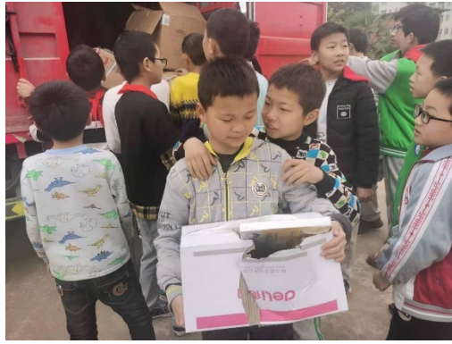
江西第三批新 15 村童伴之家物资配送