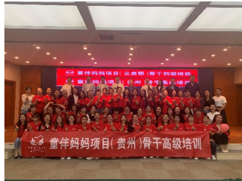
云贵鄂初级骨干培训、贵州高级骨干培训