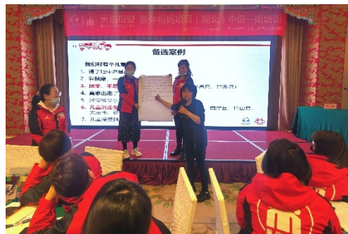
湖北项目区中统一期培训