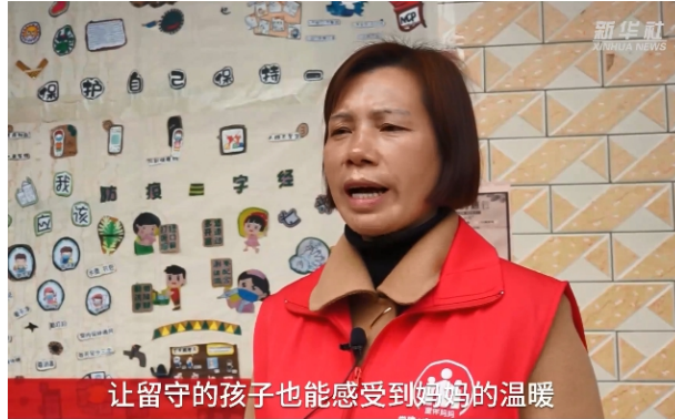
新华社：江西万安县童伴妈妈 “留守不孤因为有童伴妈妈”

2021年2月，因各地响应疫情期间就地过年政策，很多在外打工的父母过年期间未能返乡和孩子团圆相聚，童伴妈妈作为孩子们的大家长，组织主题活动，陪伴孩子们度过了一个愉快的春节。新华社、央视（综合、财经）、学习强国等媒体对江西项目区进行了报道。