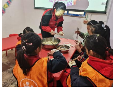
右图：贵州凤冈县龙山村开展“迎春节，包饺子”主题活动，童伴妈妈带领孩子们包饺子