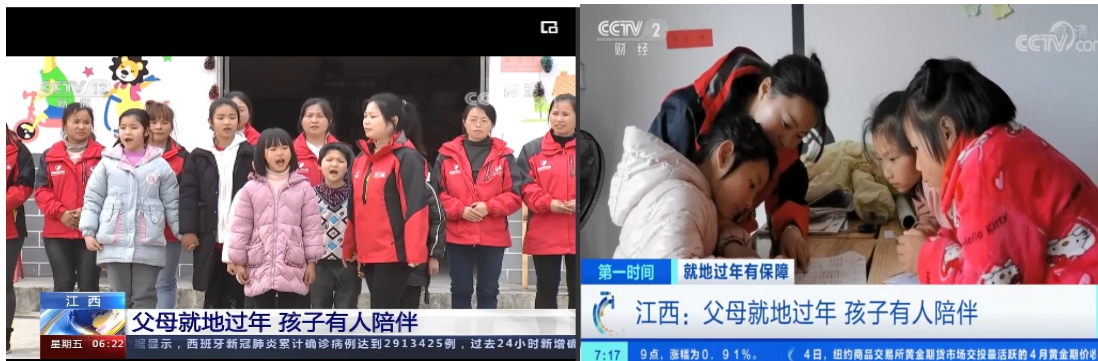
央视《朝闻天下》、《第一时间》报道：江西万载县童伴妈妈“父母就地过年 孩子有人陪伴”

CCTV-13新闻频道 朝闻天下 [朝闻天下]江西 父母就地过年 孩子有人陪伴 来源：央视网 2021年02月05日 06:29