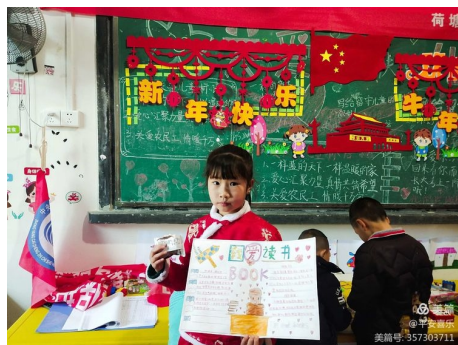
左图：江西乐安县荷塘村童伴之家开放，孩子们发挥创意设计手抄报