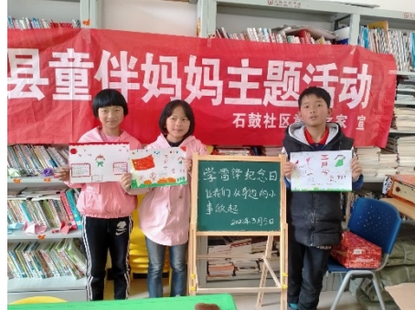
左图：安徽金寨县横畈村童伴之家开放，孩子们在询问知识 右图：云南会泽县石鼓社区童伴之家开展“让我们从身边的小事做起”主题活动