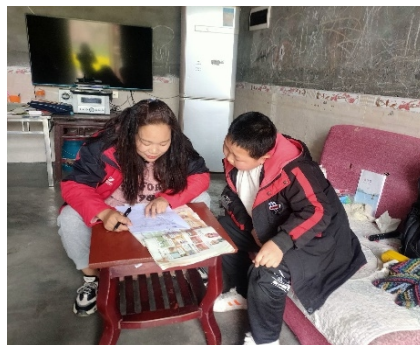
左图：云南会泽县发基村家访，了解儿童心理情况 右图：江西万安县通津村童伴妈妈入户走访，了解孩子学习情况