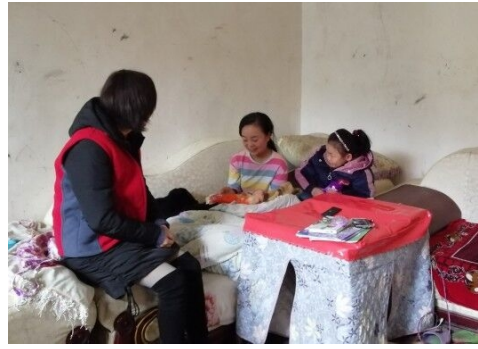
左图：湖北竹溪县小坝子村童伴妈妈入户走访，为孩子送去爱心人士捐赠的衣服