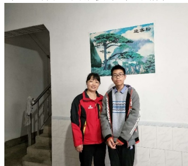
左图：江西石城县沿沙村童伴妈妈入户走访，了解孩子身体情况 右图：湖北竹山县刘家河村童伴妈妈回访，为孩子辅导功课