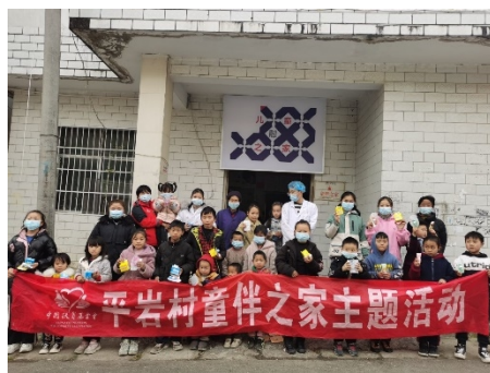
左图：贵州罗甸县平岩村童伴之家开展“防控新冠肺炎疫情”主题活动

2021年初，由于部分地区受疫情影响，童伴之家暂停开放。1月-3月，项目区开童伴之家共组织活动1.64万余次，有11.34万余人次的儿童，1.66万余人次的家长参加童伴之家的日常活动和“庆元旦-腰鼓表演”、“战疫演练，筑牢防线”、“迎新年”等主题活动。孩子们在游戏中学习防疫知识，树立起了牢固的安全意识。1月中下旬，受疫情影响，童伴之家暂停开放。