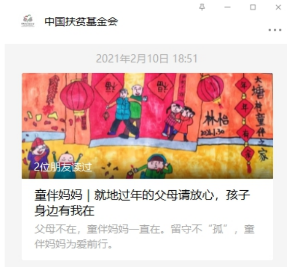
左图：人民政协报：让留守儿童春节不孤独—妈妈不在，“童伴妈妈”一直在 右图：中国扶贫基金会：童伴妈妈 | 就地过年的父母请放心，孩子身边有我在