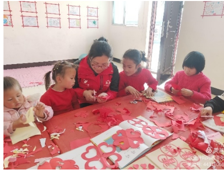
左图：江西莲花县杨枰村开展“庆元旦-腰鼓表演”主题活动，孩子们击打腰鼓展示风采 右图：江西安远县赖塘村童伴之家开展“迎新年”主题活动，孩子认真的学习剪窗花