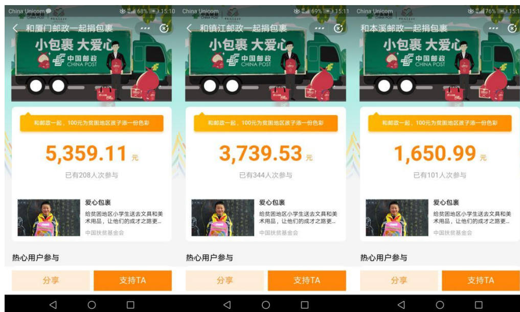
(部分爱心队伍筹款截图)

2020年5月25-6月7日，中国扶贫基金会联合中国邮政共同发起“爱心包裹.圆梦六一”活动，5月29日，活动仪式暨专场培训会在线举行，超3000名中国邮政员工通过腾讯会议与抖音直播的方式参与培训。此次活动通过支付宝公益平台筹集善款20多万元，建立375支益起捐队伍，5809人次参与。