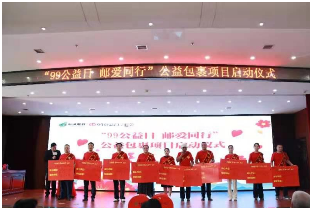
（“99 公益日·邮爱同行”公益包裹项目启动仪式）