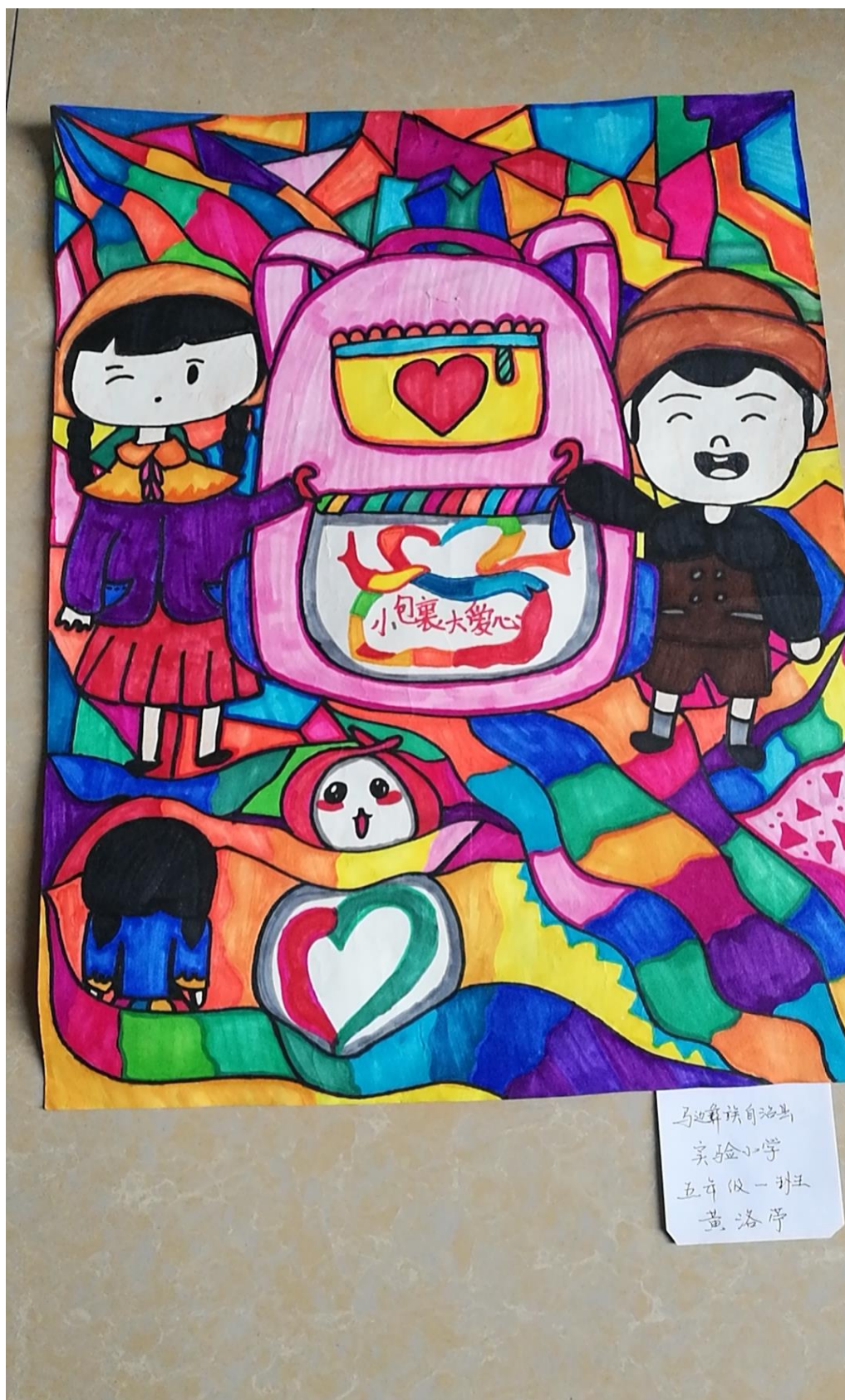
(马边彝族自治县实验小学受益学生美术作品)