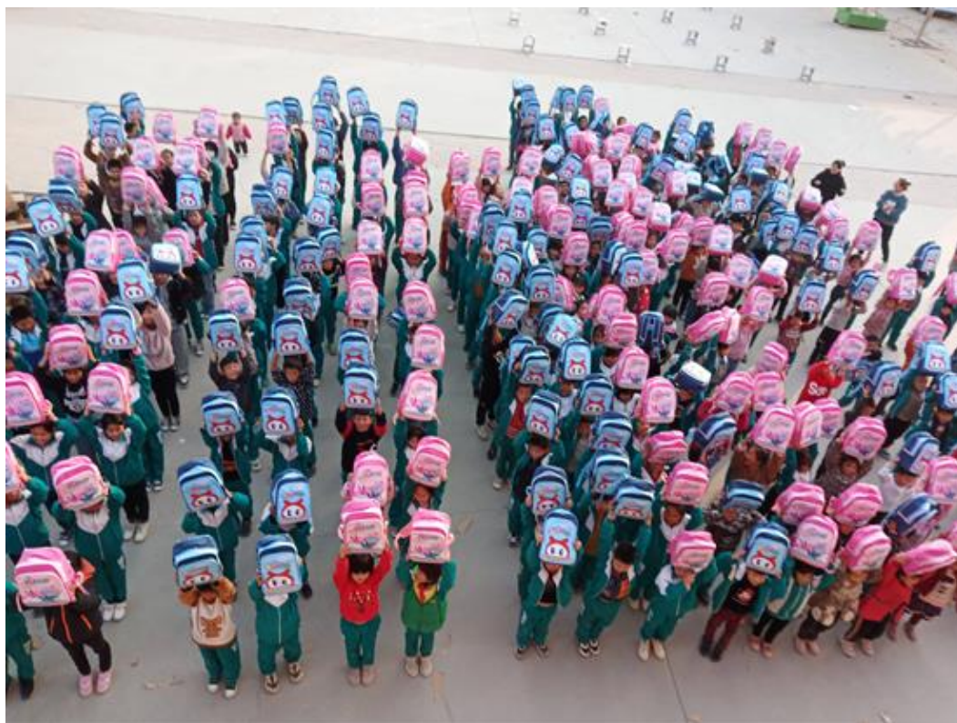
(爱心包裹美术包发放现场图)