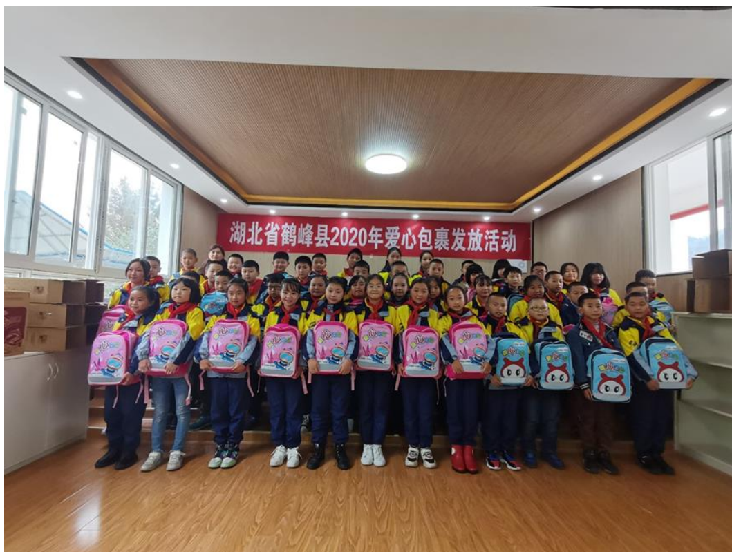
(鹤峰县太平镇贺龙希望小学爱心包裹发放仪式现场)