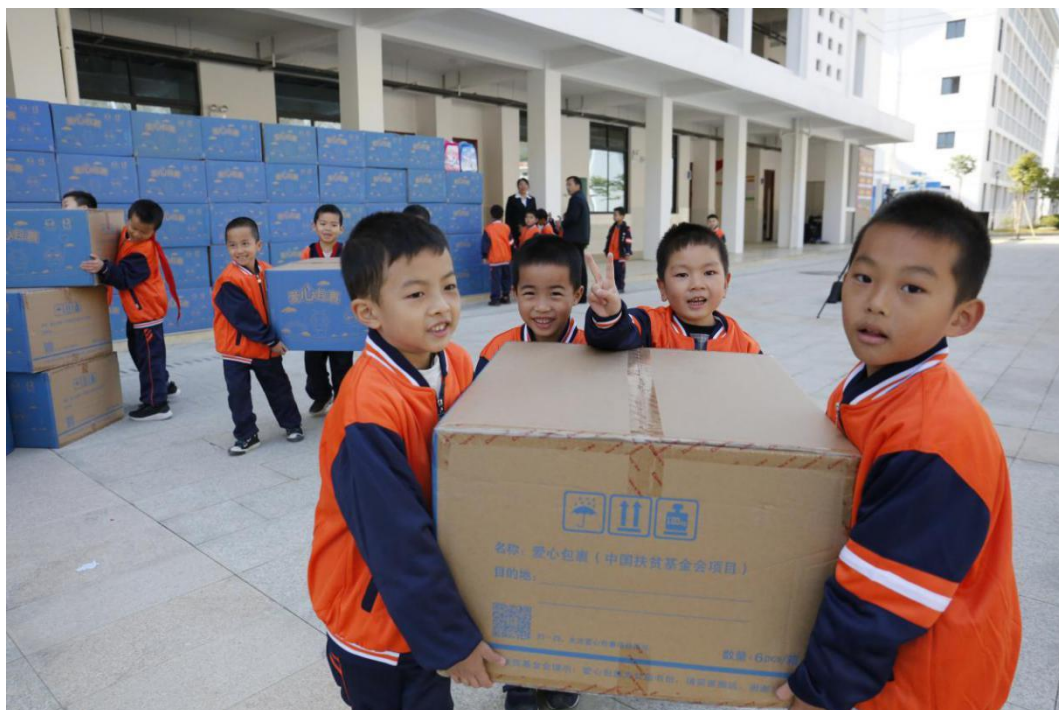
(天等县受益小学生搬运爱心包裹)