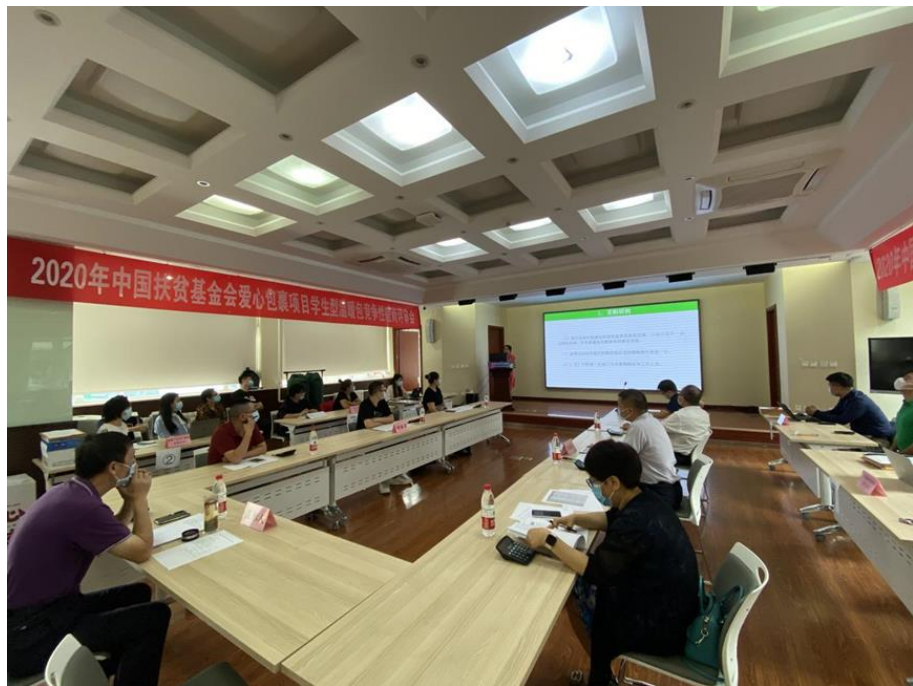
（爱心包裹学生型温暖包竞争性磋商会议现场图）