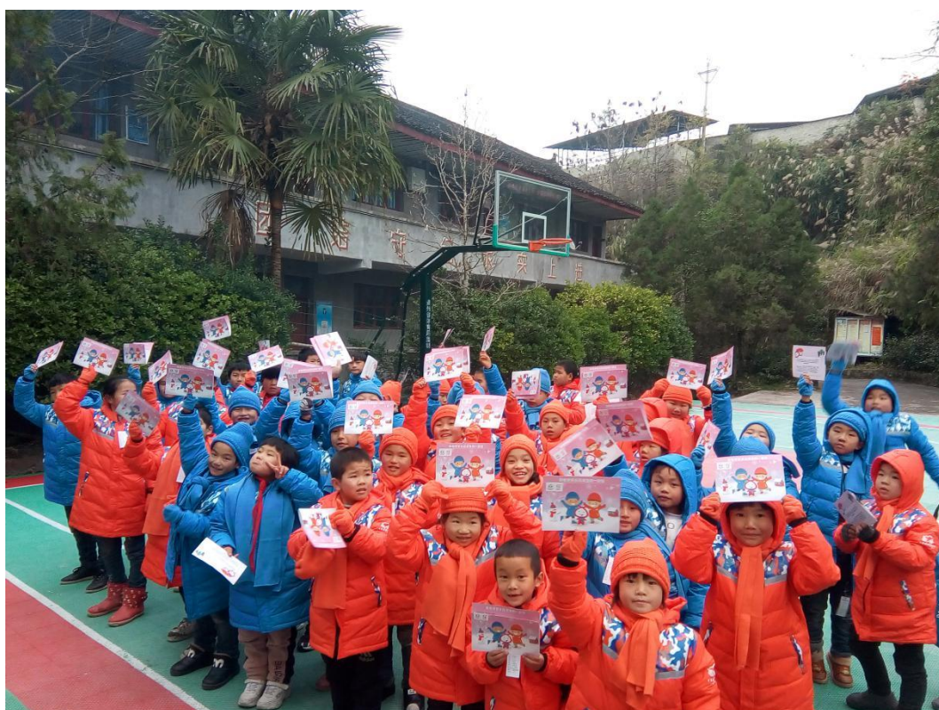
(贵州省雷山县柳鸟完全小学受益学生合照)