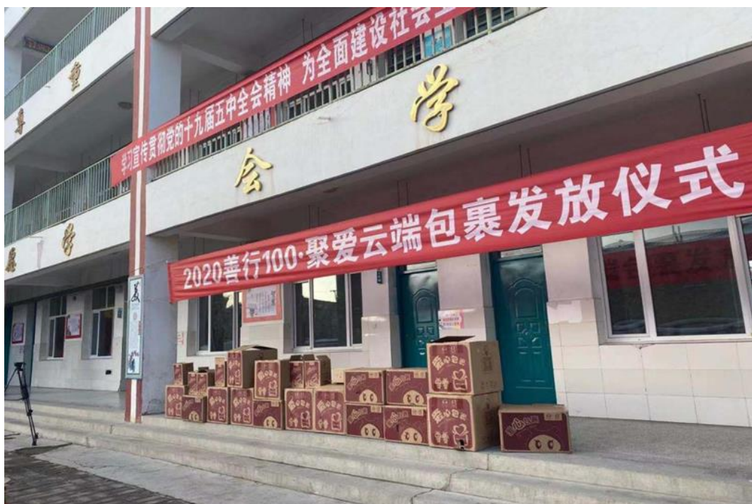
（海原县海城镇中心小学爱心包裹项目发放仪式）