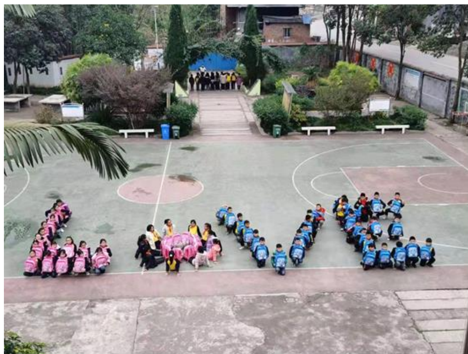
(习水县程寨红旗完全小学领到包裹后的学生们)