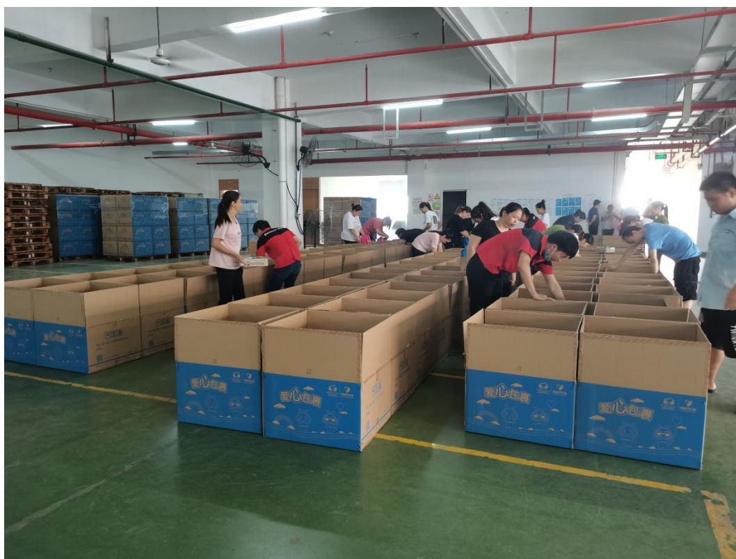
(齐心集团美术包验货现场图)

1月1日至12月31日，中国扶贫基金会爱心包裹项目工作人员前往广东清远真彩集团、深圳齐心集团股份有限公司、浙江宁波贝发集团三家学生型美术包供应商工厂和江苏红豆实业股份有限公司、山东耶莉娅集团有限公司、豪爵（北京）制衣有限公司、江苏绿洲制衣有限公司四家温暖包供应商工厂，以不低于3%的抽检率，进行累计60万个爱心包裹美术包和10万个爱心包裹温暖包的验货工作，为爱心包裹项目执行工作提供支持。