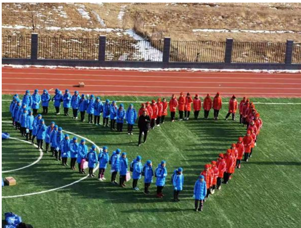
(爱心包裹温暖包发放现场图)