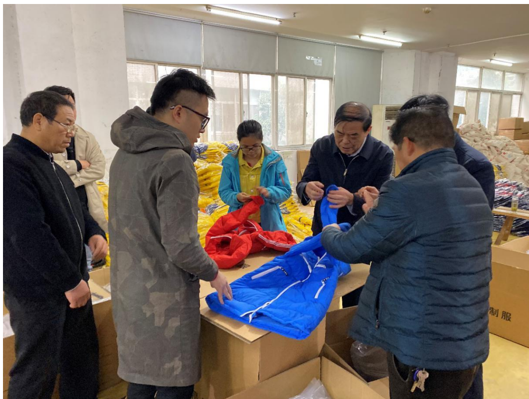
(绿洲制衣有限公司温暖包验货现场图)