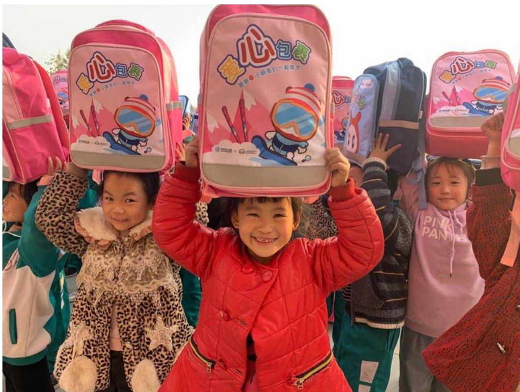
(河南省范县爱心包裹发放集锦图)