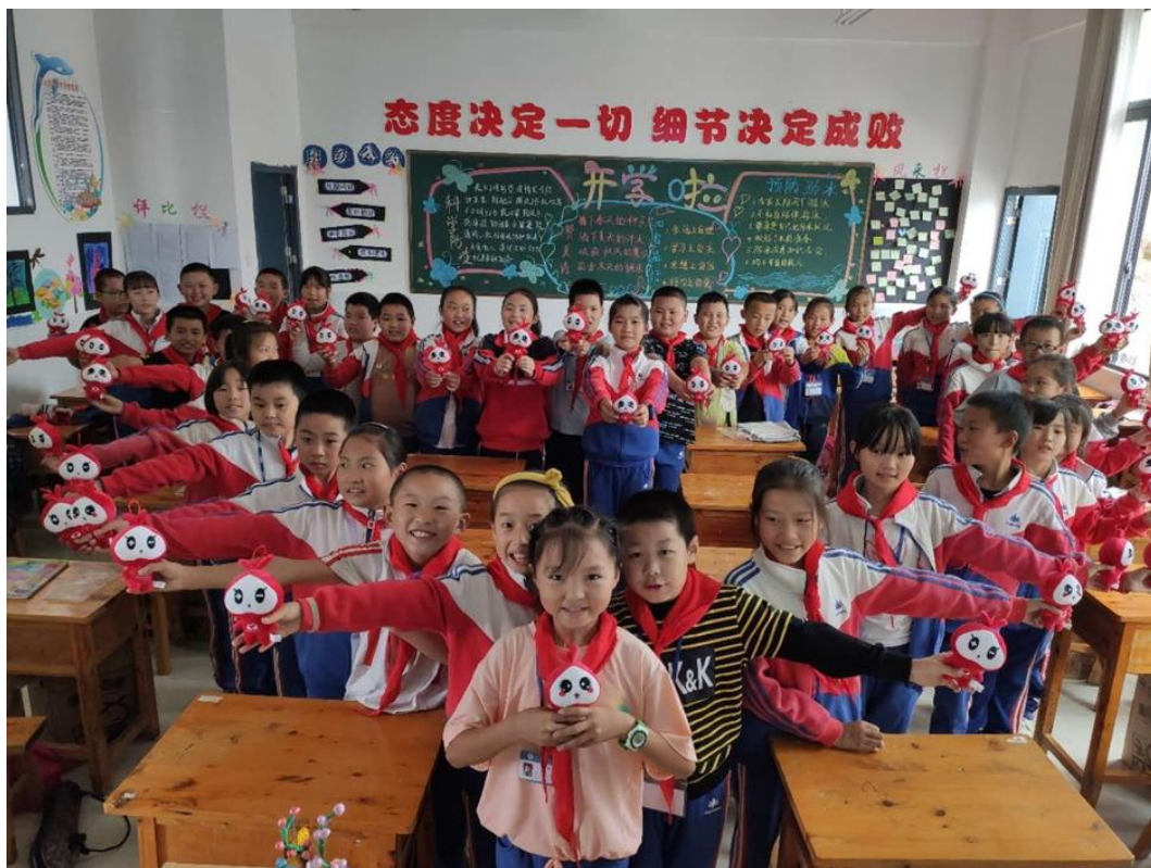
(重庆市巫山县受益学生用包裹吉祥物“抱抱”摆出“爱心”)