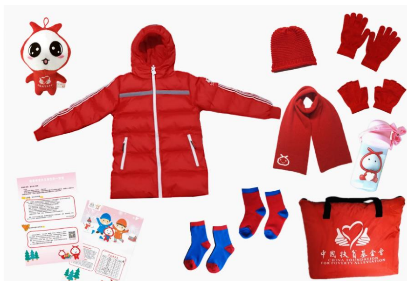
(学生型温暖包样图)

200 元捐购一个学生型温暖包，关爱一名欠发达高寒地区小学生。温暖包以“为欠发达高寒地区小学生送去御寒衣物，帮助学生温暖过冬”为产品定位，包含羽绒服、围巾、手套、袜子、水壶等 11 件单品。