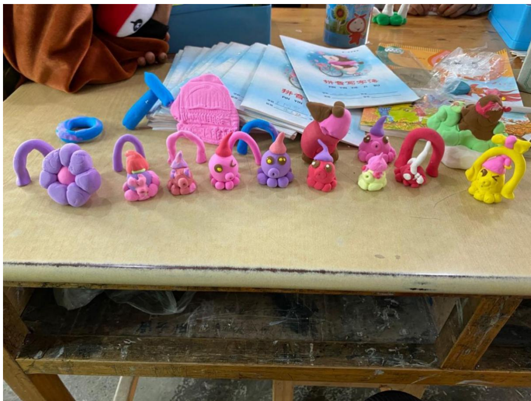
(受益学生超轻粘土手工作品展示)