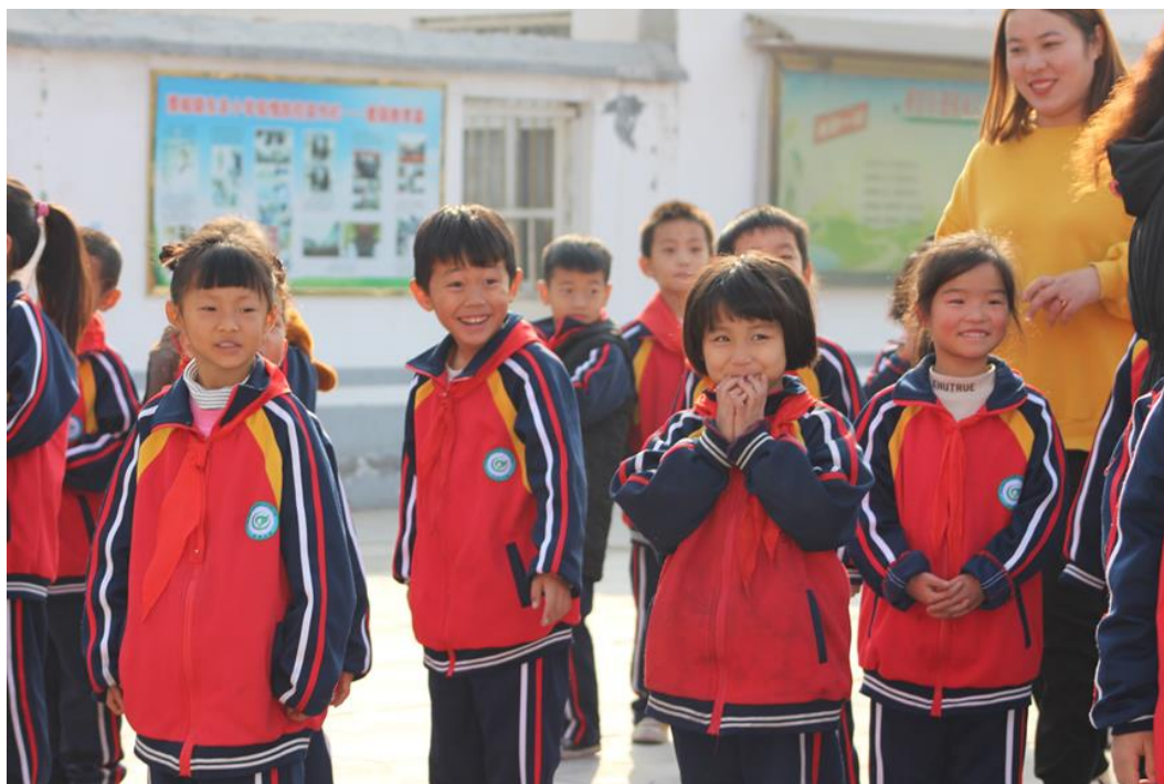
(河南省范县等待着领取爱心包裹的受益小学生)