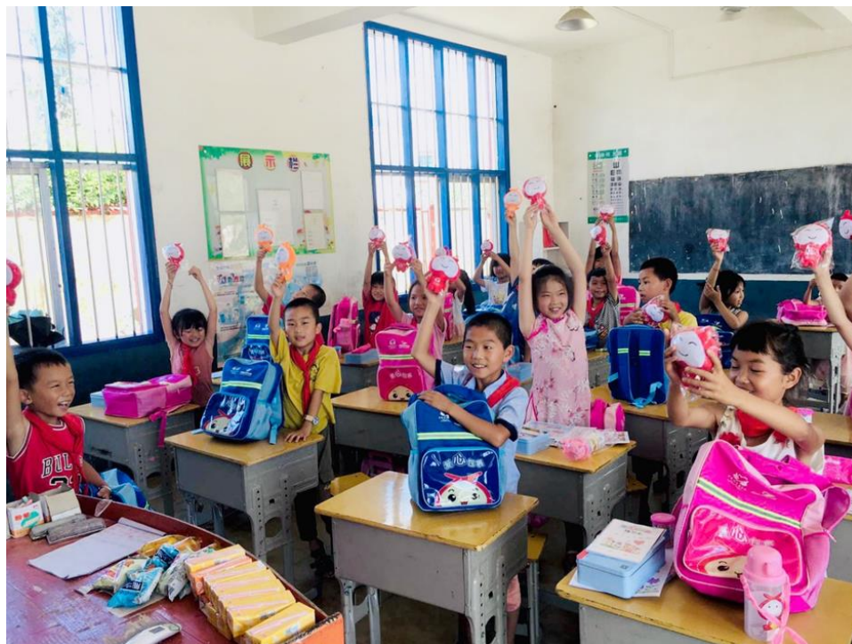
(莲花县厦布小学领到包裹后的学生们)