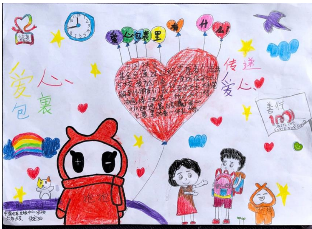
(受益学生作品绘画展示)