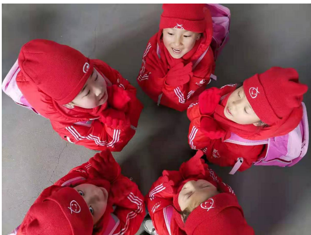
(海原县温暖包受益学生合照)