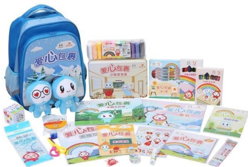
(学生型美术包样图)