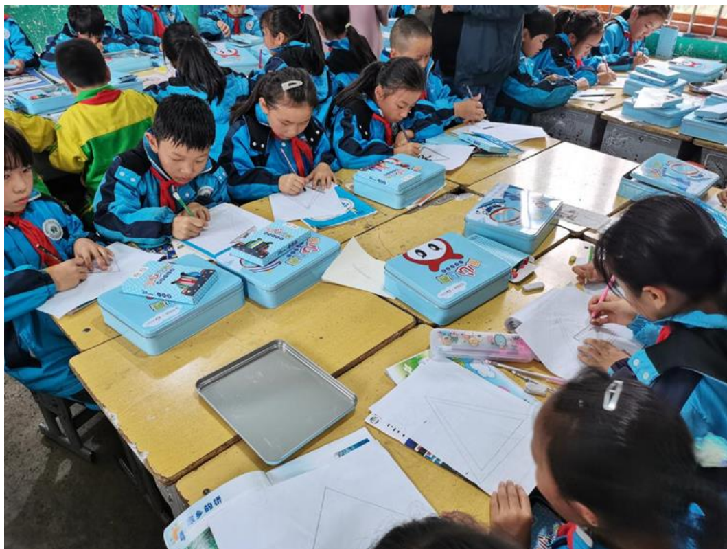
(贵州省大方县受益学生使用小画家宝盒里的绘画用具画画)