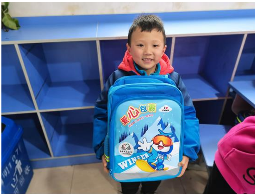
(贵州省习水县爱心包裹发放集锦)