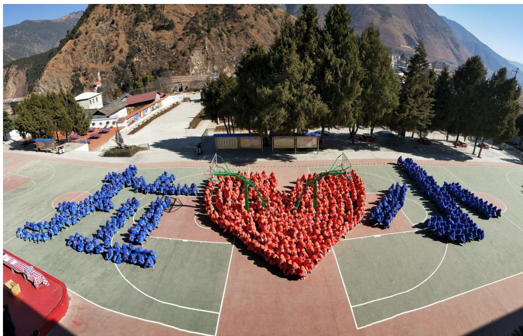
(四川省喜德县拉小温暖包受益学生合照)