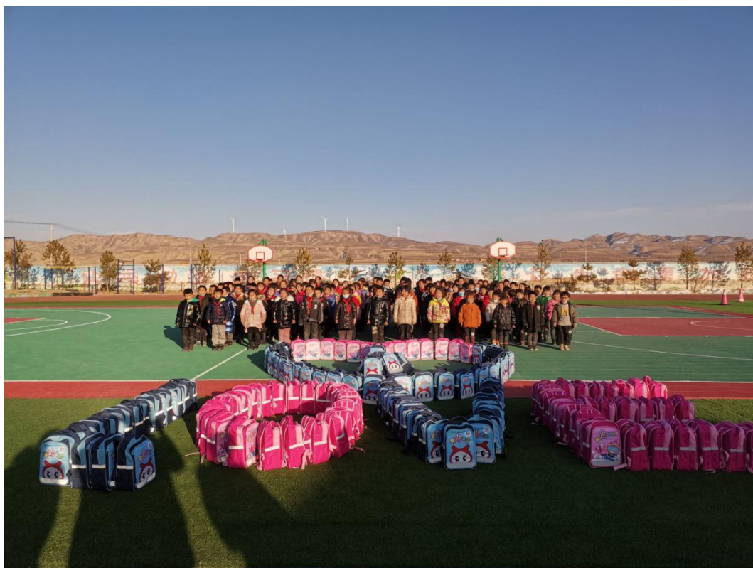
（海原县受益学生用收到的爱心包裹摆出了“LOVE”）