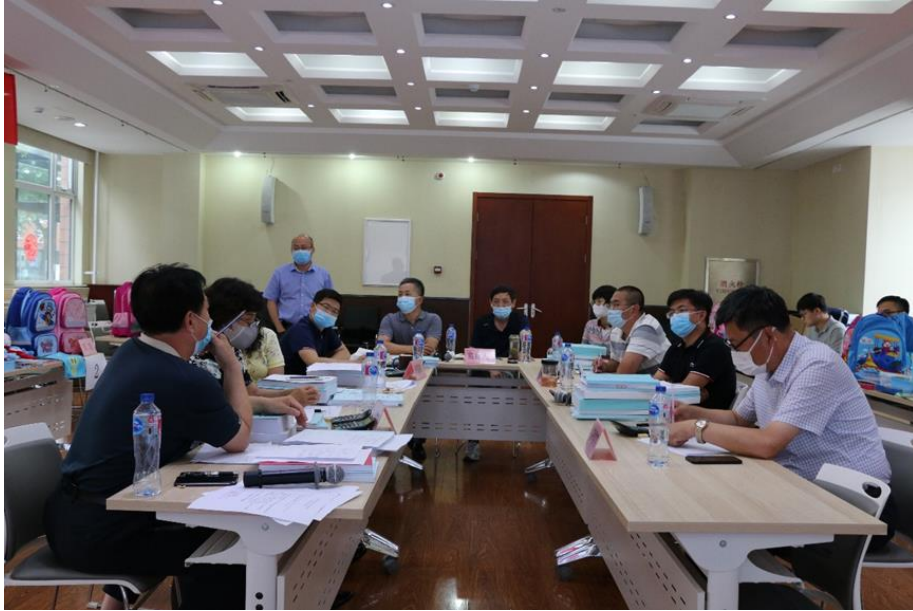
（爱心包裹学生型美术包竞争性磋商会议现场图）

份有限公司、贝发集团、齐心集团三家国内知名文具生产商；最终成交的温暖包裹供应商为江苏红豆实业股份有限公司、山东耶莉娅集团有限公司、豪爵（北京）制衣有限公司、江苏绿洲制衣有限公司四家国内知名制衣企业。