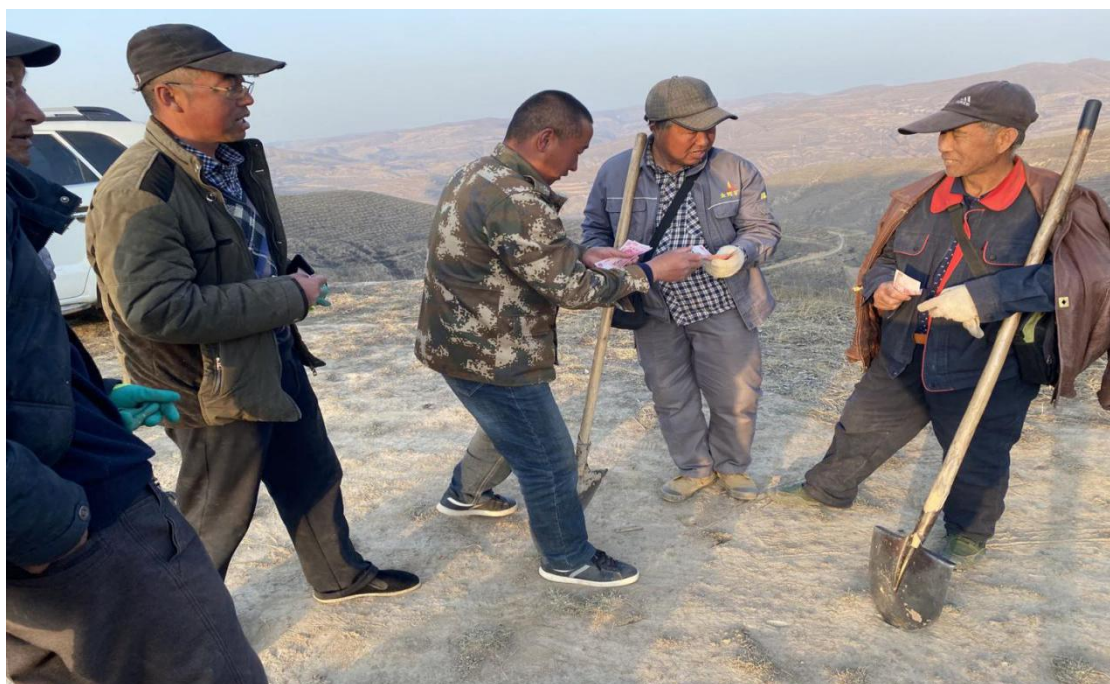
图 2 项目区村民领取务工收入