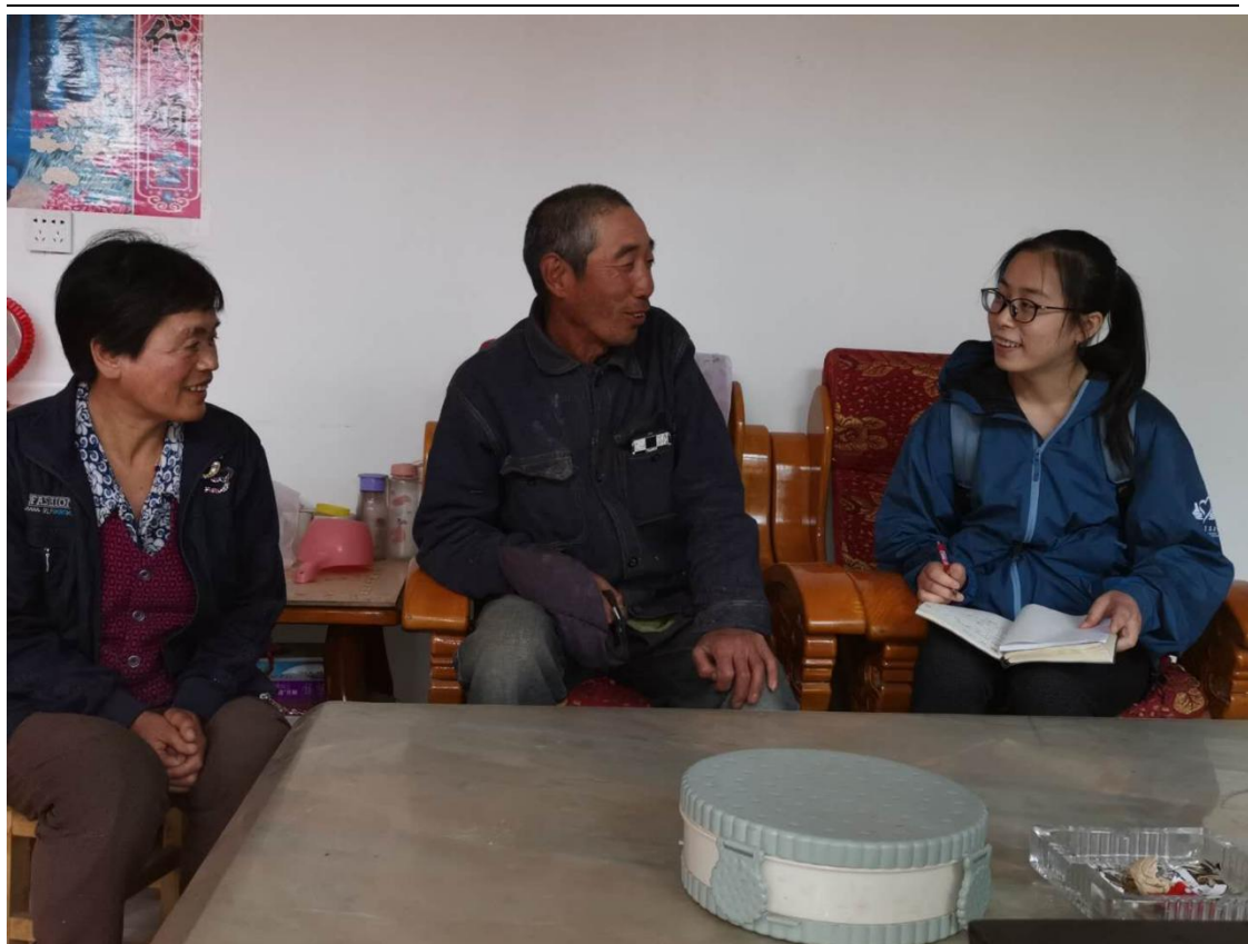
图 5 项目人员访谈受益村民