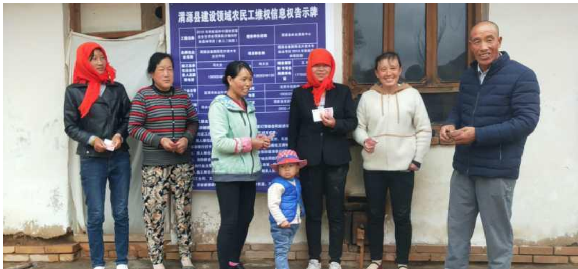
图 4 项目区村民拿到劳务收入后非常开心