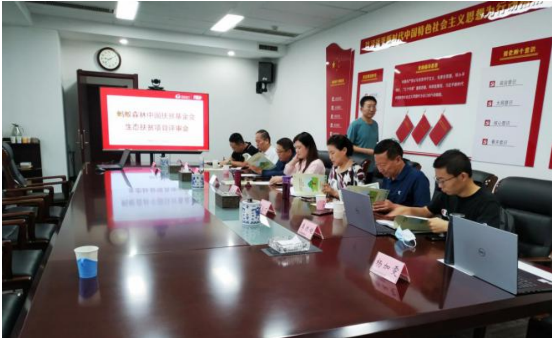
图9 山西省生态扶贫项目专家评审会

8月6日，中国扶贫基金会邀请山西省林草局、山西省扶贫办、山西农业大学等机构的5位专家，在山西省太原市召开2020年第二次蚂蚁森林中国扶贫基金会山西省生态扶贫项目专家评审会。