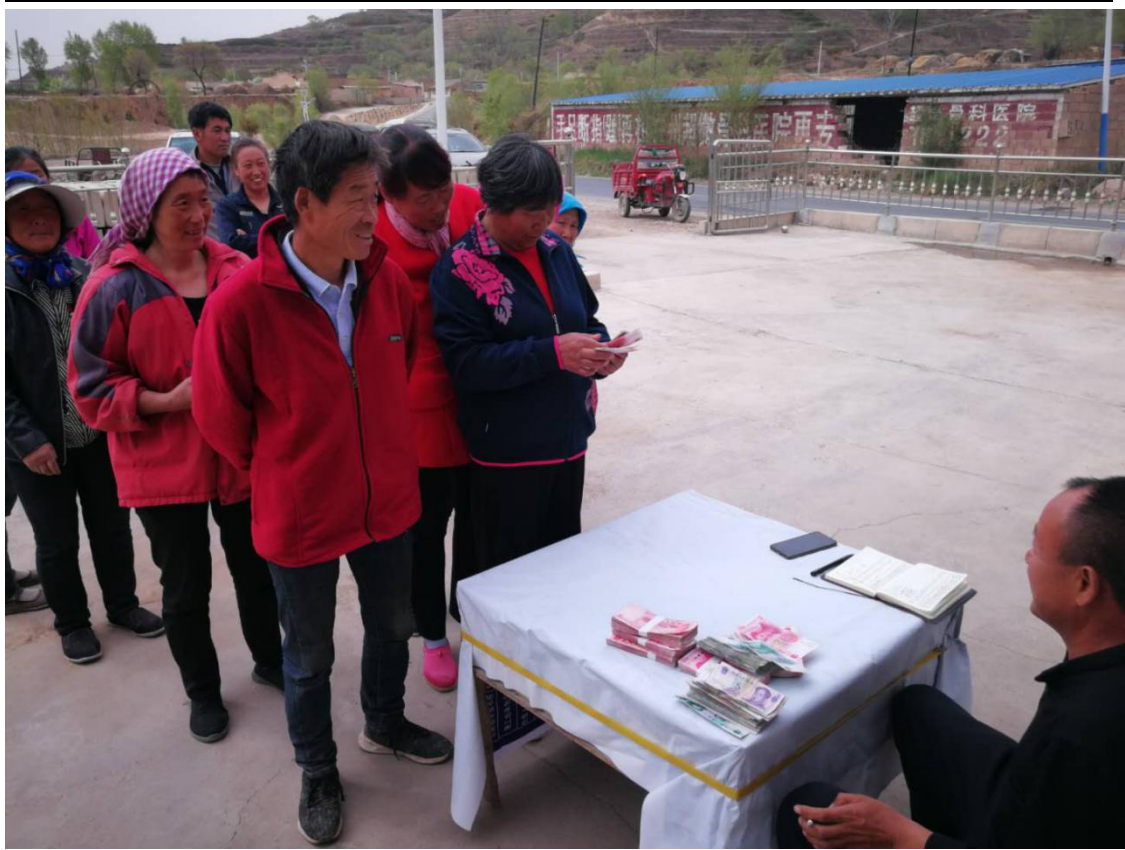
图 3 项目区村民领取务工收入