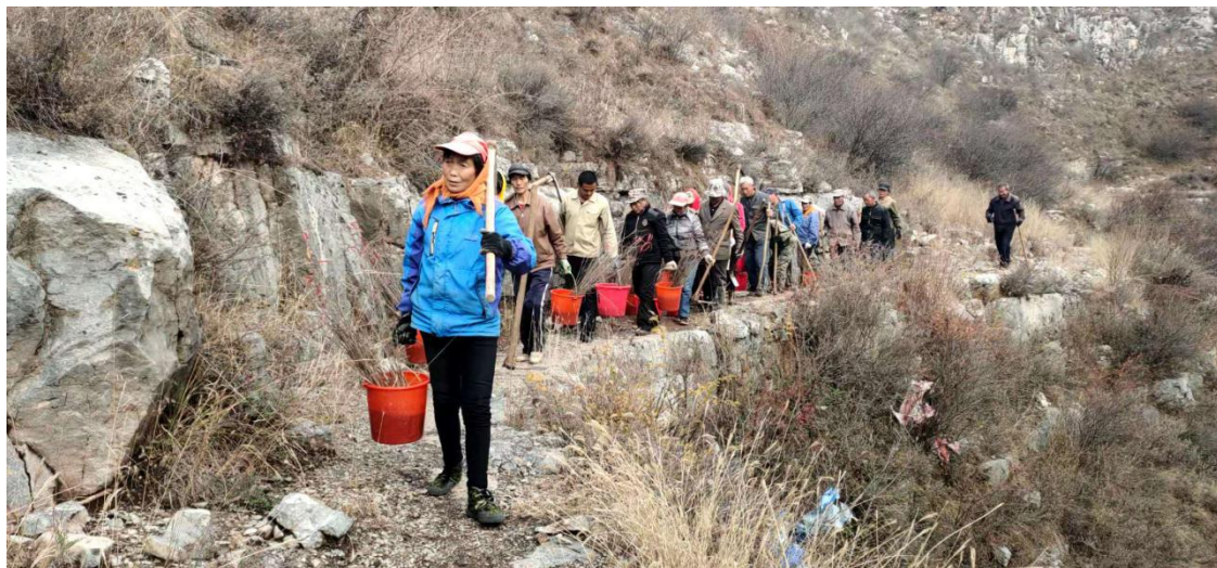
图 1 项目区村民参与项目种植

4-6月，春种项目区开展春季造林，中国扶贫基金会走访山西岢岚县、岚县、广灵县及甘肃渭源县、临洮县项目区，了解春种情况，与项目区沟通座谈。