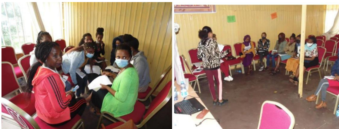
参会妇女分小组在培训中心讨论制定商业计划