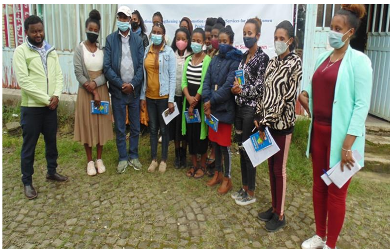
参加商业管理培训的受益妇女

埃塞妇女职业经济发展项目按照计划进行了商业管理的培训，目的是提高参会者的实际商业技能，鼓励妇女从事创收活动。受益妇女积极参与培训并完成了小组作业。