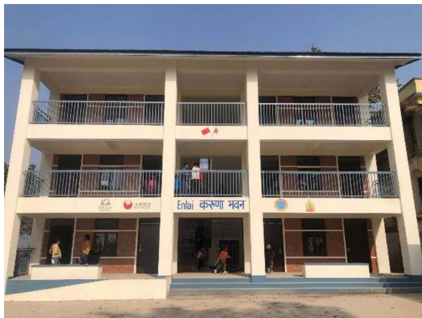
尼泊尔受益学生在阿南达库迪学校新建的悲悯楼上课