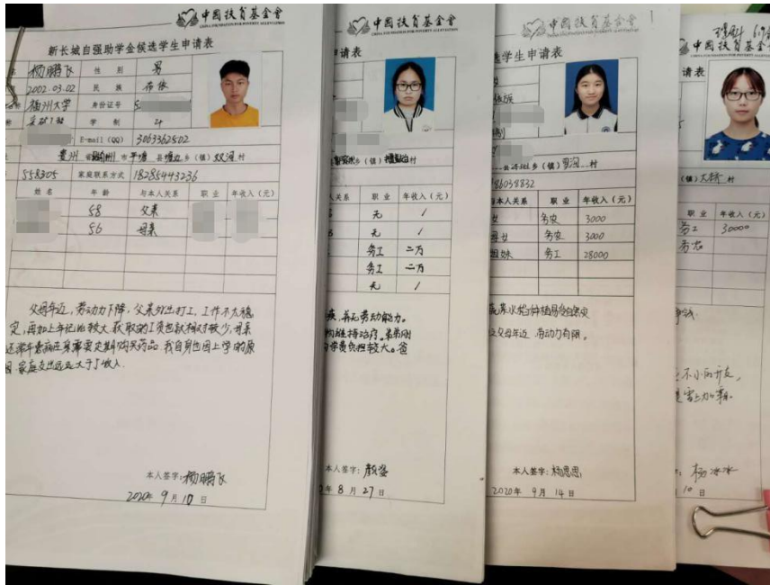
(图 1: 县推荐受益学生申请材料收集审核)