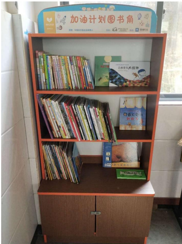
图 1| 图书角图书整齐摆放