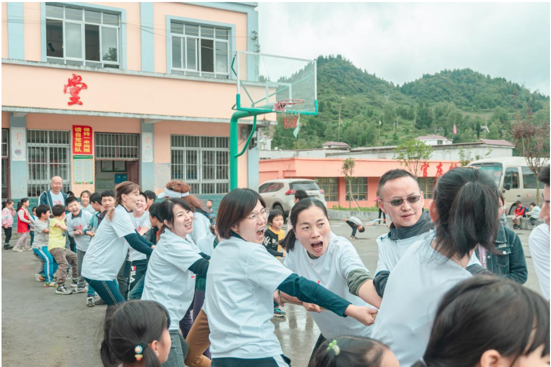
捐赠人和孩子们共同参加拔河比赛