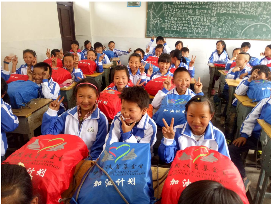
学生们收到“运动包”开心溢于言表