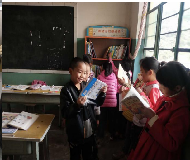
图 2| 孩子们课间借阅图书