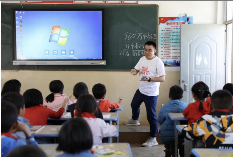
月捐人为学生准备的课堂