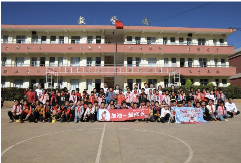
月捐人探访和孩子们的合影留念