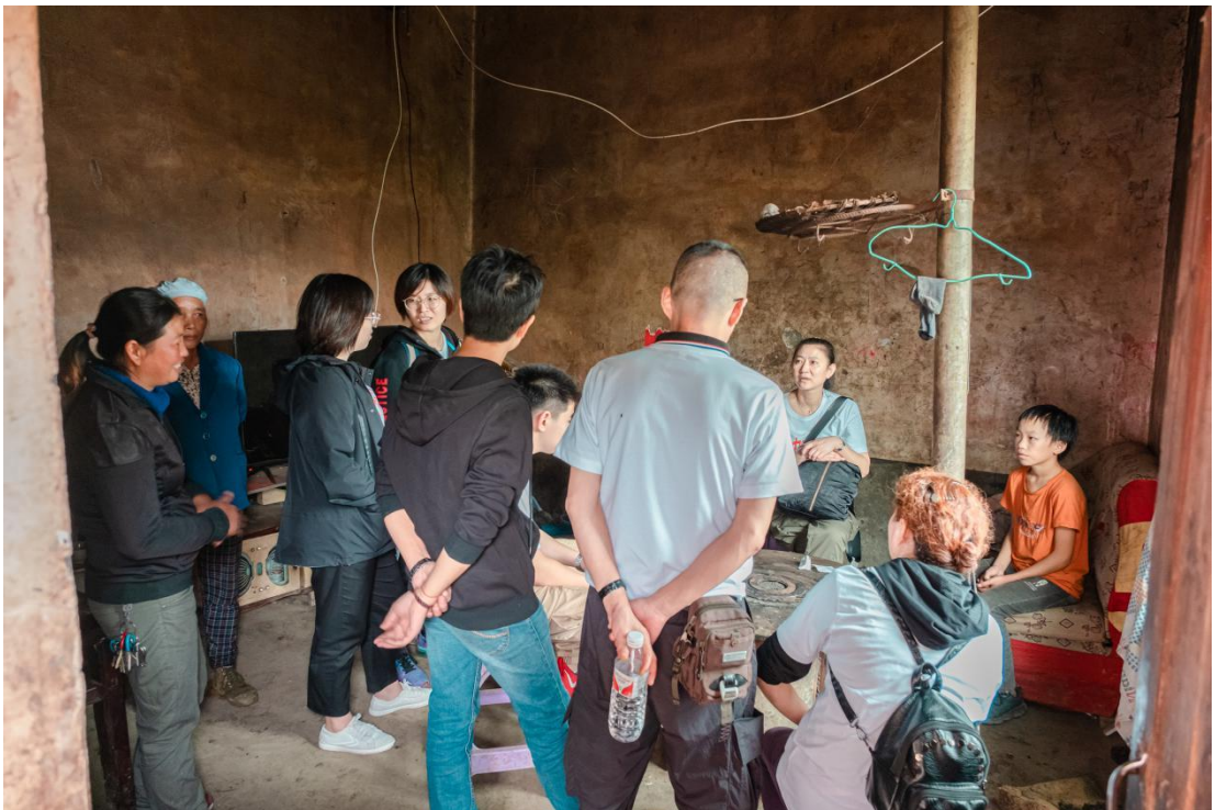
捐赠人探访“一对一”捐赠的孩子的家