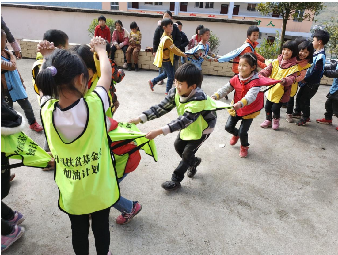
学生们加油课的“凌波舞”游戏

孩子们的幸福来自于美丽梦幻的“未来空间”。它是2018年由中国扶贫基金会汇聚爱心人士们的力量打造的，里面安装了木质地板，屋顶是耀眼的LED射灯，墙壁上悬挂有超大液晶电视，柜子里有笔记本电脑。整个未来空间五颜六色、丰富多彩、如梦如幻，使人向往未来。这里是我们的加油教练给孩子们上加油课的地方。“加油课”是中国扶贫基金会根据乡村学校设定的一大特色课程，对培养学生的合作精神、耐挫力、建设性交流能力和创造力，以及对学生的心理健康教育、丰富学生校园文化生活等都起到了举足轻重的作用。