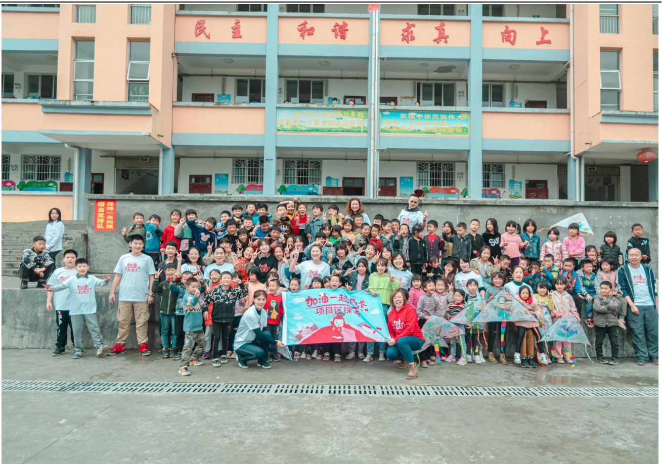
月捐人探访官庄小学和孩子们的合影留念