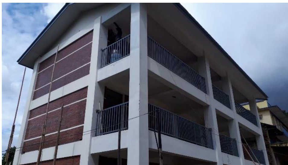
尼泊尔 ANANDA KUTI 学校教学楼主体

尼泊尔阿南达库迪 ANANDA KUTI 学校灾后重建工程完成，并举行了了交付仪式