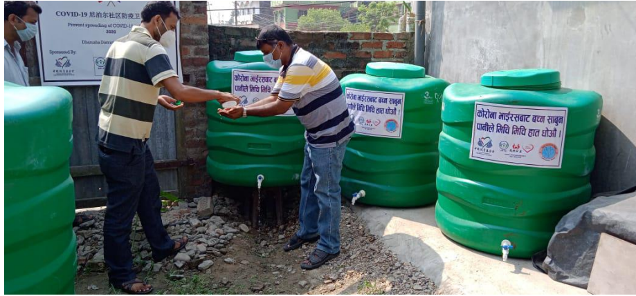
尼泊尔社区居民卫生防疫洗手站捐赠仪式