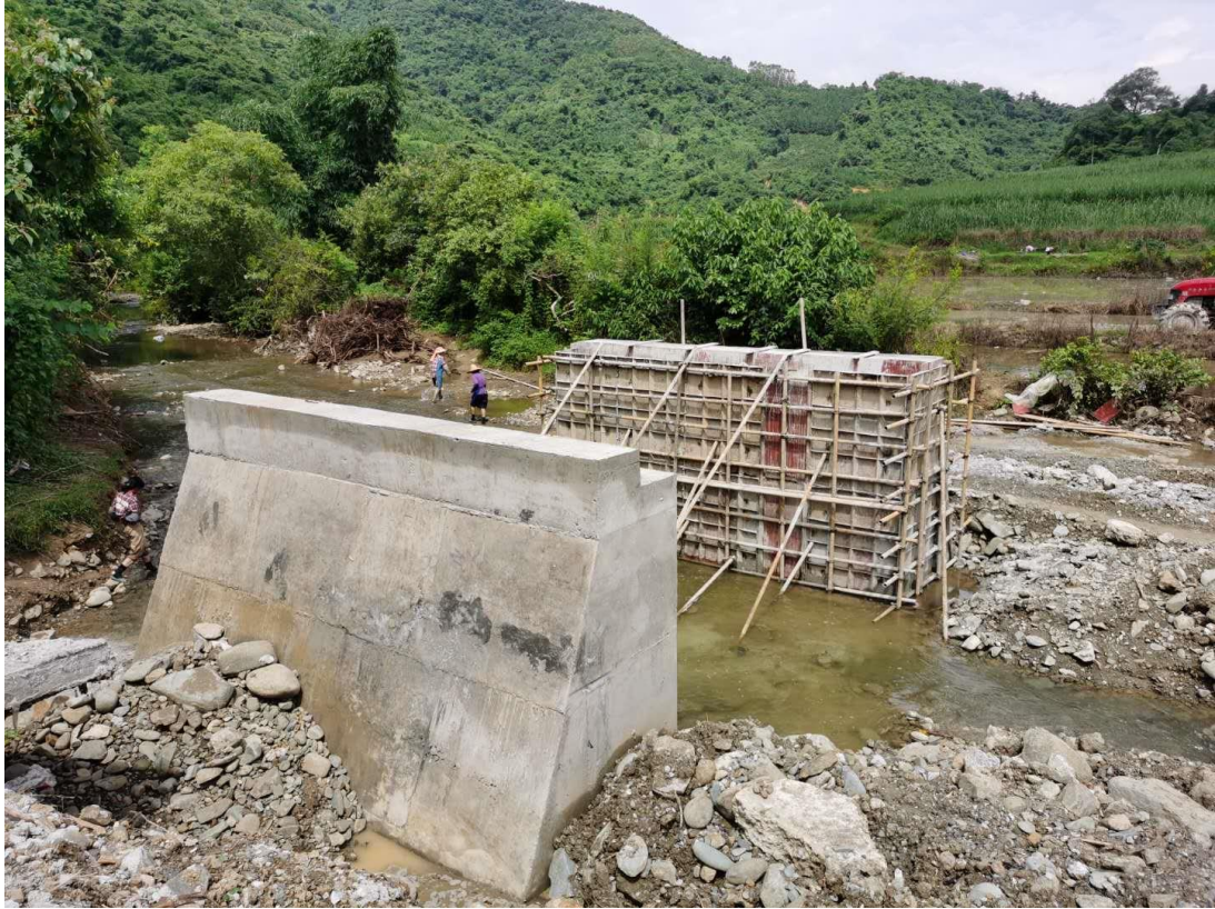
田林县便民桥进展照片