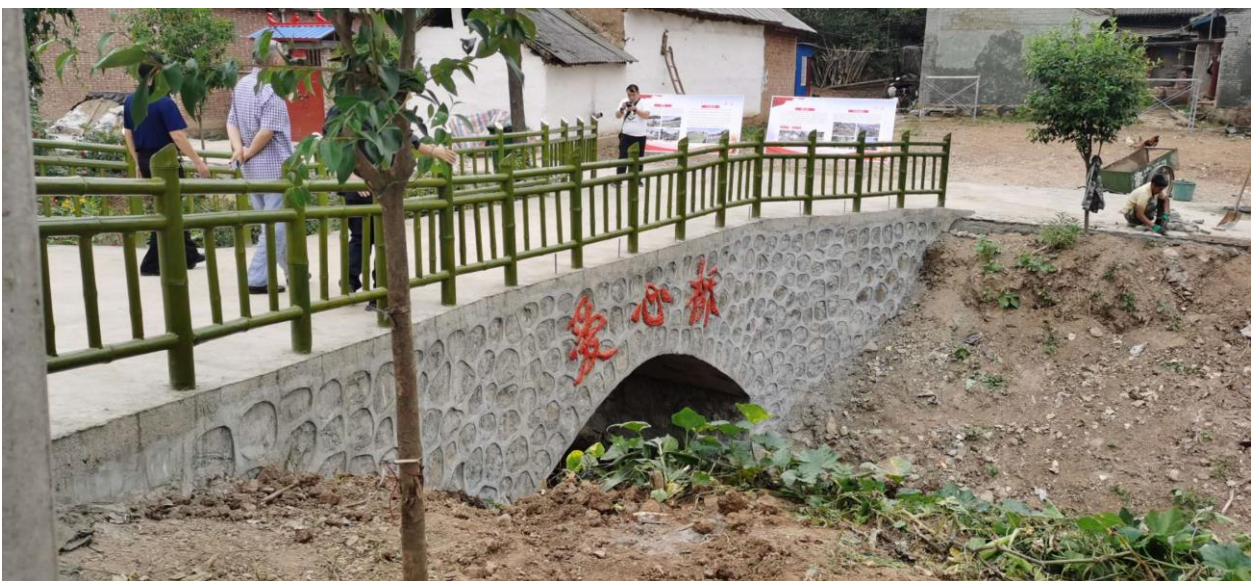
洛宁县便民桥进展照片