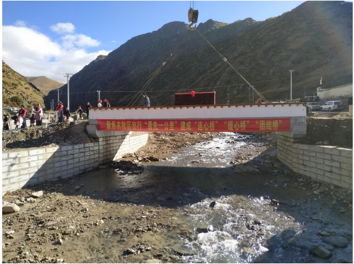
墨竹工卡县便民桥进展照片