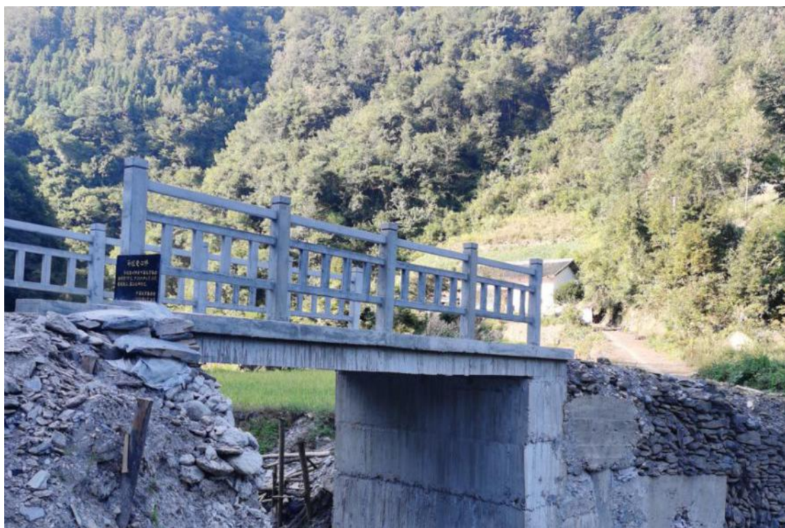
平利县马咀村爱心桥竣工验收