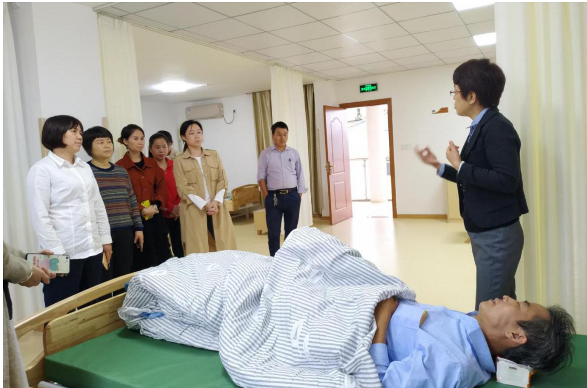
石城县扶贫养老项目院内管理服务实训课