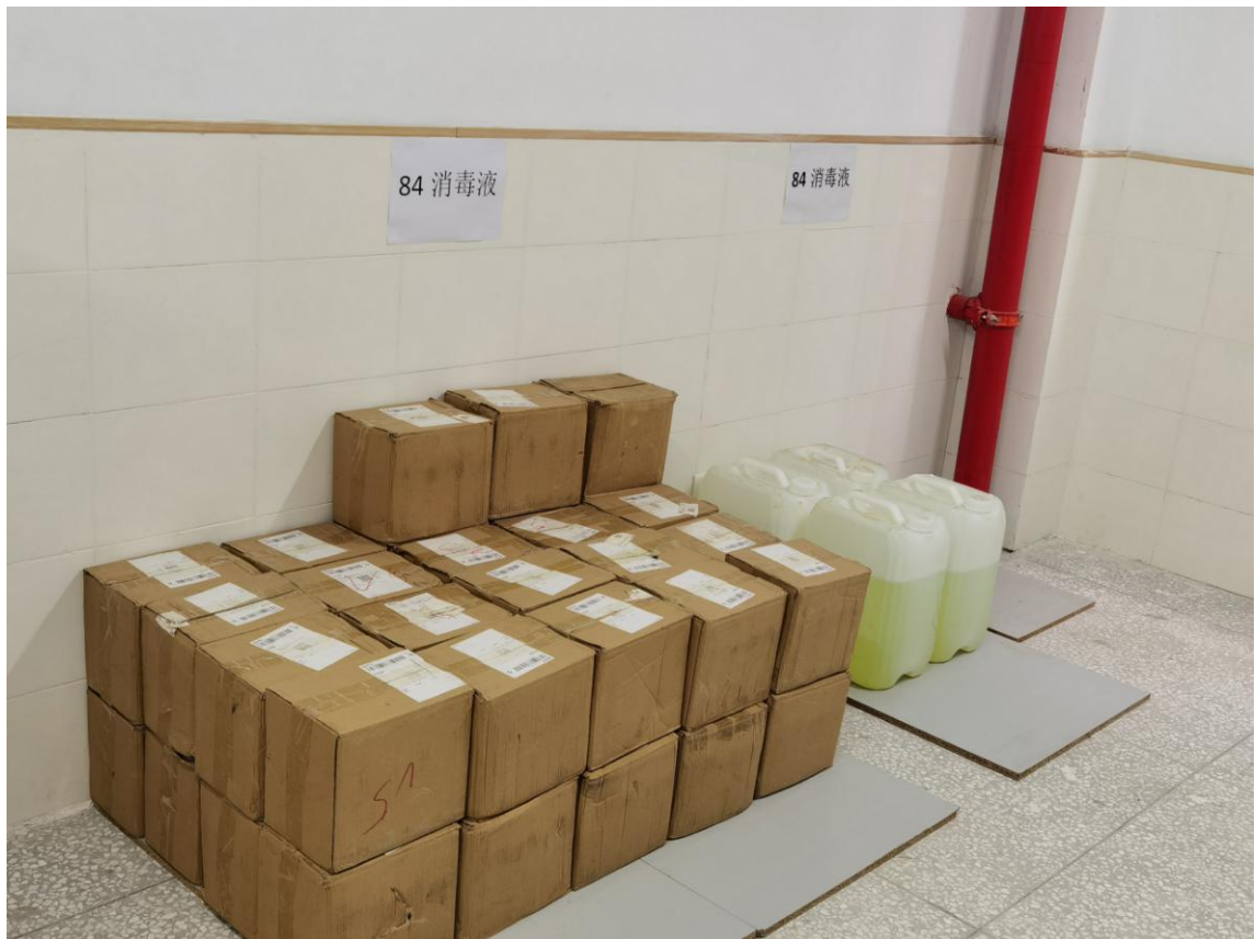
彭水县卫生室采购完成