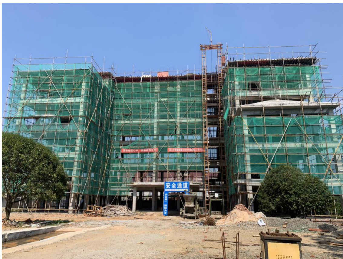
遂川县泉江镇中心养老院院民服务大楼综合楼建设项目主体建设中