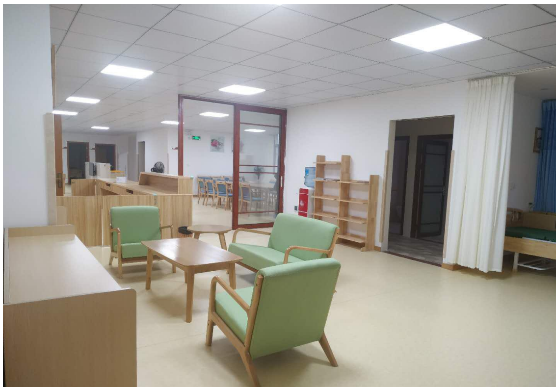
石城县养老院部分改造成果