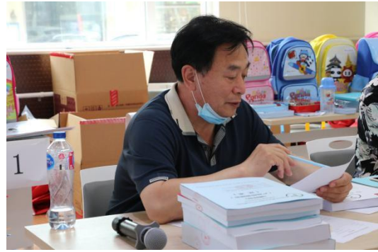
评审专家组成员审定标书及查看样包