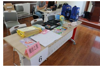
厂家根据招标文件所定制的样包