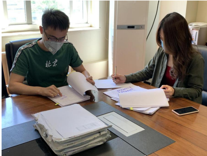
项目团队认真审核签字表