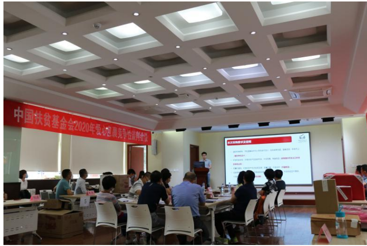
工作人员介绍国际爱心包裹项目及评标规则