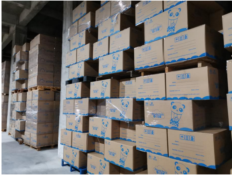
在供应商仓库中存放的国际爱心包裹