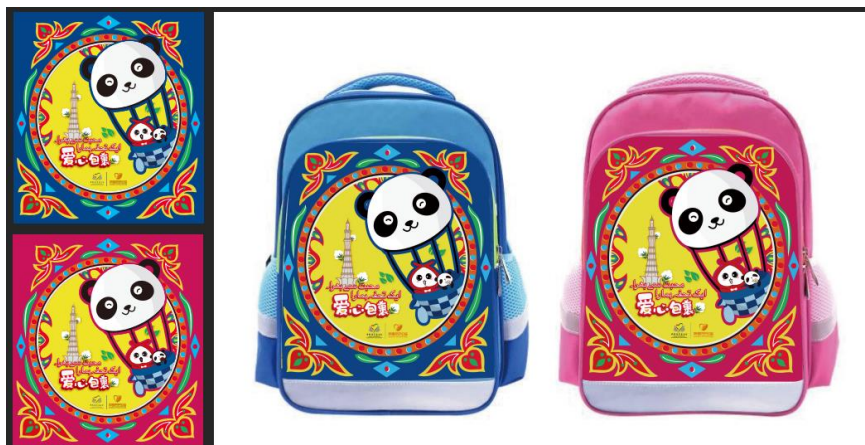
巴基斯坦爱心包裹设计图