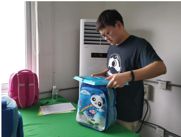
项目工作人员对国际爱心包裹进行验货

5. 6月11日，国际爱心包裹项目招标会在中国扶贫基金会顺利举行，共有6家厂家参与投标，经过样品检验、厂家述标、评委问答、二次报价、评审专家组打分等环节，最终确定贝发集团股份有限公司、深圳齐心集团股份有限公司、真彩文具股份有限公司三家厂家成为2020年6月至2022年6月国际爱心包裹项目包裹生产供应商，并在中国扶贫基金会官网进行公示。