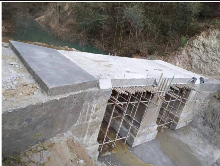
NO.036 秧田坝爱心桥（在建）