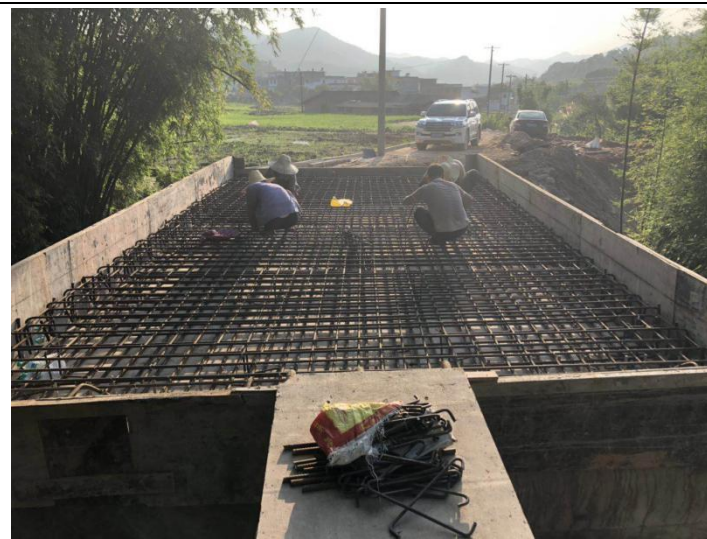
NO.308 大畚水口公路桥 (在建)