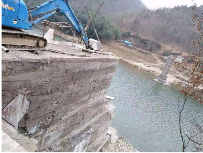
NO.006 杨庄村团结桥（在建）