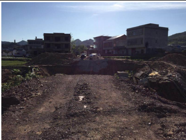
NO.370 伦飞桥 (在建)