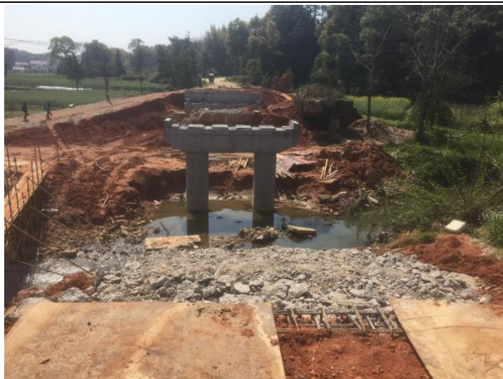
NO.270 望景桥 (在建)