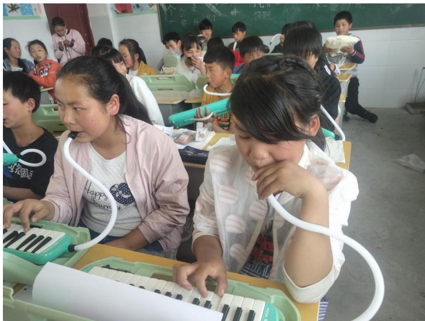
镇雄县的孩子们在学习音乐包中的口风琴

2019年6月，为苏木小学、关口小学、阳光小学、小洛小学、青山田坝小学、和平沟小学、瓦房小学、罗汉小学、联合小学和盐井小学 10 所项目学校的孩子们发放体育包 2623 个。