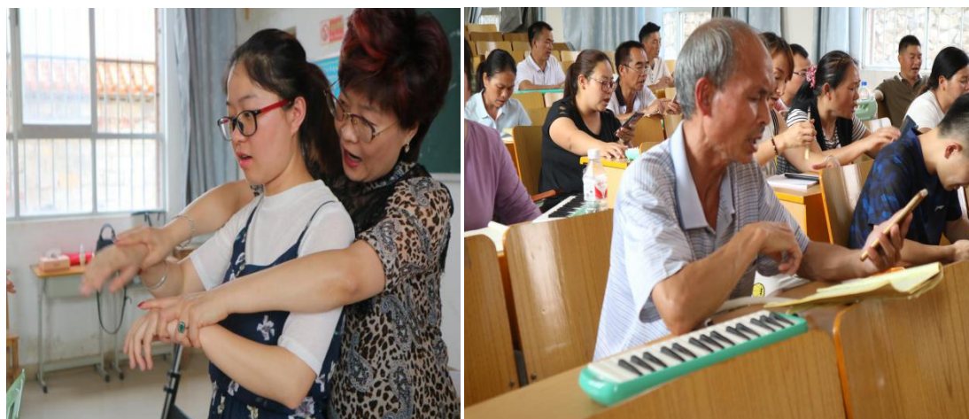
左图 音乐培训师指导参训教师打节拍

2019年3月、4月和5月，分别举行了共计3次音体美教师培训，共有8所项目学校的76名教师参训。