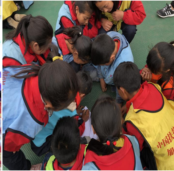
左图：参训教师在加油课程培训中学习热身游戏