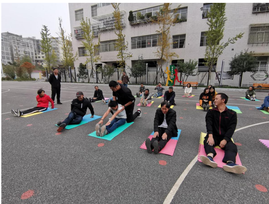
参训教师在体育课程培训中做拉伸运动