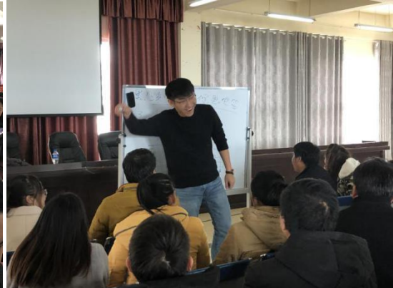
参训教师在音乐培训中学习口风琴吹奏及节拍