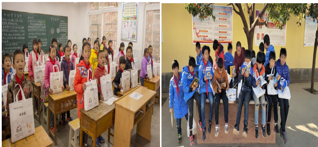
孩子们收到图书包

2019年11月，为新发小学、糯租小学、瓦窑小学、发启小学、光明小学、娜姑镇拖车小学、张家村小学、迤北小学、箐口回龙小学、迤车镇拖车小学、山咀小学、盐水小学、懂德小学、瓦厂小学、岩脚小学、冬瓜林小学、拖翅小学、务嘎小学、清水小学、马厂小学、大麦冲小学、光头小学、凉水小学、大坪子小学、野猪冲小学、三岔小学、联合小学、江边小学、石鼓小学和头塘小学30个项目学校的孩子们发放了图书包6181个。