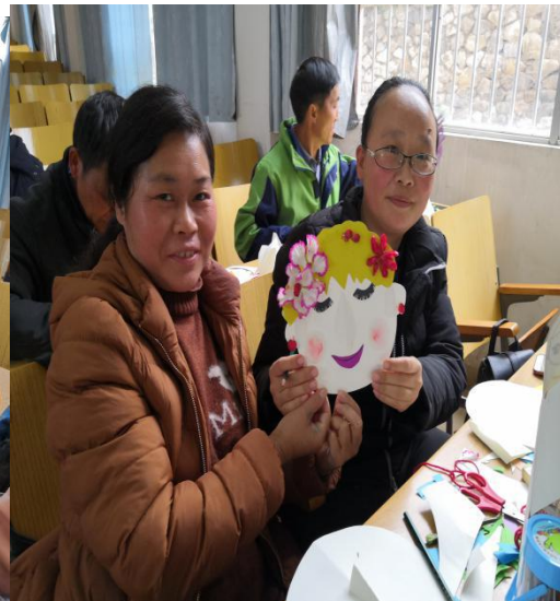
右图 参训美术教师展示手工制作成果