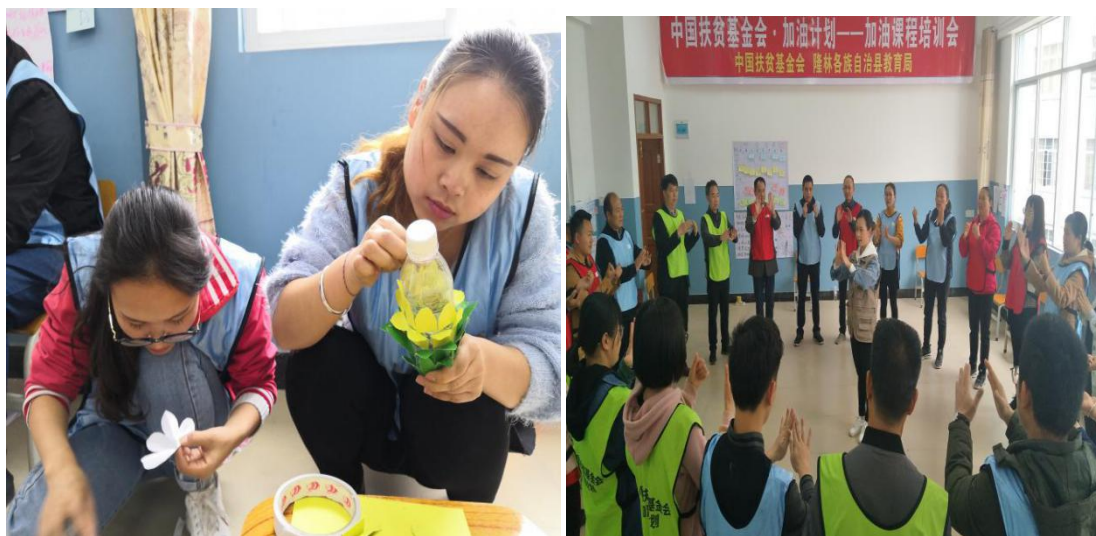
左图 参训教师体验加油课“创造力”主题游戏

2019年3月，为大树脚小学、弄桑小学、新立小学、新民小学、蒙里小学、道达小学、伟岭小学和保上小学8所项目学校的24名教师开展了共计1次加油课程培训，8所项目学校1-6年级在春季学期中均开展每周一节的加油课。