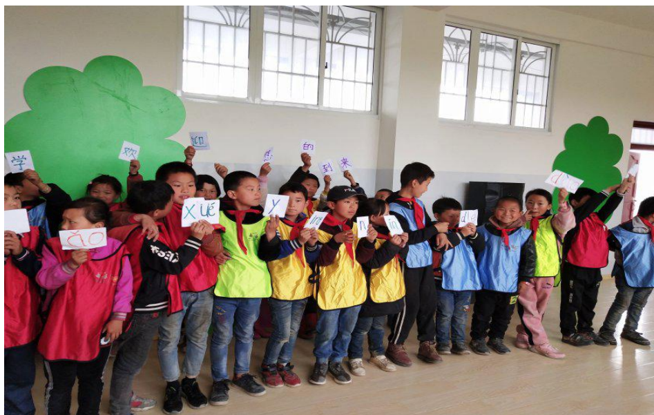
镇雄县孩子们在加油课上玩“找朋友”的游戏

2019年3月、9月和10月，分别举行了共计6次音体美教师培训，培训教师共计499人次。