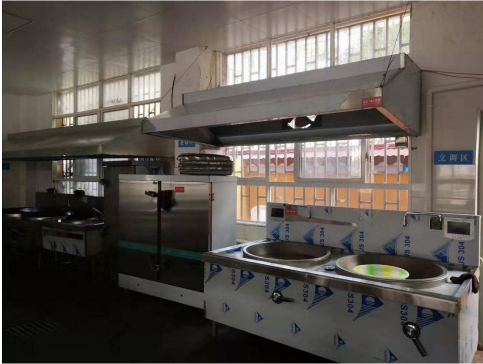
镇雄县爱心厨房实例图

2019年11月,为陇家湾小学、山顶小学、陇东小学、六井小学、新田小学、吴家寨小学、安家坝小学、麻园小学、杨家寨小学、放马坝小学、茶园小学、串九小学、后槽小学、菜子小学、茶卓小学、官庄小学、庙坪小学、青杠坪小学、大河小学、苏木小学、关口小学、阳光小学、小洛小学、青山田坝小学、和平沟小学、瓦房小学、罗汉小学、联合小学和盐井小学29所项目学校修建了图书角176个。