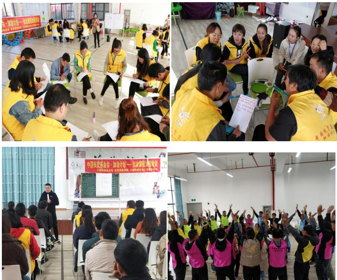
参加加油课程培训的老师们

2019年3月和9月分别开展了共计4次加油课程培训,培训教师240人次,30所项目学校1-6年级在学年中均开展了每周一节的加油课。