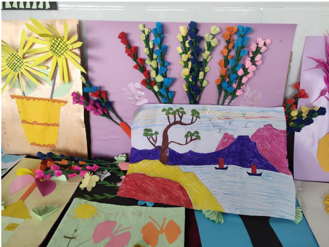
镇雄县的孩子们的美术作品展示