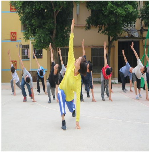
左图 参训体育教师在学习热身运动