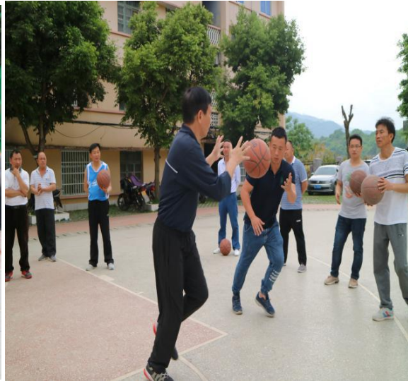
右图 体育培训师传授传球技巧