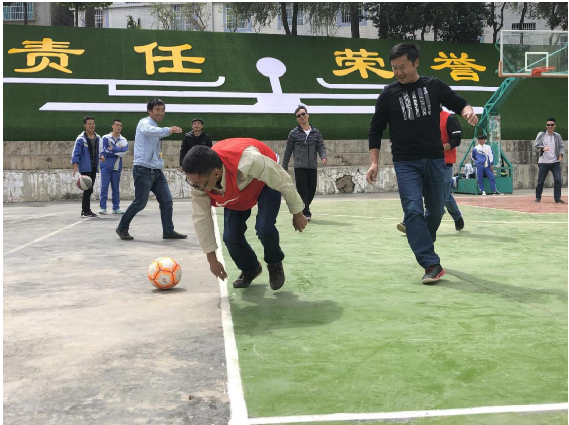
参训教师在体育培训中学习传球技术