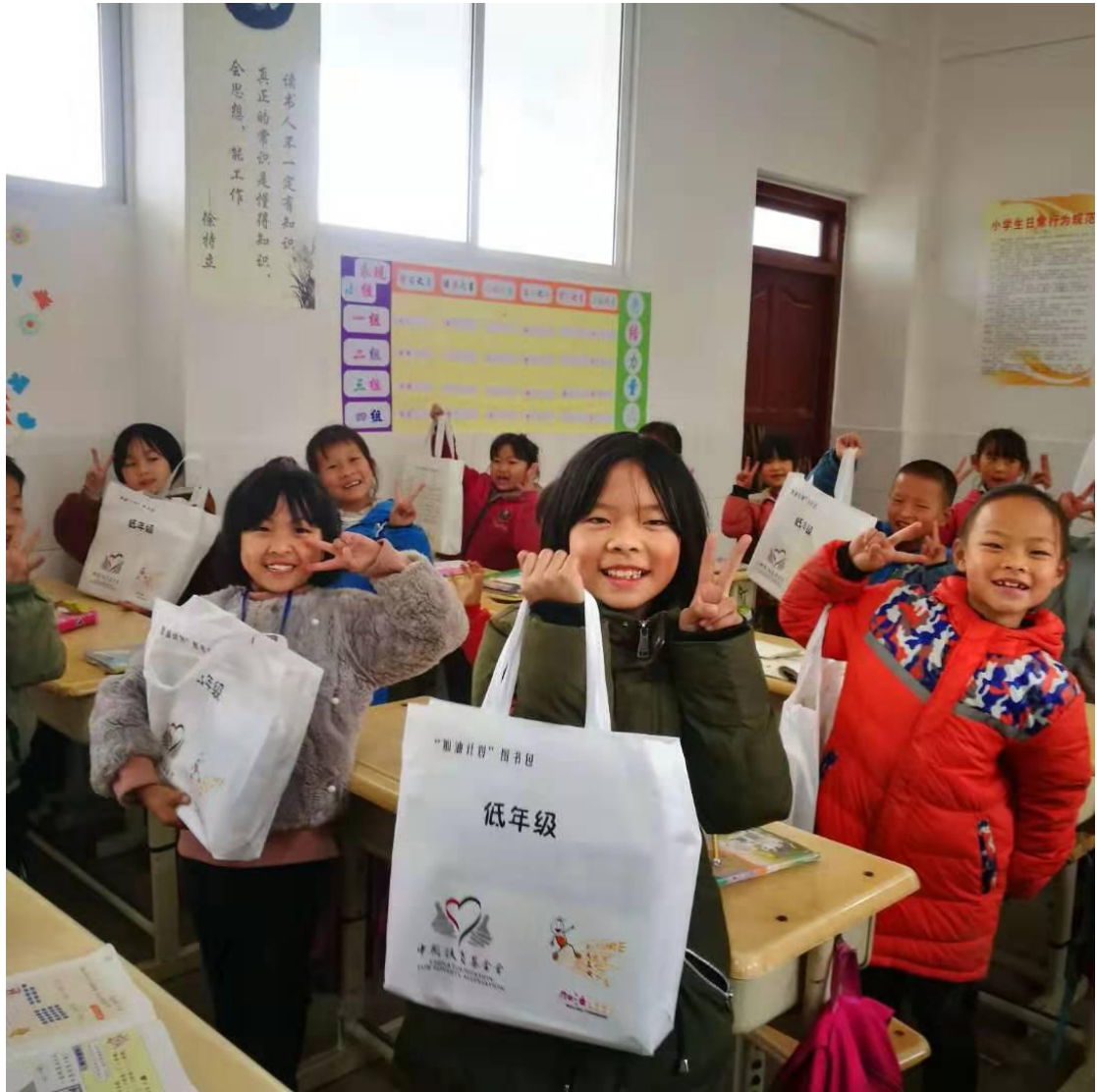
镇雄县的孩子们领到图书包后合影

2019年，3月和9月，分别开展了共计2次加油课程培训，培训教师共计164名，29所项目学校1-6年级在学年中均开展了每周1节的加油课。