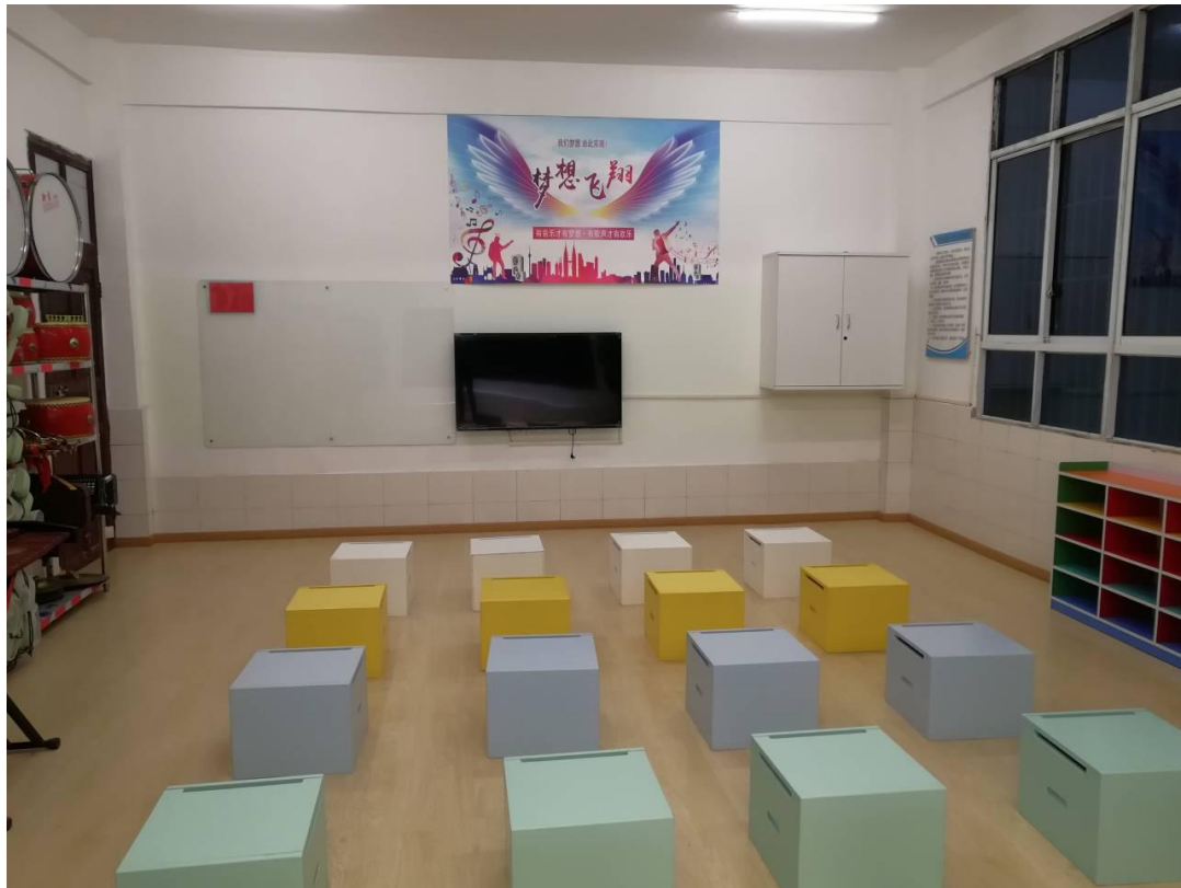
镇雄县未来空间实例图

2019年7月，为茶园小学、串九小学、后槽小学、菜子小学、茶卓小学、官庄小学、庙坪小学、青杠坪小学和大河小学9所项目学校修建了未来空间。