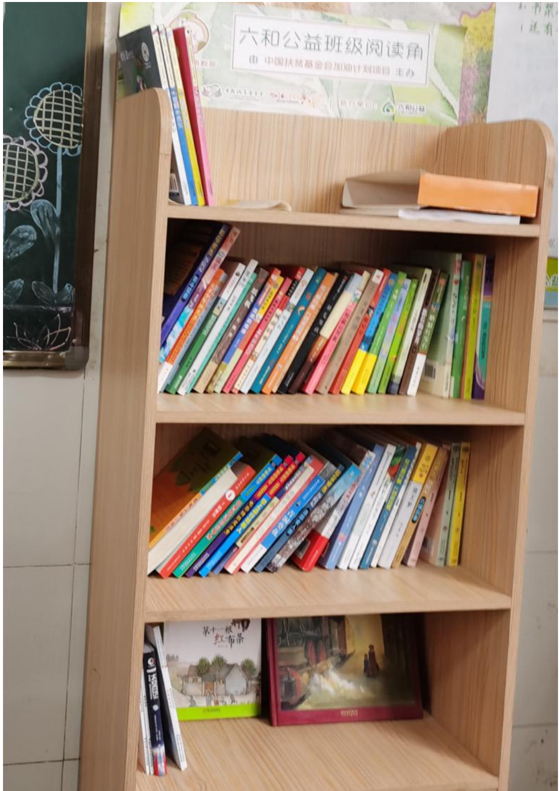
镇雄县教室图书角实例图

2019年5月，为苏木小学、关口小学、阳光小学、小洛小学、青山田坝小学、和平沟小学、瓦房小学、罗汉小学、联合小学和盐井小学 10 所项目学校的