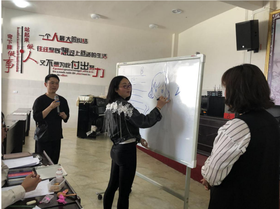
参训教师在美术培训中上台示范