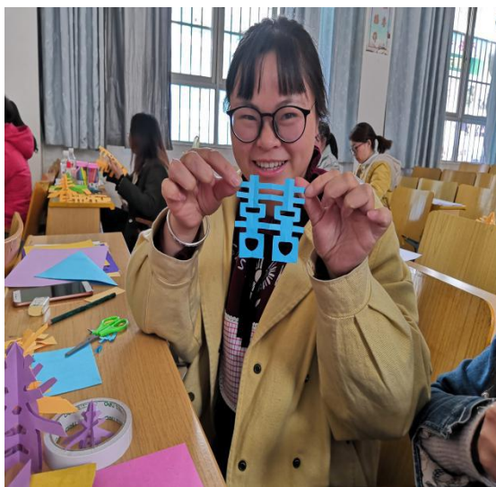
左图 参训美术教师学习剪纸