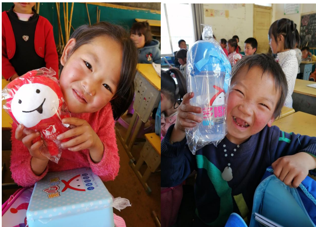
领到美术包的孩子们

2019年11月，为院箐小学、花园小学、元林小学、蛇街小学、玉屏小学、红岩小学、二田小学、双河培才小学、松发小学、小米小学、五嘎小学、新发小学、天龙小学、出水小学和么站小学 15 所项目学校的孩子们发放美术包 4212 个。