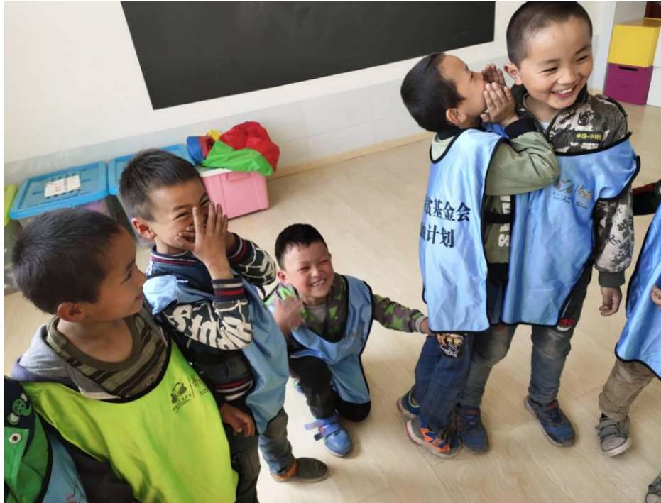
镇雄县孩子们在上加油课