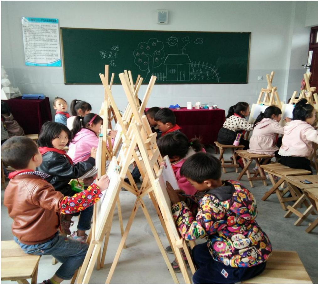
镇雄县的孩子们在美术课上作画