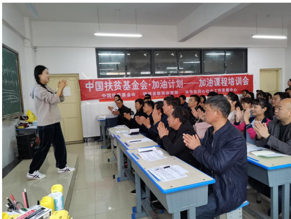
镇雄县教师在音乐课程培训中学习打节拍