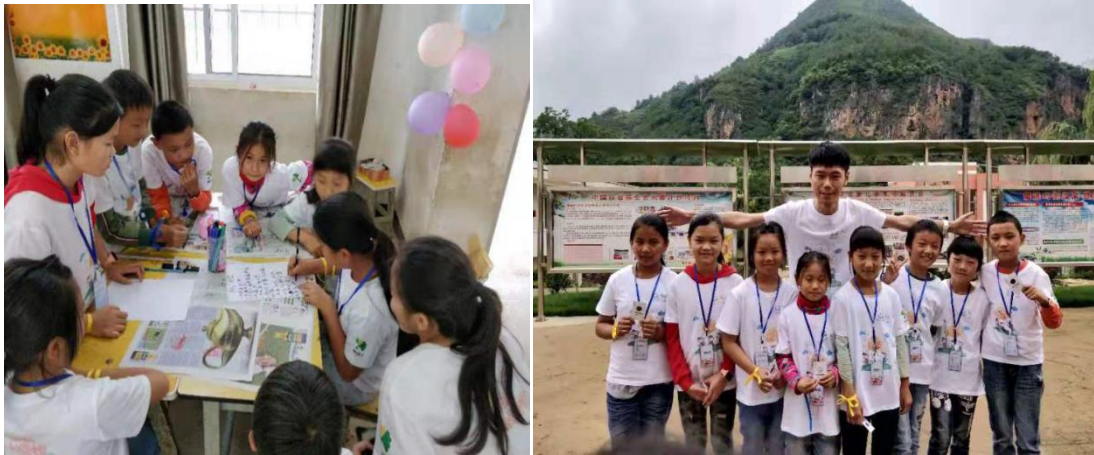
左图 城乡孩子共同完成夏令营任务

2019年7月19日至8月1日，加油计划在会泽举办乡村夏令营与城乡夏令营两期营会。第一期营会为乡村夏令营，于7月19日至7月26日在会泽的岩脚小学、山咀小学、糯租小学、大坪子小学、光头小学、迤北小学、江边小学和发启小学共计8所学校开展，共有来自云南大学和云南财经大学两所高校的30名大学生志愿者和240名乡村孩子参加。第二期营会为城乡夏令营，于7月28日至8月1日在会泽的山咀小学、大坪子小学和张家村小学3所学校开展，共有来自云南财经大学的26名大学生志愿者、82名乡村孩子和来自全国各地的33名城市孩子参加。