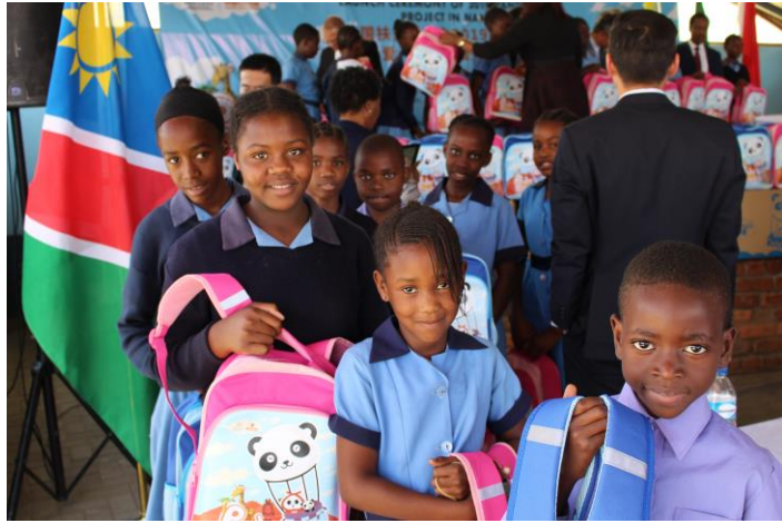
纳米比亚受益学生