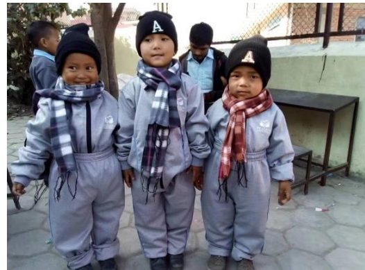
爱心包裹（温暖包物件）