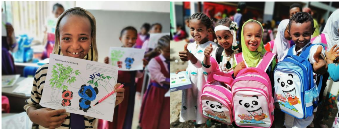
埃塞俄比亚受益学生