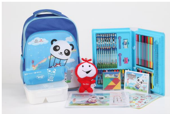
爱心包裹（文具包物件）