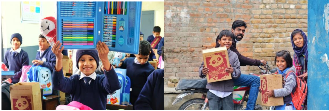
巴基斯坦受益学生