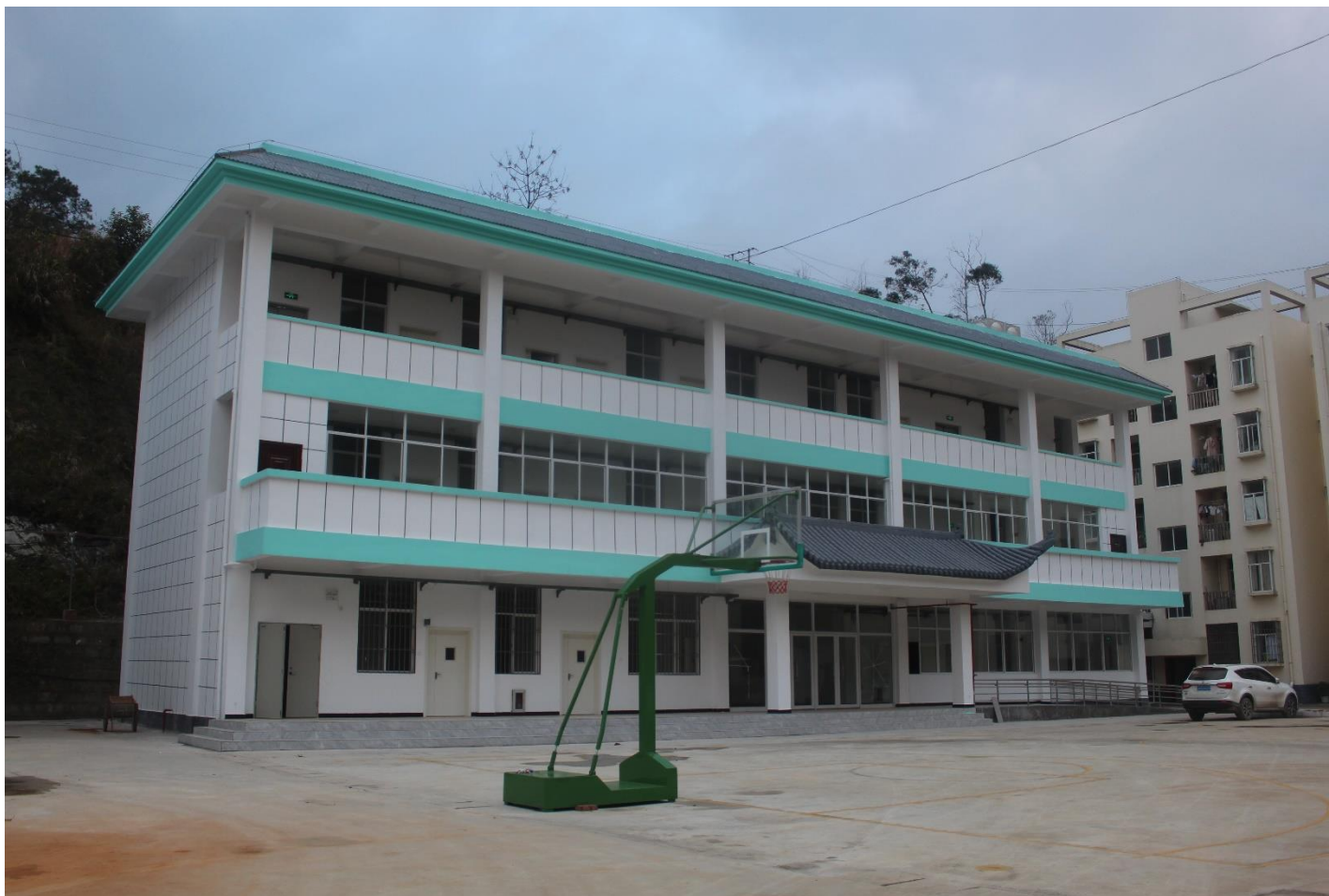
麻栗坡县杨万卫生院项目主体竣工照片