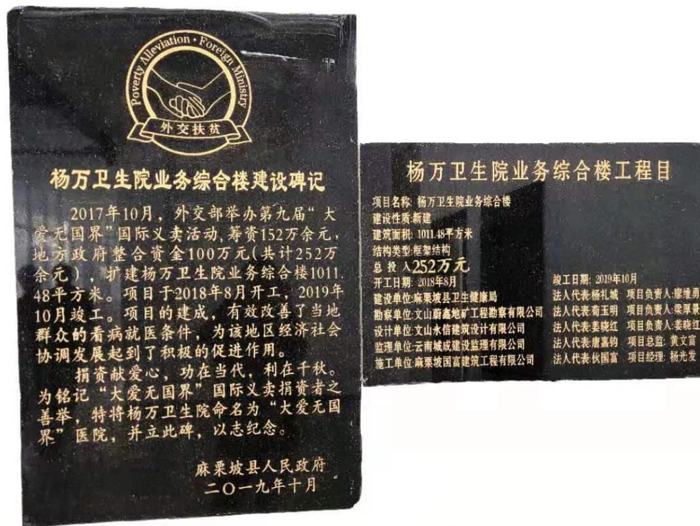
麻栗坡县杨万卫生院项目竣工碑记照片