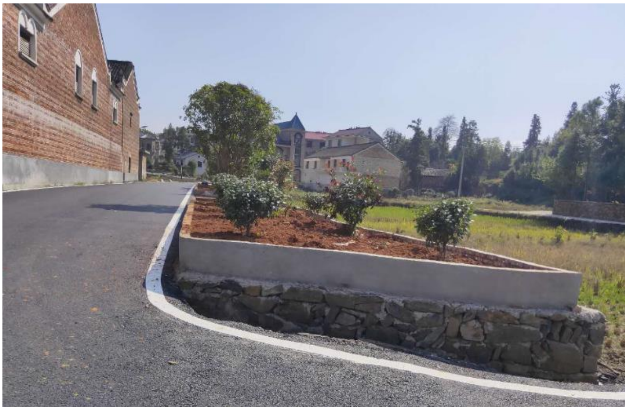
莲花县将军学院村宿扶贫和环境提升项目道路硬化照片