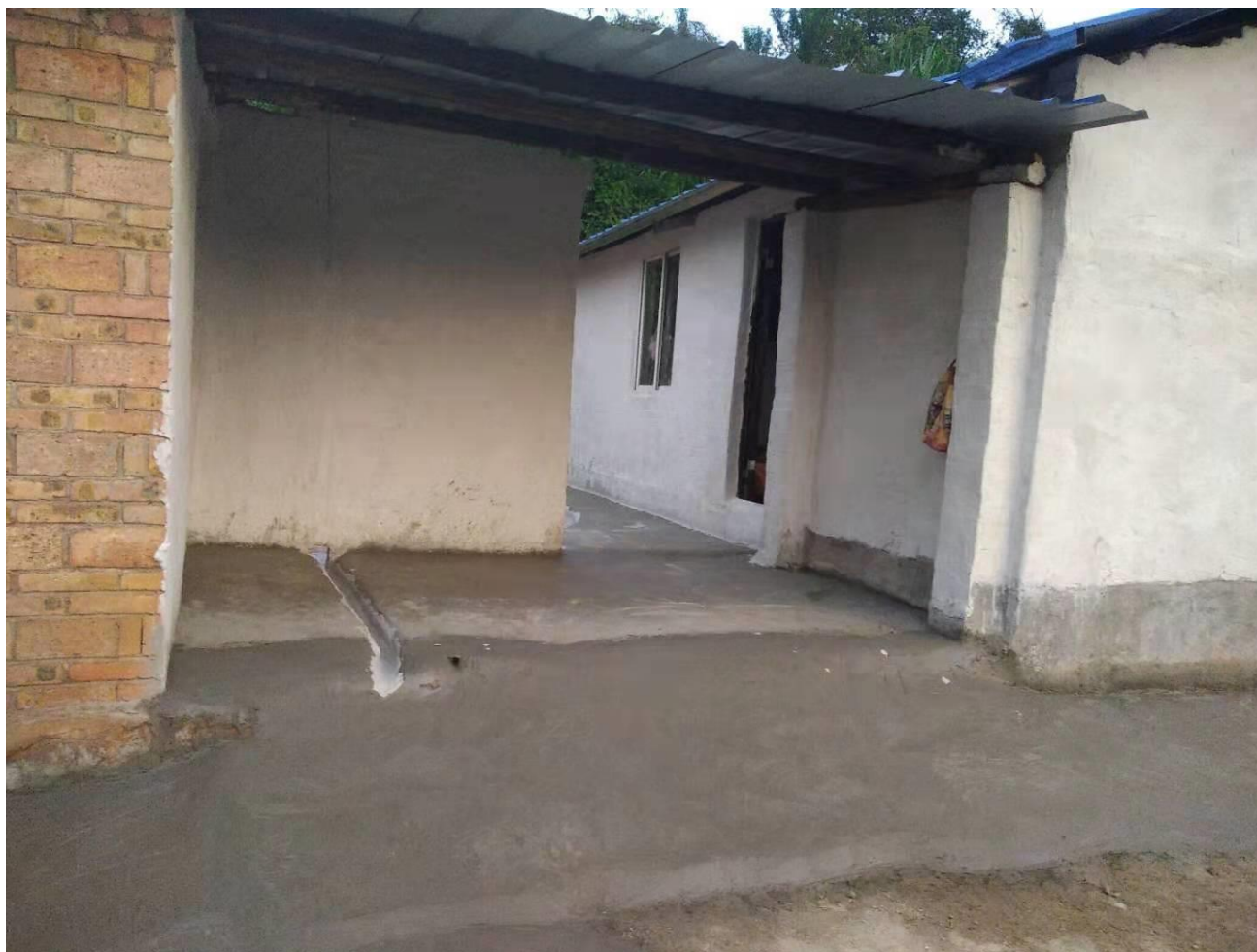
文山市脱贫攻坚补短板和环境提升项目农房改造照片