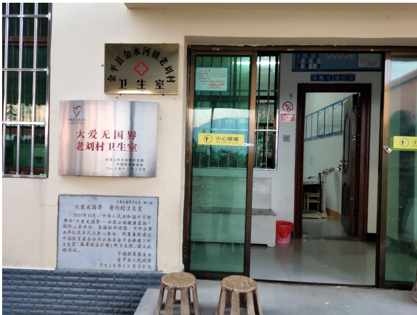
金平县金水河镇老刘村竣工照片