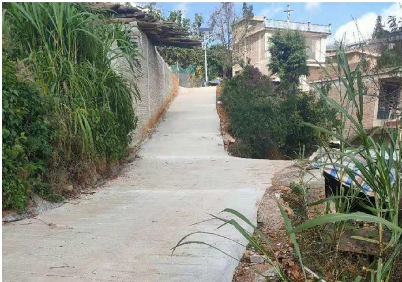
文山市脱贫攻坚补短板和环境提升项目道路硬化照片