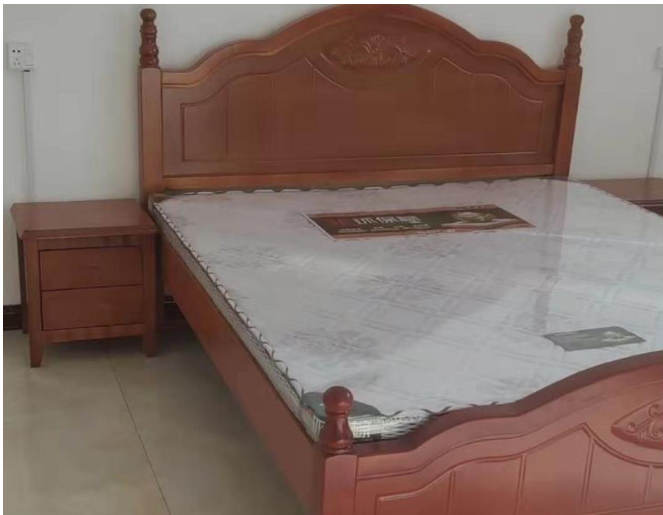
莲花县将军学院村宿扶贫和环境提升项目家电安装照片