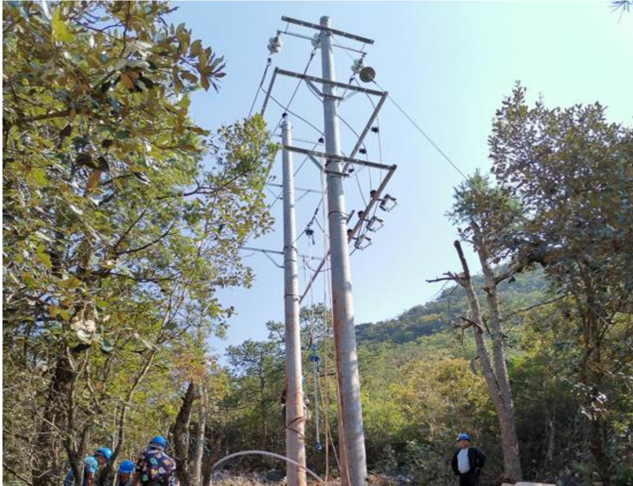
文山市脱贫攻坚补短板和环境提升项目整村通电照片