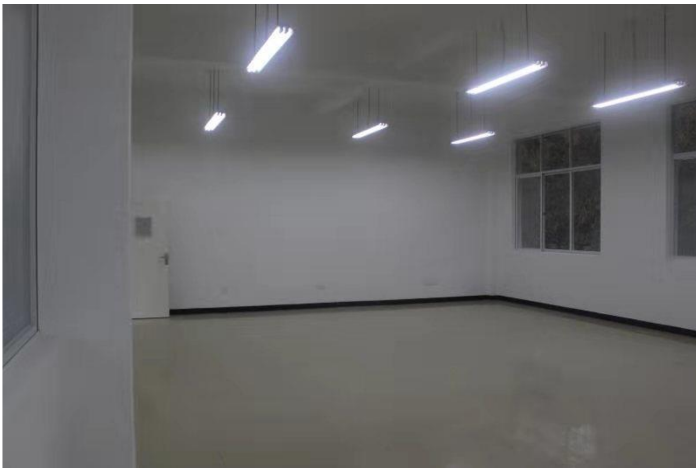
麻栗坡县杨万卫生院项目室内装修竣工照片