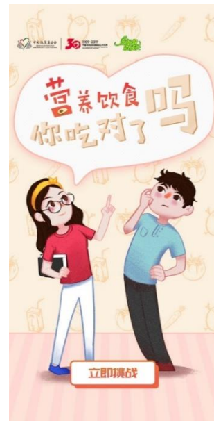
“520. 为爱加点料” H5