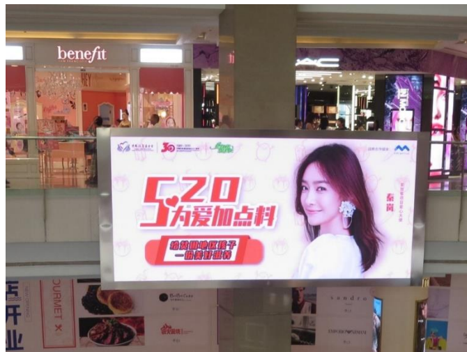
备注：520 为爱加点料户外广告

5月20日是全国学生营养日，爱加餐项目以此节日为宣传点，开展了一系列推广活动，制作“520 为爱加点料”H5、“营养是什么”九宫格海报等，投放于微信、微博、抖音等渠道；同时邀请爱加餐项目爱心大使包贝尔、包文婧、马天宇、秦岚等明星通过微博、户外广告的方式，动员公众参与互动，带动筹款。同时，中国网发布“中国故事|爱加餐 送给山区孩子的营养礼包”，助力项目传播。