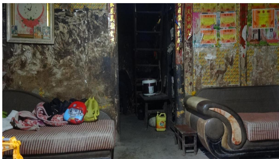
备注：小巧的家与墙上的奖状。

谈到中国扶贫基金会的爱加餐项目，她说：“有了社会各界爱心人士的关注，给了我们鸡蛋和牛奶的营养加餐，在学校才不会饿肚子。因为妈妈一个星期都拿不出 5 元给她，有时给 2、3 元，还要买学习用品，基本买不到什么吃的东西。不过有了社会各界爱心人士的关注，我们不能白白浪费、白白糟蹋，要不断地努力以优异的成绩回报父母，长大后用自己的才能回报祖国，相信我们未来的祖国更加辉煌灿烂。”