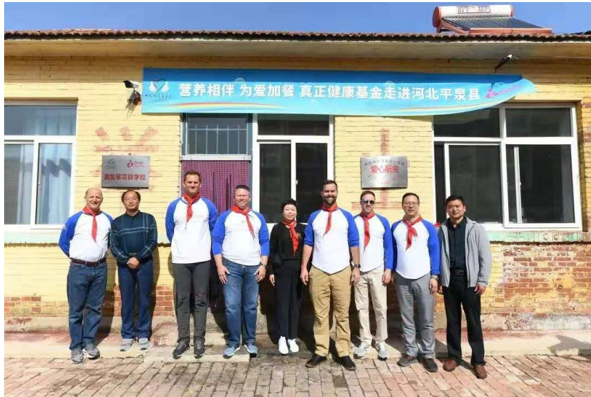
备注：“营养相伴 为爱加餐”揭牌仪式在河北平泉市受益学校举行。