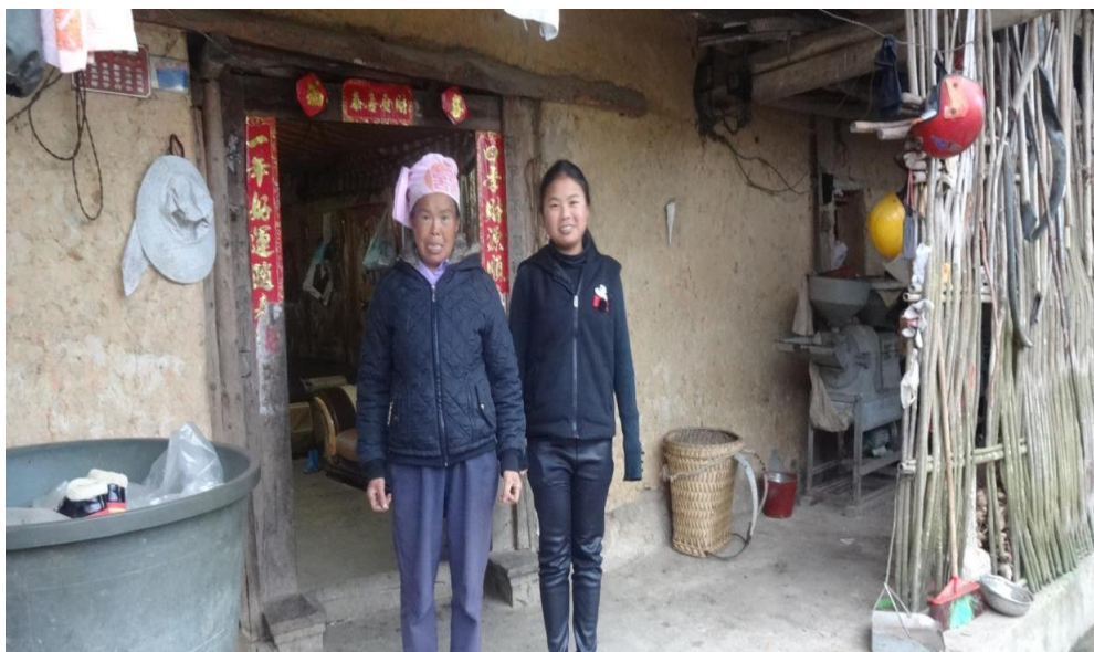
备注：小巧与她 50 岁的妈妈