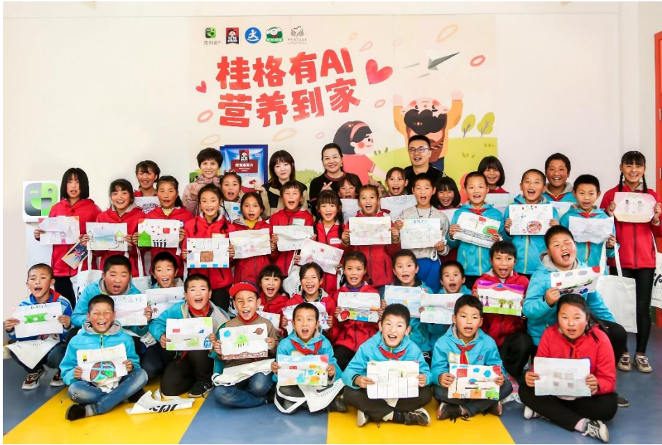
备注：“桂格有AI，营养到家”捐赠仪式大合影。