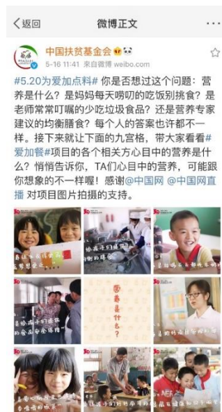
“营养是什么”微博九宫格