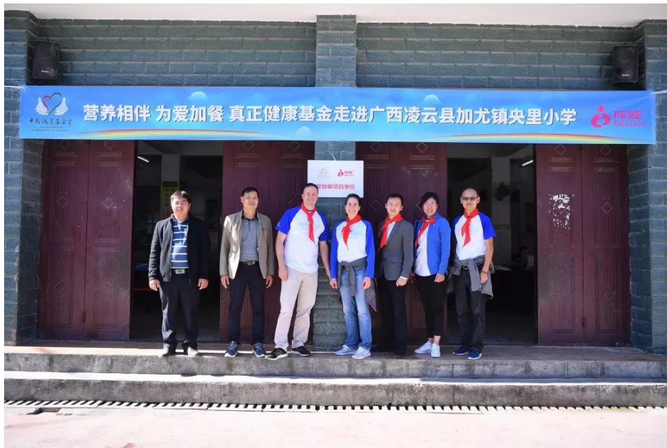
备注：“营养相伴 为爱加餐”探访活动在广西凌云县受益学校开展。