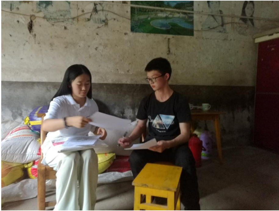
(图 3: 项目组工作人员向候选学生介绍新长城——特困大学生自强项目)