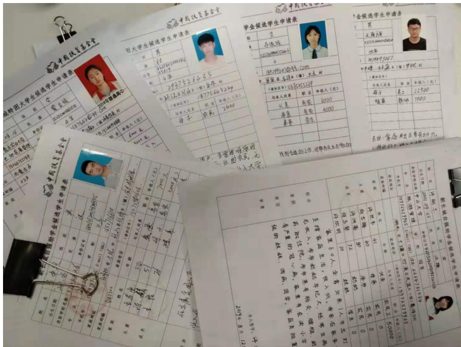
(图 4: 县推荐受益学生申请材料收集审核)