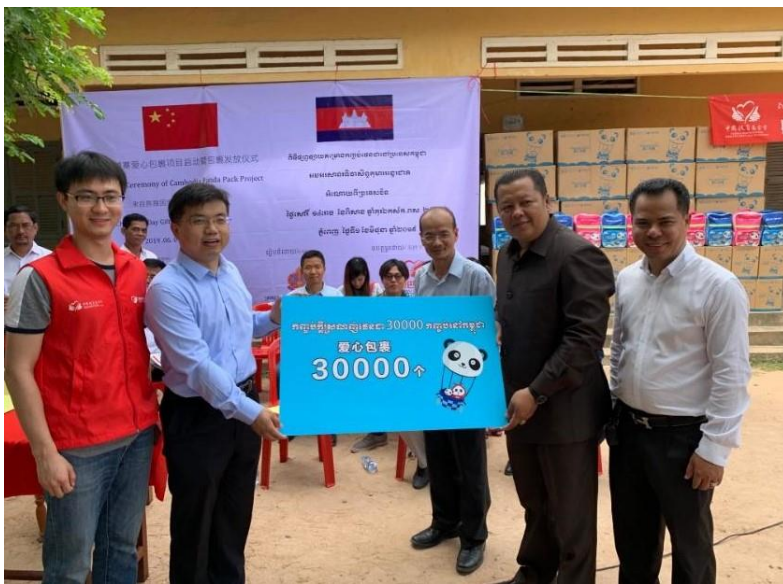
柬埔寨爱心包裹发放仪式