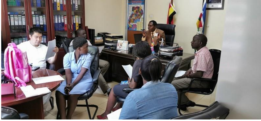
乌干达爱心包裹项目培训