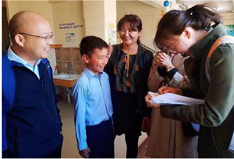
蒙古国 79 学校调研