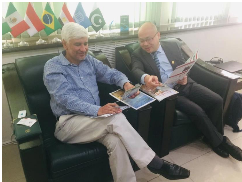
拜访巴基斯坦教育部