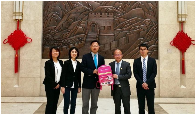
拜访中国驻巴基斯坦大使馆