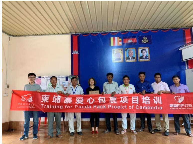
柬埔寨爱心包裹项目培训