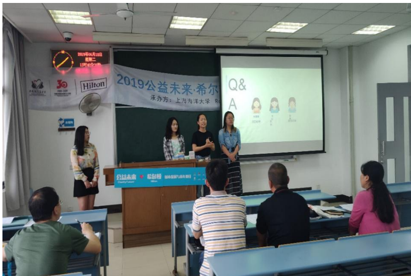
（图：上海海洋大学团队接受评委提问）

截至 6 月下旬，经过 22 所高校学生校内的传播和动员，全国累计有 225 个队伍报名参赛，平均每校 10 支左右，其中报名队伍数量最多的达到 25 个。