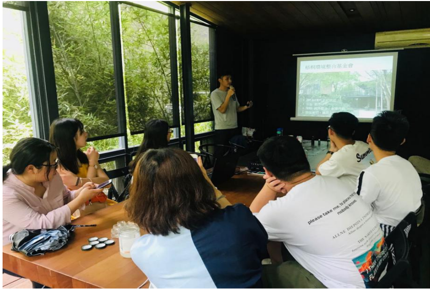
(图：台湾环保公益行团队认真聆听介绍)