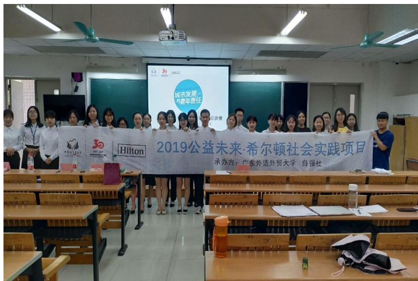
(图：广东外语外贸大学校内评比现场)