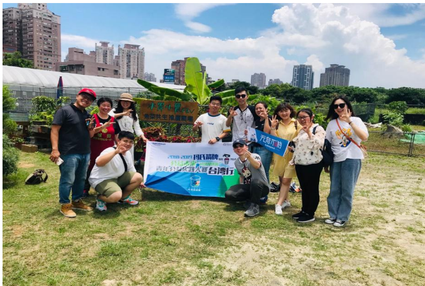
(图：日本环保公益行团队合影)

5月28日—6月2日，本届公益未来·箭牌“垃圾投进趣”青年公益实践大赛的冠军团队以及优秀社团负责人共赴台湾，开展环保台湾公益行。他们参观了台湾“你好你好 zero zero”城市环保店、福山植物园自然教育中心、宜兰利泽焚化炉等地，实地考察了台湾在垃圾分类和处理方面的经验。