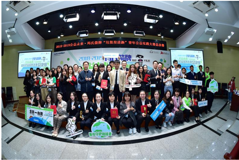
(图：总决赛现场合影)