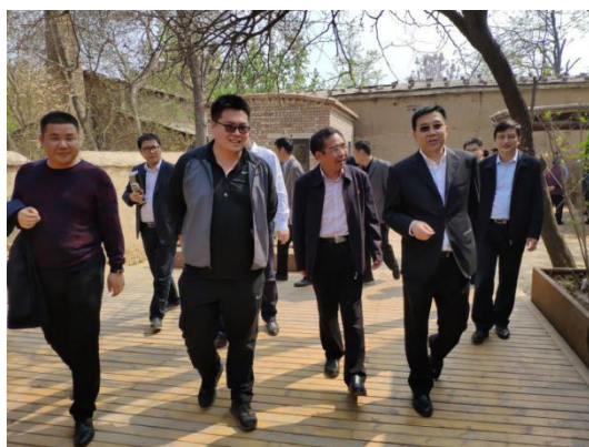
考察台前县姜庄村

1. 4月16日，中国石油河南销售公司党委书记、总经理刘星国一行到台前县姜庄村及范县韩徐庄村就定点扶贫工作调研，百美村宿项目部副主任郝德旻全程项目介绍，中国石油河南销售公司副总经理单文年，濮阳市人大常委会副主任、台前县委书记常奇民等陪同调研。