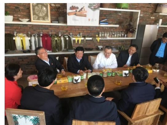
焦方正一行考察韩徐庄村