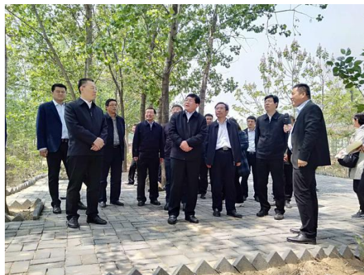
焦方正一行考察台前姜庄村