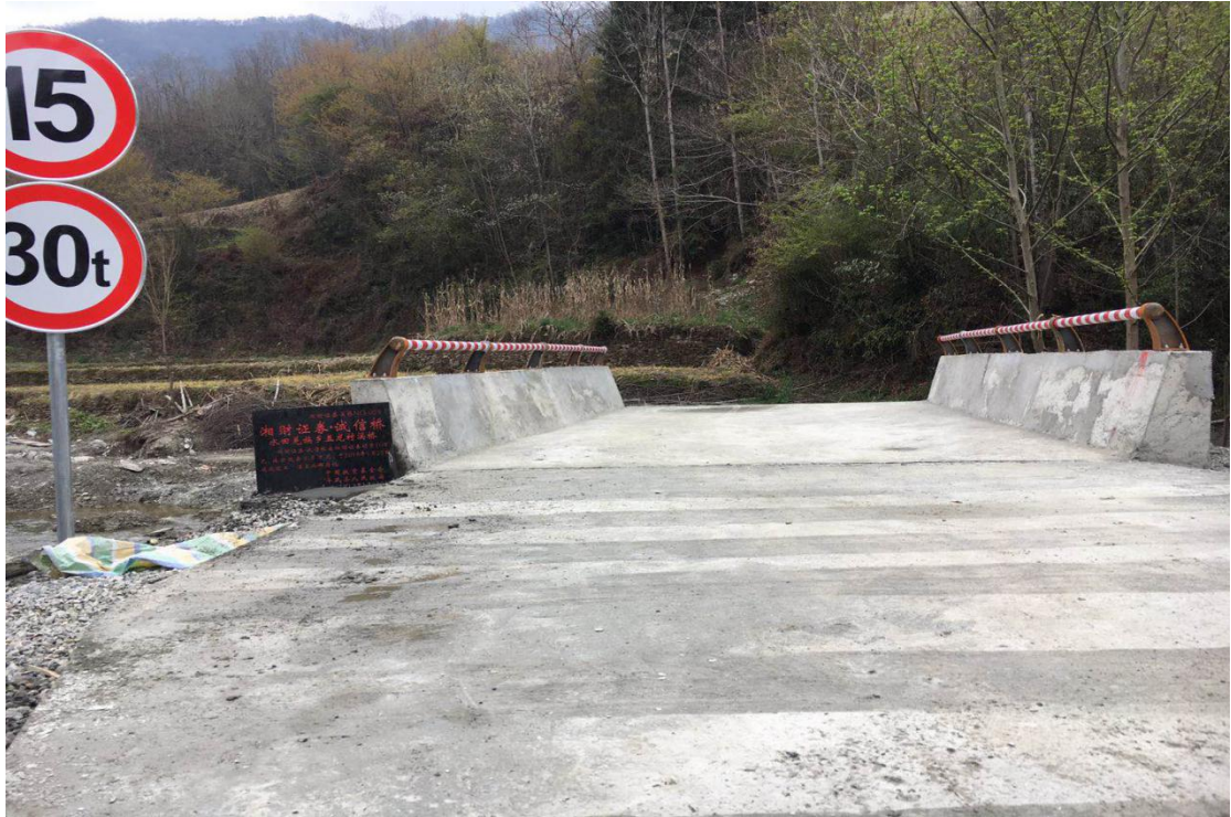
图 6 平武县五龙便民桥竣工图

九寨沟地震受灾地区多为山区，地形崎岖、水系众多、基础设施建设薄弱，民众出行难度大，多雨时期生产、出行都会受到影响，对溪桥的需求较为明显。为改善灾区群众出行现状，目前在受灾地区援建 14 座溪桥已全部竣工。其中，广发证券在平武县援助的 2 座，湘财证券 10 座。