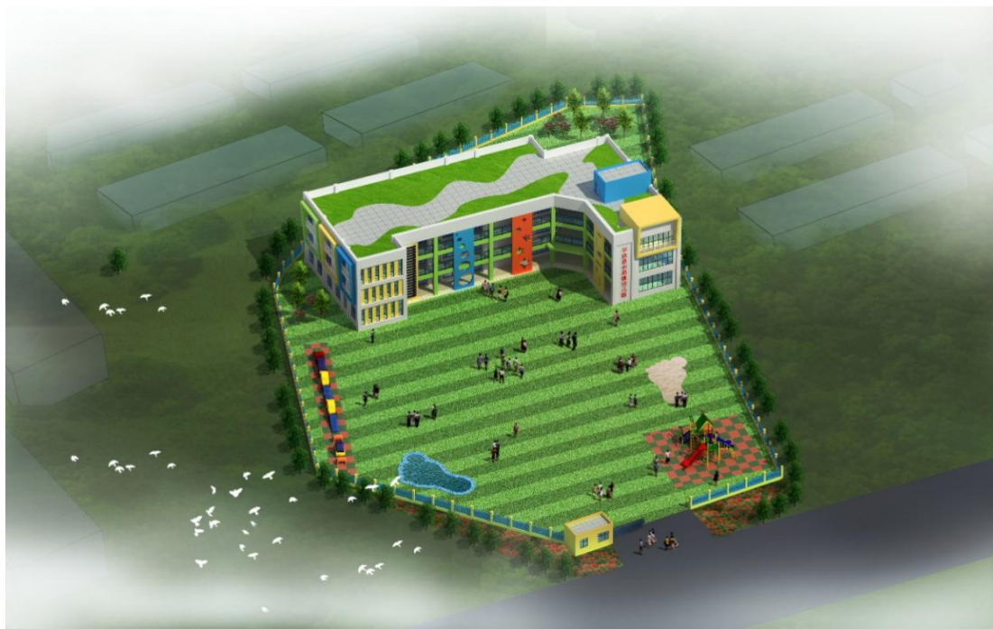
图4 幼儿园设计方案图

2018年12月24日中午，平武县水晶幼儿园新建项目在平武县水晶镇举行了开工仪式，但因征地问题未完全解决，截至2019年3月底霜冻期结束还未动工，目前正在加紧处理中。