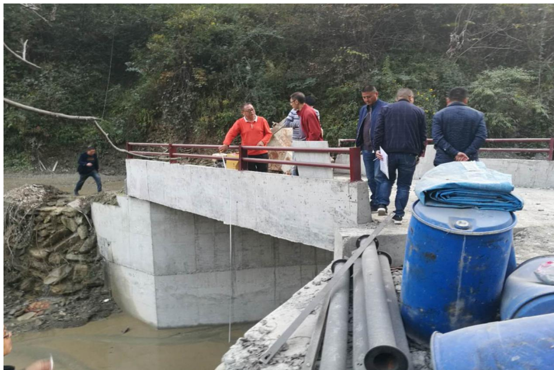
图 15 广发证券高家沟溪桥竣工图

目前已确认在受灾地区援建14座溪桥。其中，广发证券在平武县援助的2座溪桥已于11月份竣工结项；湘财证券在平武县的10座溪桥、山西证券在平武县的2座溪桥已于12月开工建设。