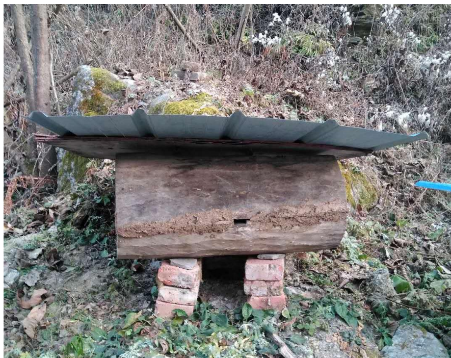
图 27 使用牛粪封住蜂箱的缝隙保温，帮助蜂群顺利过冬。

尝试选用“格子箱”降低对蜂卵的伤害。也需要合作社养蜂户摸索出随之而来的新的养蜂技术。