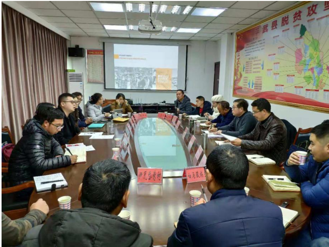
图21 12月份，召开伊瓦岱惹村骆驼加一二社规划设计汇报会