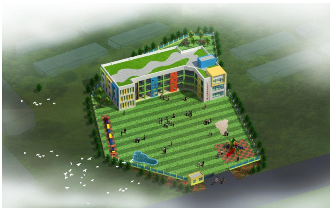
图 4 幼儿园设计方案图

根据捐赠方对于善款的使用意向及受灾地区实际需求，为改善平武县水晶镇的教育硬件设施现状，我会在水晶镇援助新建一所幼儿园。项目于2018年1月中旬进行了第一次选址考察，但由于未完成征地进行了二次选址，于2018年4月完成最终选址。前期完成了项目可研批复，项目方案设计、施工图设计、造价预算等工作。