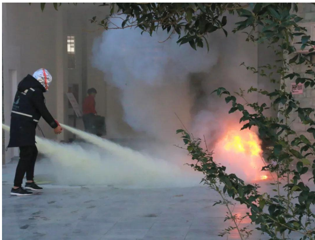
图 23 乡镇学员进行灭火演练

2018年，九寨沟第一救援人项目累计支出842180元，项目覆盖九寨沟县漳扎镇、大录乡、玉瓦乡、黑河乡、保华乡、永和乡、罗依乡、郭元乡、勿角乡九个乡镇，直接受益人数2051人，培养第一救援人教官培50人，43名教官通过考试取得国际应急管理学会师资认证，受益社会组织超过25家。接受过培训的教官在九寨沟的9个乡镇及行政村开展第一救援人培训，直接参加培训人次300人，间接受益村民超过2.5万人。