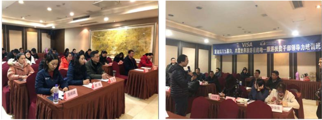
图 18 培训班现场