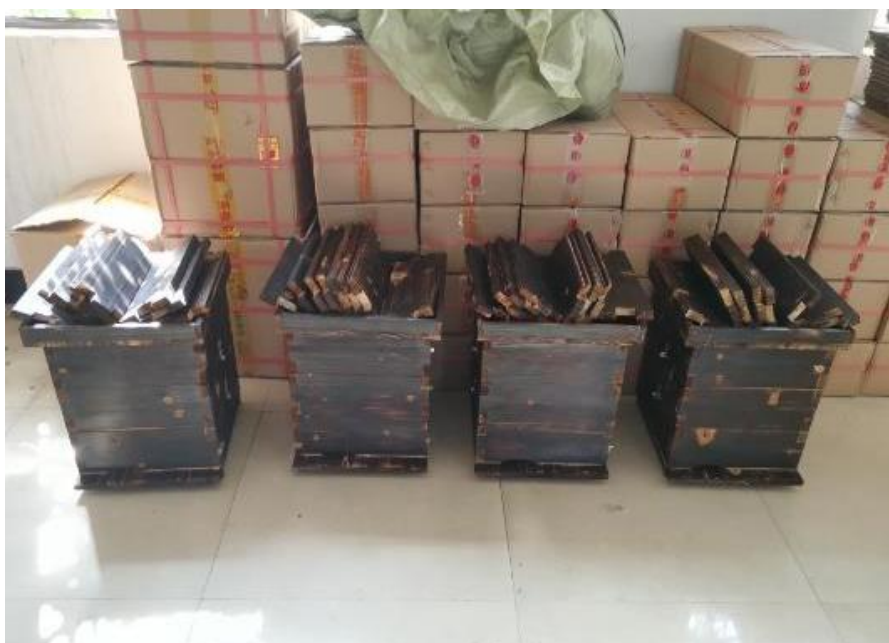
图 26 传统的“棒棒巢”取蜜时只能连带蜂卵一起取出,对蜂群数量有一定的影响,

为了扩大项目收益范围,并支持周边蜂蜜产业的发展,走访临近的新驿村与金丰村考察了解社区的养蜂情况,走访社区带头人调研的同时说明电商扶贫项目的初衷,建立联系,为后续项目开展做铺垫工作。