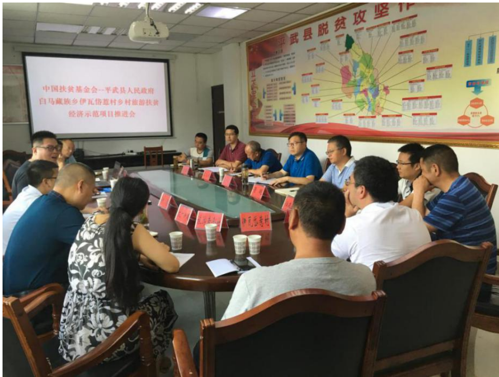
图20 8月份，召开项目推进会

虽然各项工作均有所进展，但是由于本年度7月份，平武县再次发生特大洪水灾害，造成九环线中断一个月，进入村庄的道路时断时通，道路危险系数较高。这些对项目的现场测绘、房屋场地勘察等工作带来了十分不利的影响。加之，10月份伊瓦岱惹村上壳子社老房屋被列入白马文化保护村落，当地政策发生变化，导致11月份开始项目将民宿改造区调整到伊瓦岱惹村驮骆加一二社，因而重新开展民宿房屋测量及设计工作。截止目前，伊瓦岱惹村驮骆加一二社总体规划以及民宿设计方案已经得到当地政府认可，规划设计单位目前正在绘制施工图。预计2019年开春以后，可以开工实施。