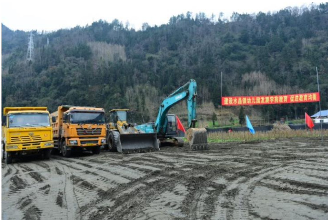
图 13 开工仪式现场 3