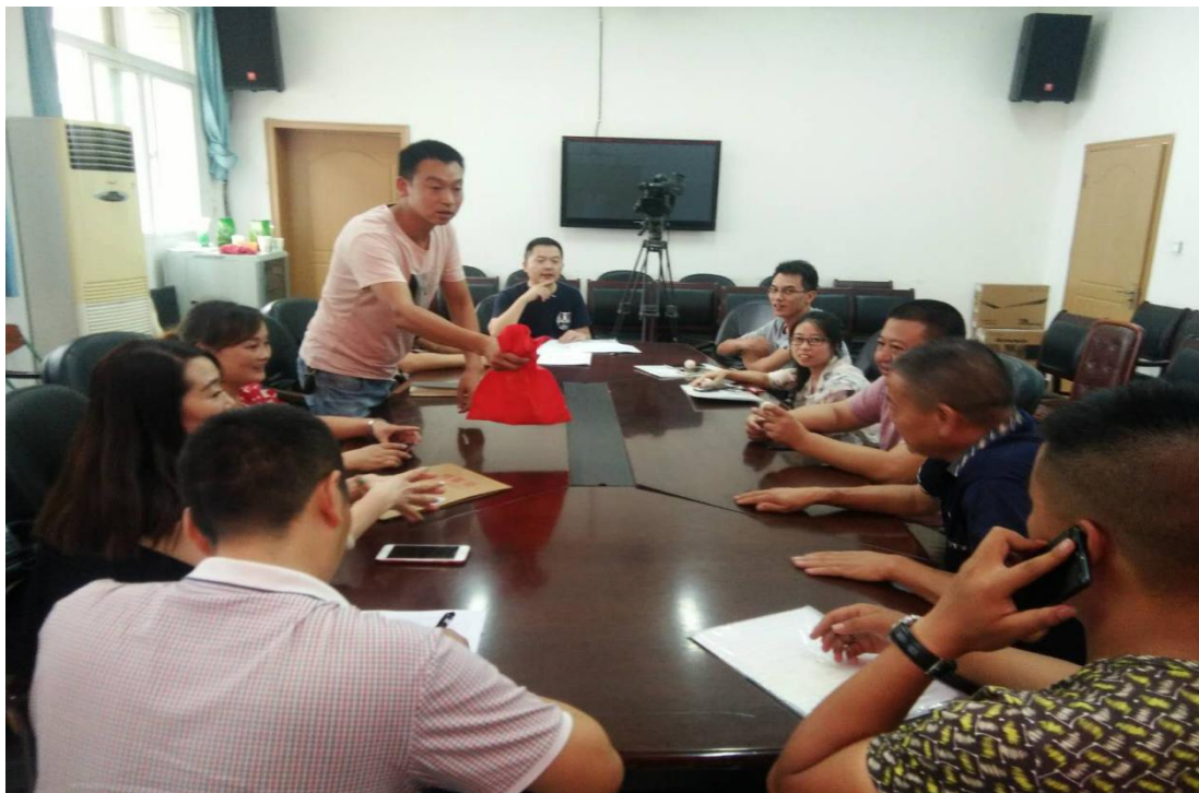
图7 平武县水晶幼儿园公开招标随机抽取现场会

但在2018年9月14日办理开工手续时发现了新的问题，平武县水晶镇幼儿园建设项目用地属性还未完成变更，水晶镇政府