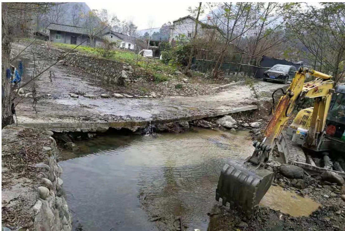
图 16 山西证券杜家院溪桥开工图