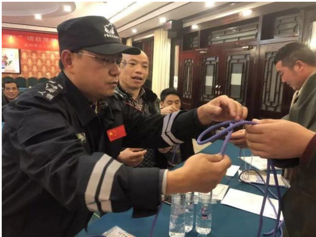
图 24 教官向乡镇学员演示不同打法的绳结