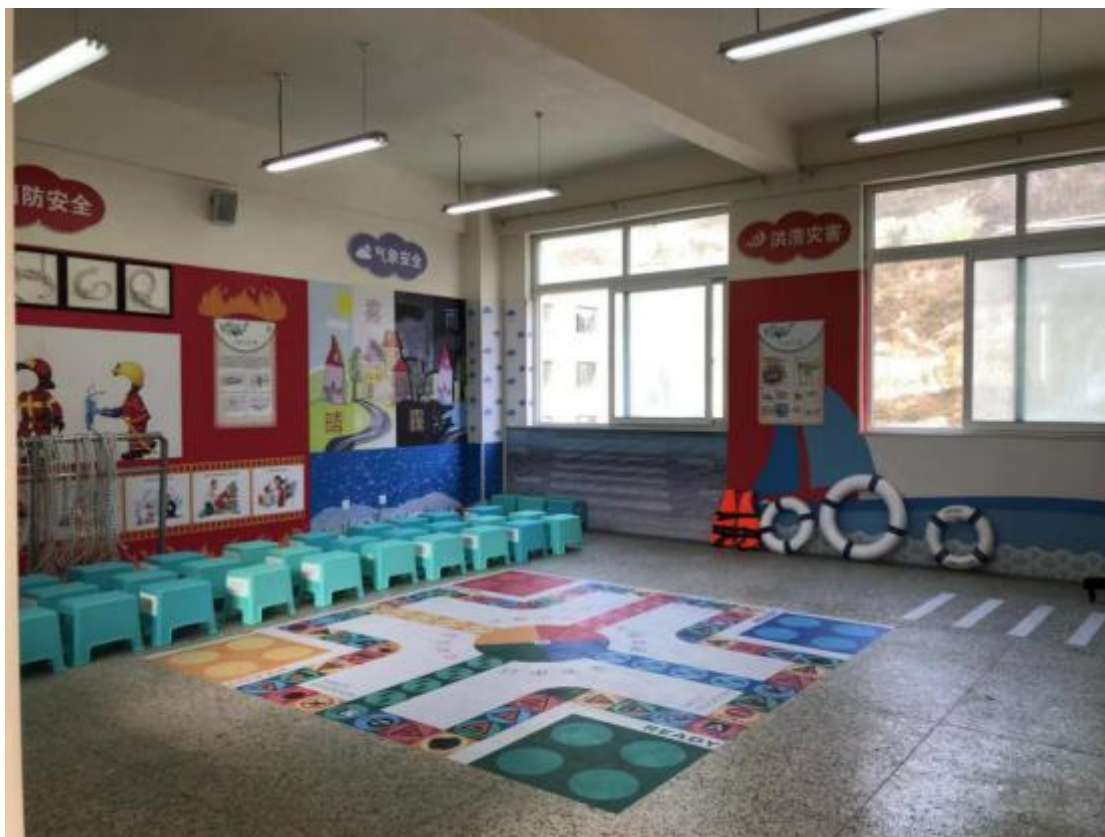
图 22 校园减灾教室项目样板间