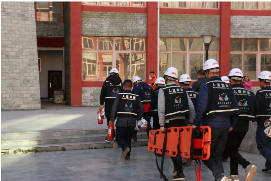
图 25 教官组织开展学员实操应急演练