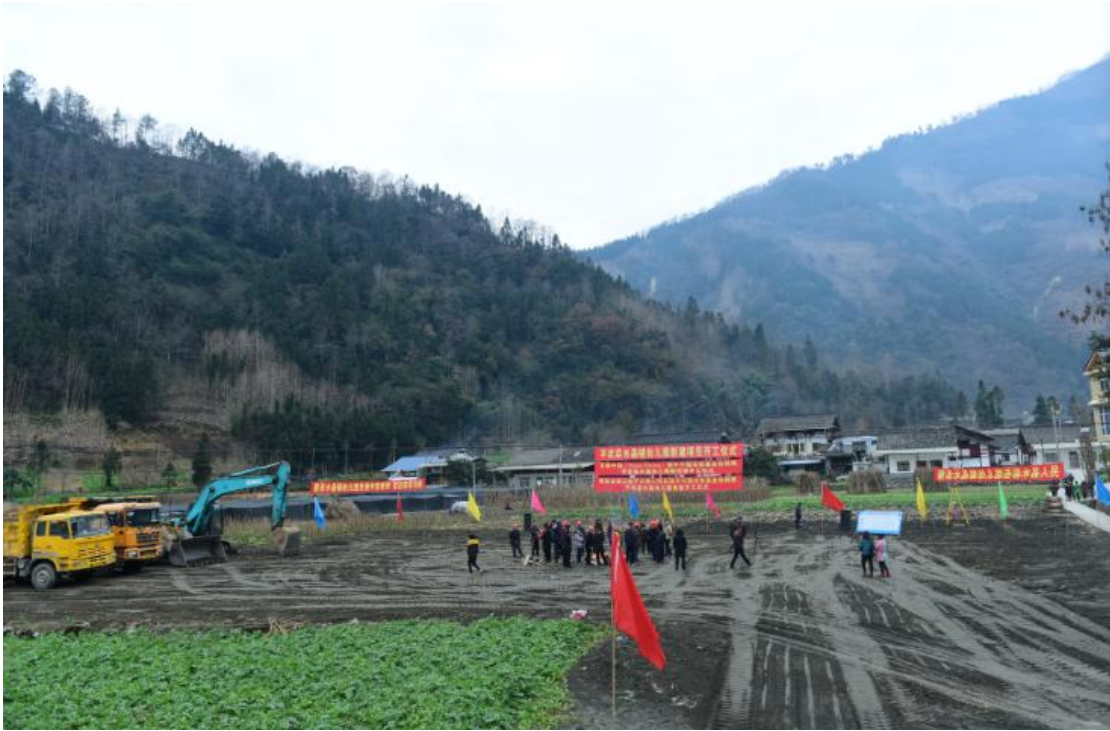
图 14 开工仪式现场 4