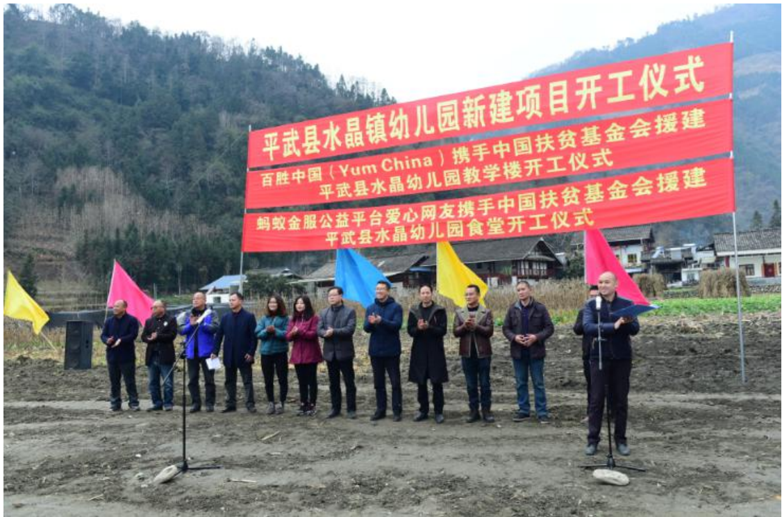
图 12 开工仪式现场 2