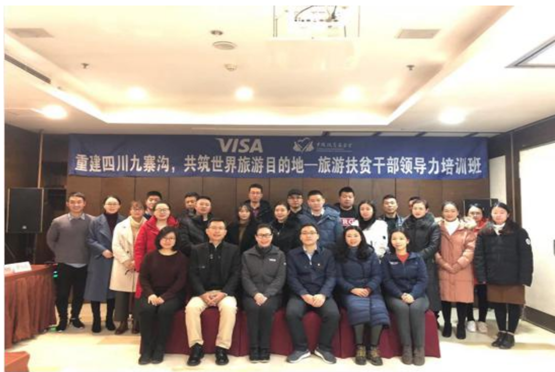
图 17 重建九寨沟，共筑世界旅游目的地旅游扶贫干部培训班学员合影

成都理工大学旅游与规划学院、中山大学旅游学院、中国工商银行四川省分行多位业界专家为学员授课，此次培训讲授了旅游监测体系建设与研究发现，乡村旅游发展新理念、新业态、新举措，乡村旅游产品开发等课程，授课老师给学员们授课并针对学员们提出的问题进行了现场指导与答疑。课后学员们表示：此次培训班内容针对性强，互动式的教学方法让大家更容易理解并接受授课内容，除了知识上的提升，也增强了大家对九寨沟灾后重建工作的信心。