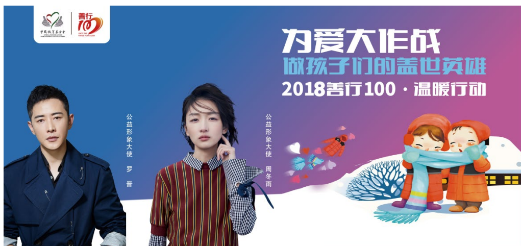
公益形象大使罗晋与周冬雨

2018善行100·温暖行动邀请了9位明星艺人参与，累计推送16篇微信文章阅读量达12.2万，“善行100”微博话题阅读量从500万增加到1.8亿，活动获得团中央学校部、兰州日报、海南新闻频道等报道。