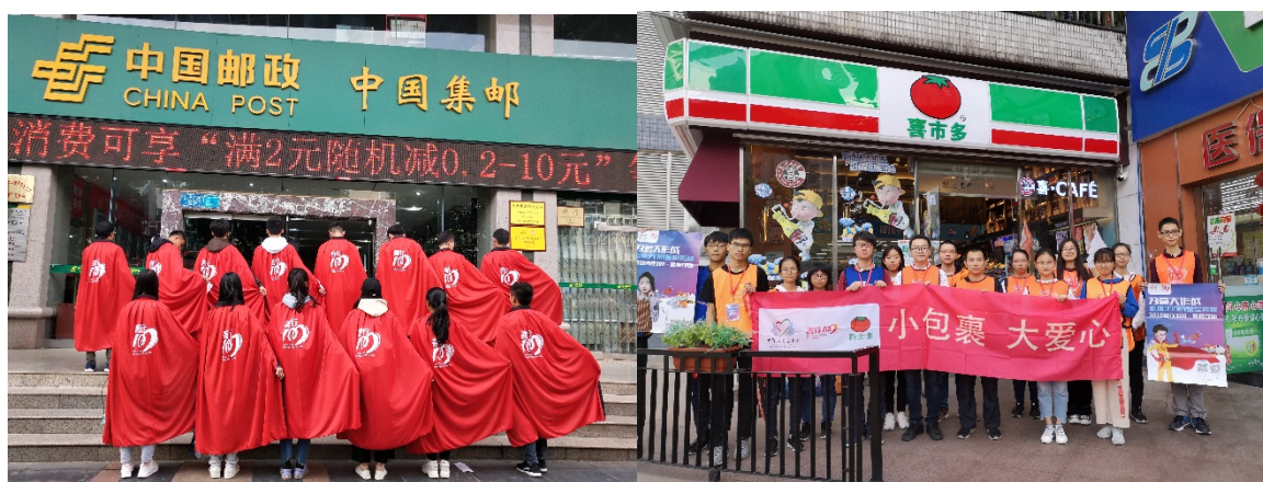
大学生志愿者在邮局（左）和喜士多（右）劝募