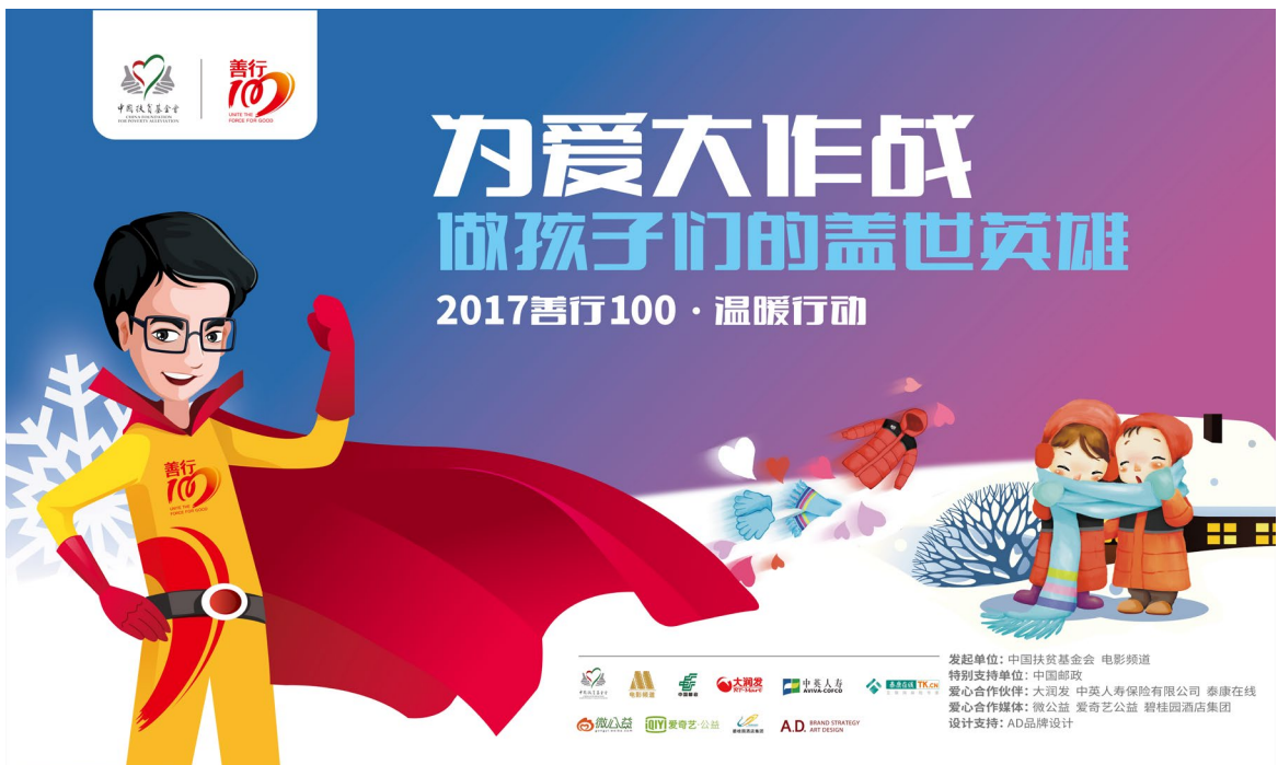
2017善行100·温暖行动主视觉

2017年2月开始，为加强精细化管理、保证活动品质、规避活动风险，我部从项目流程、高校管理、活动培训、监督体系、奖惩措施等方面对善行100活动进行了全面梳理，调整和优化了2017年善行100活动方案：一、明确操作规范，完善监督体系；二、加强精细化管理，把控活动风险；三、4、完善信息化程度，提高管理效率；四、志愿者培训量化，升级工具包。2017年善行100活动以“志愿者佩戴斗篷”这个符号化形象，邀请名人明星、媒体、企业等资源参与。