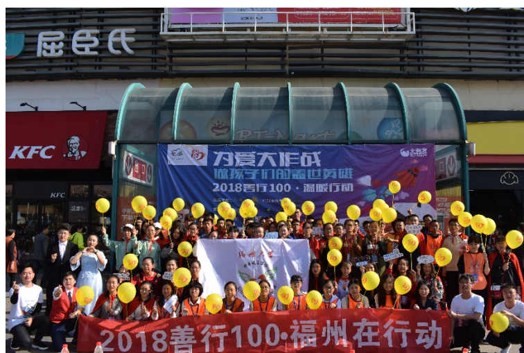
大学生志愿者在大润发开展启动仪式