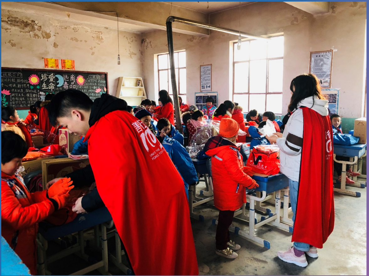
大学生志愿者为小孩子穿上新衣服