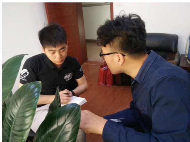
太原理工大学监测