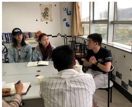
山东工商学院志愿者座谈会