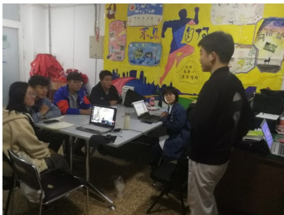
河北大学志愿者座谈会