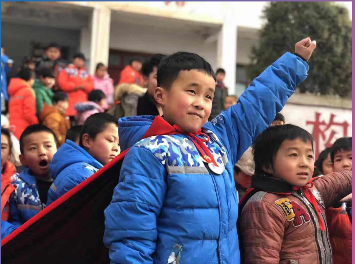
小朋友穿上超人披风