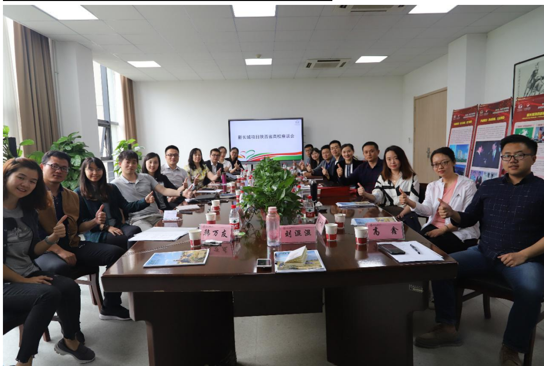
新长城项目陕西省高校座谈会