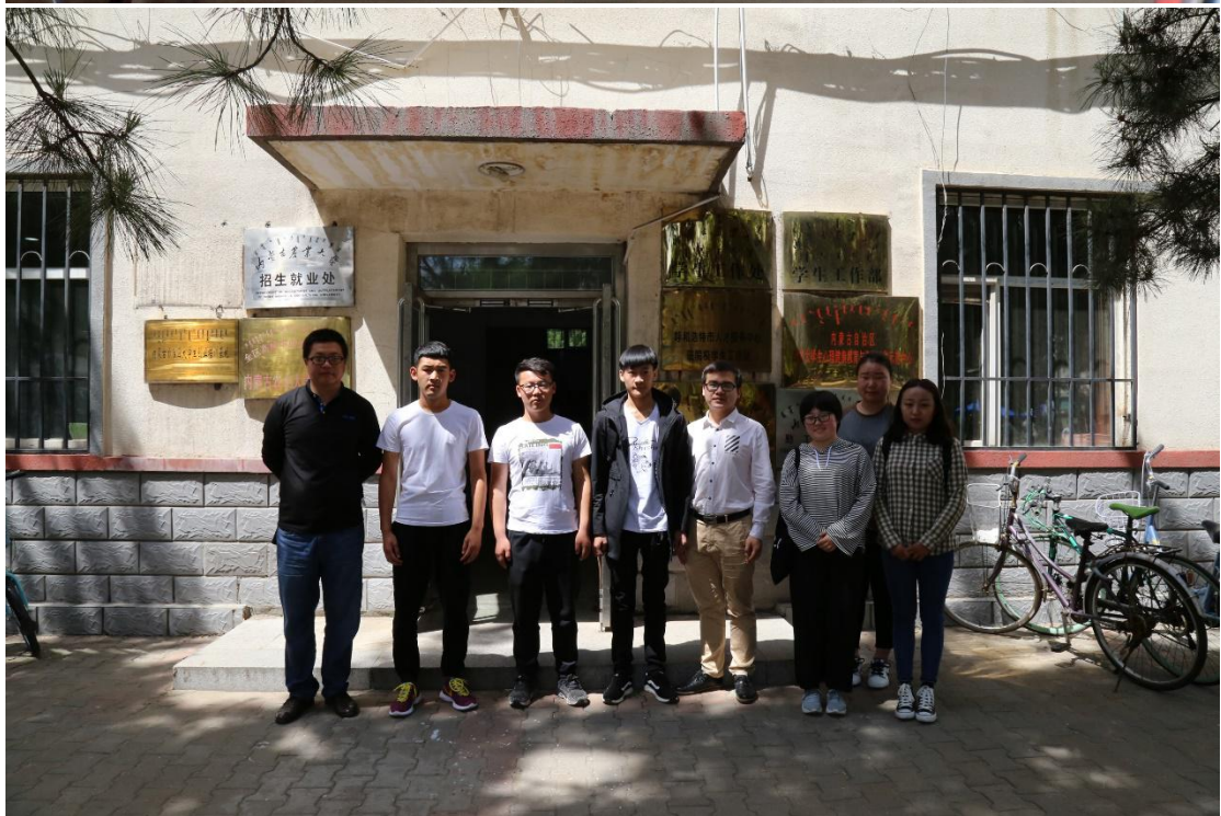
与学校老师、受益学生合影