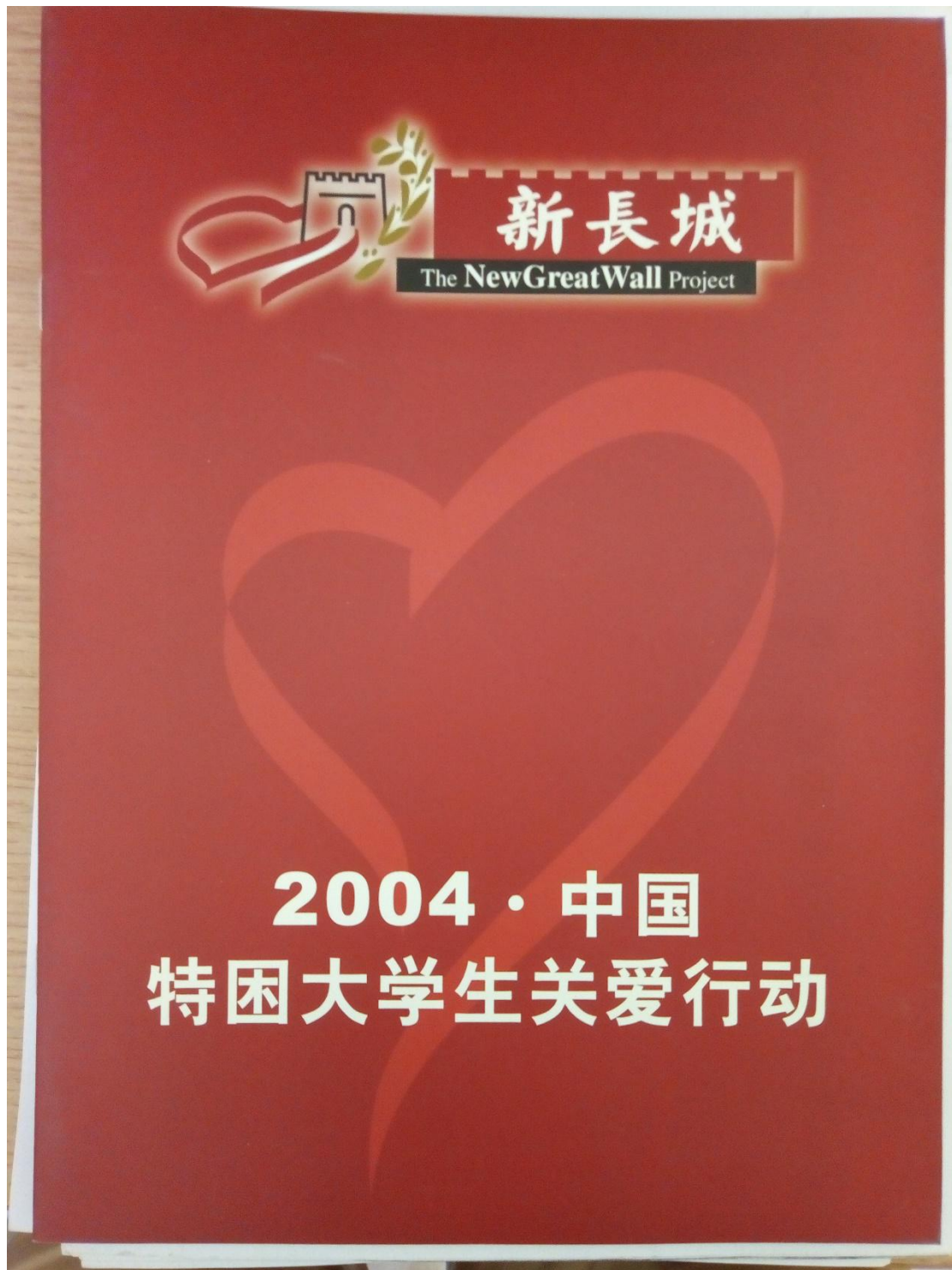
学校留存的 2004 年的新长城项目资料