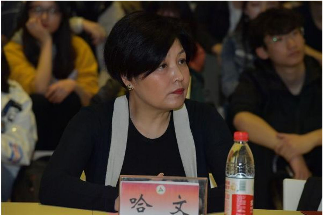
（图：著名导演哈文女士出席活动）