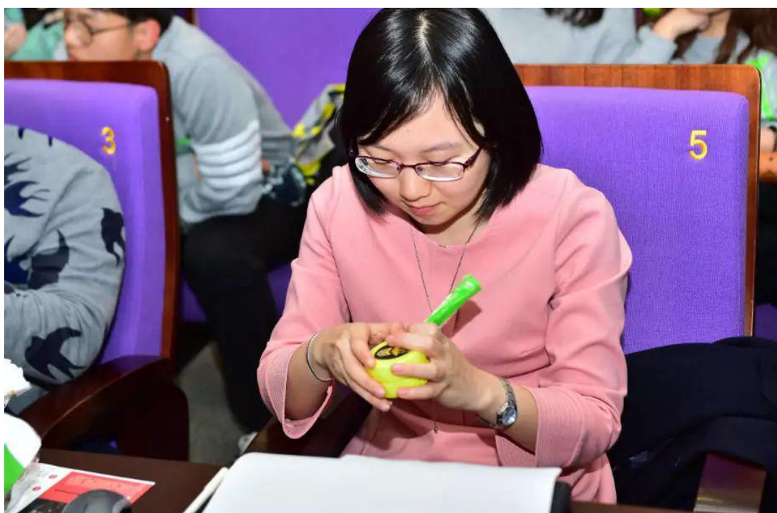
(图：评委使用选手作品)