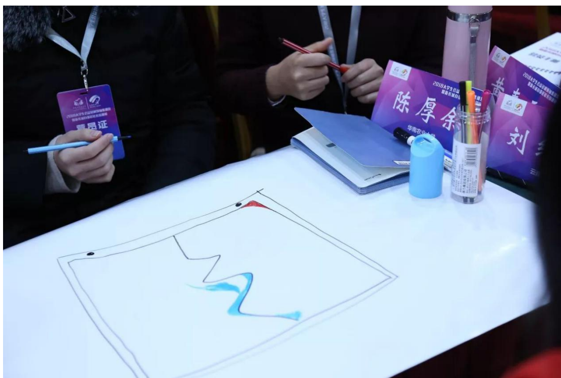
(图：创新设计思维工作坊)