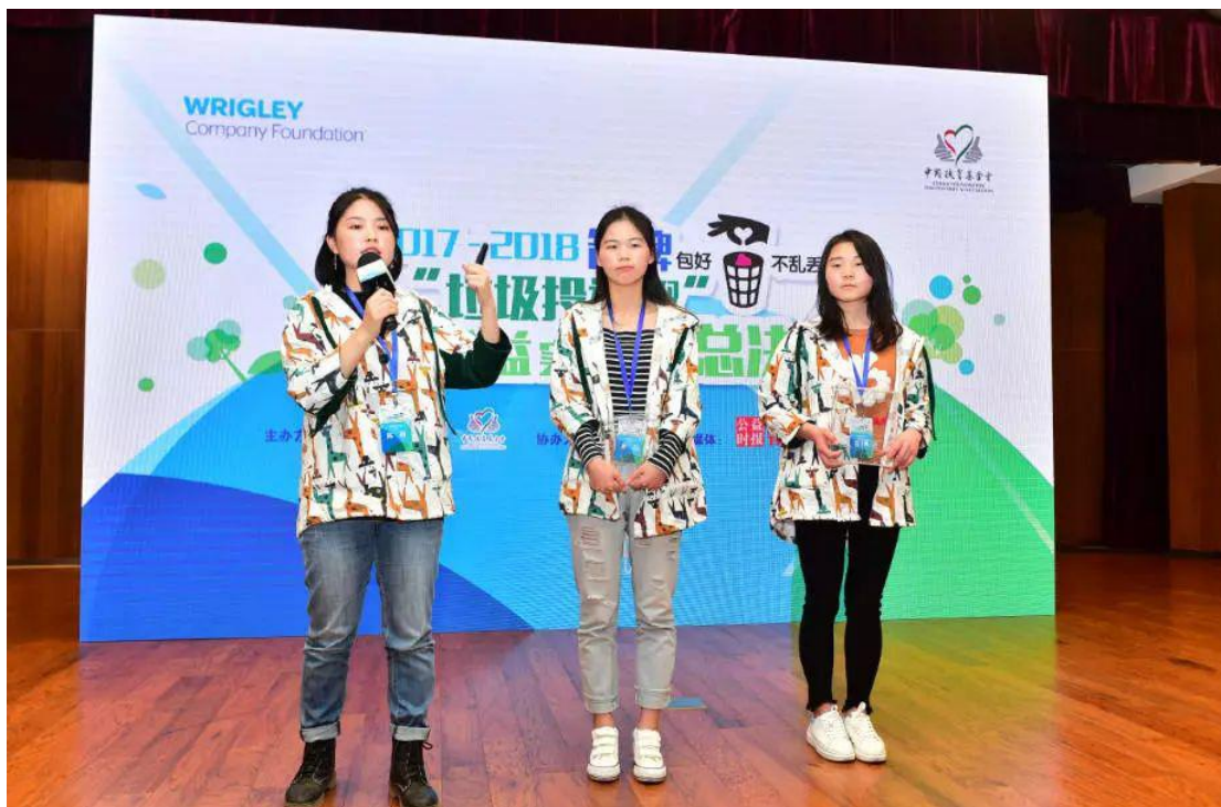
(图：参赛选手现场问答)