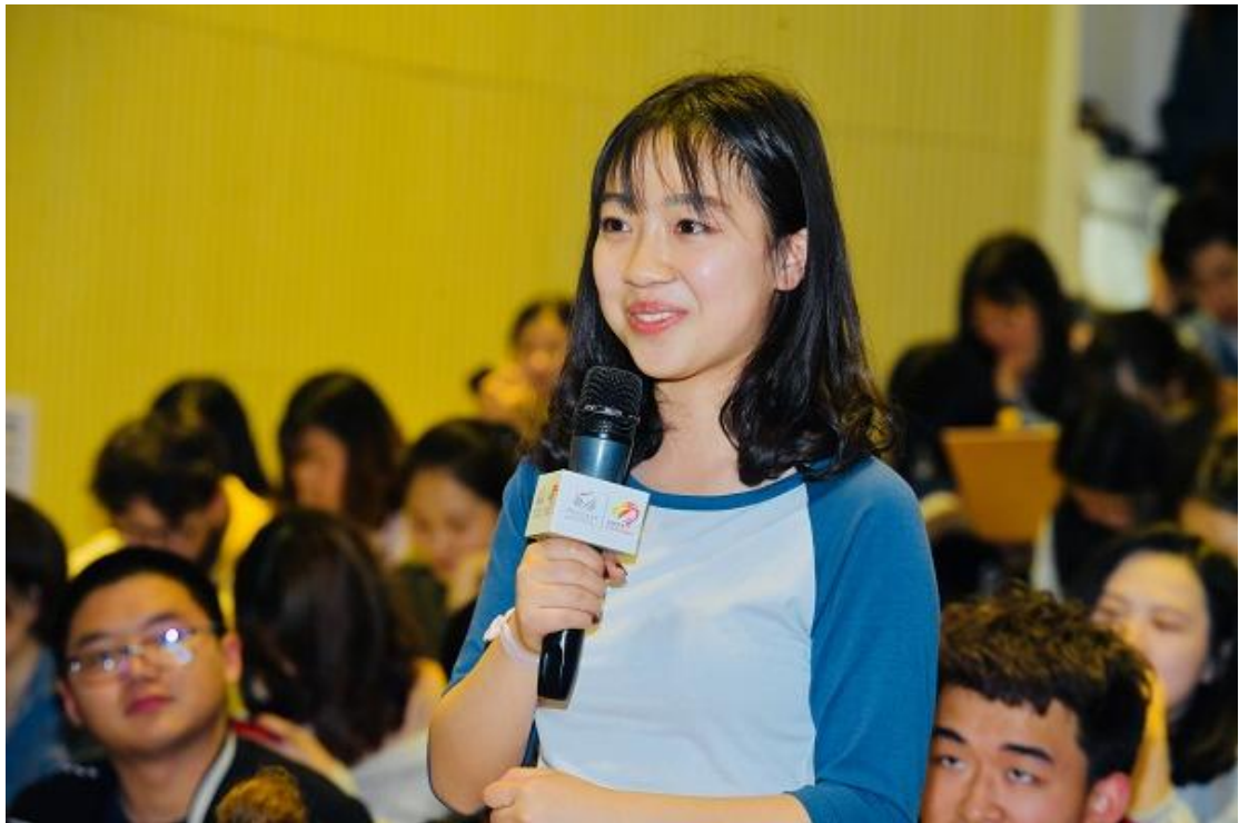
（图：中国传媒大学学生现场提问）

2. 公益未来·中国石油社会实践及 99 公益日 500X 青年行动两个实践活动处于高校社团执行阶段。