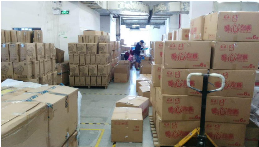
图为工作人员和志愿者在真彩验货现场