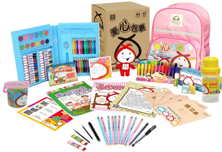
图为学生型美术包，因厂家和生产批次不同，包裹颜色略有不同