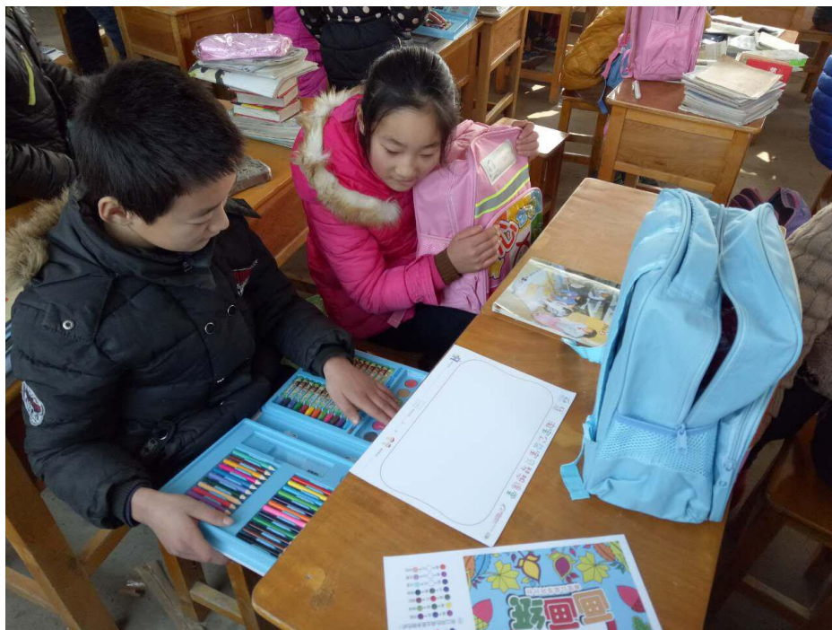
图为小学生使用美术包产品