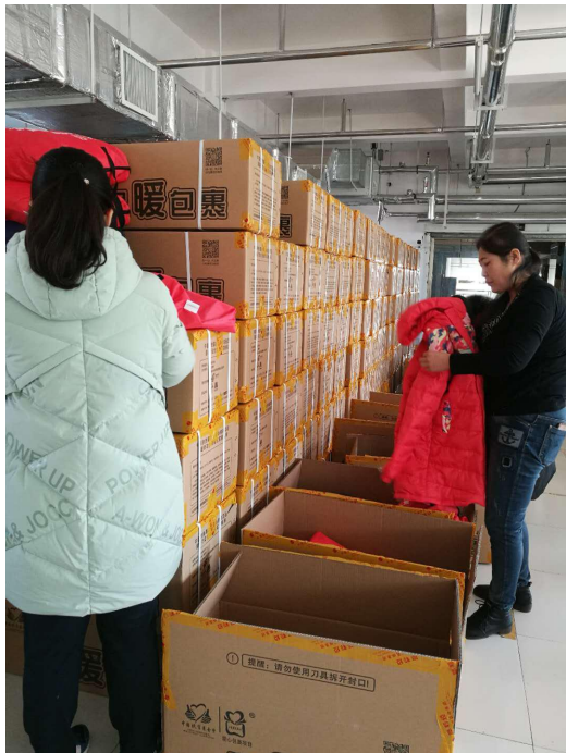
图为工作人员和志愿者在耶莉娅验货现场