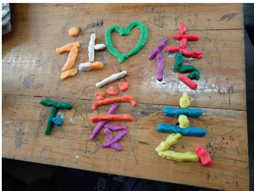
图为贵州正安小学生收到美术包用橡皮泥表达当时的感受