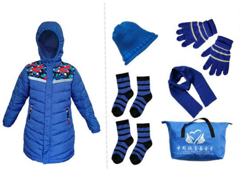
图为学生型温暖包，因厂家和生产批次不同，包裹颜色略有不同