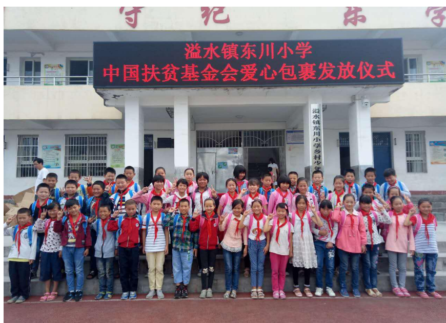
图为溢水镇东川小学美术包裹发放仪式