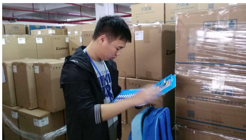
图为工作人员和志愿者在齐心验货现场