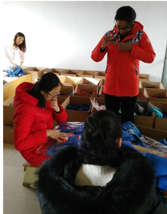
图为工作人员和志愿者在红豆验货现场