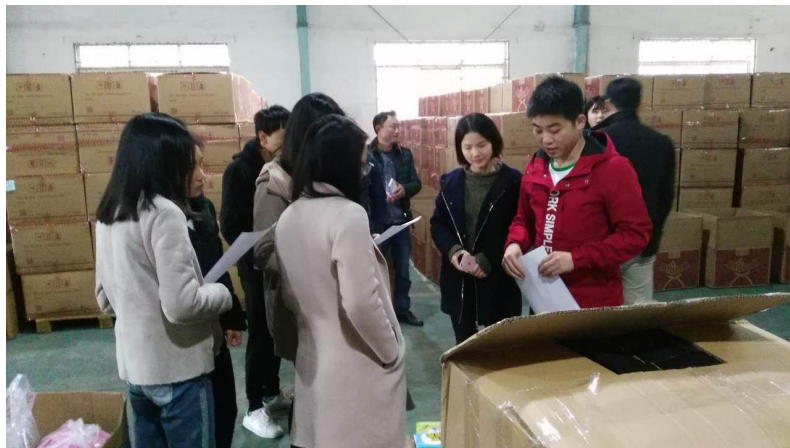
图为工作人员和志愿者在贝发验货现场

2017年10-11月,爱心包裹项目组按计划推进采购及验货工作,分别组织高校志愿者分赴真彩、齐心、贝发三家爱心包裹美术包供应商,检验美术包产品;分赴红豆、耶莉娅两家温暖包供应商检验温暖包产品。