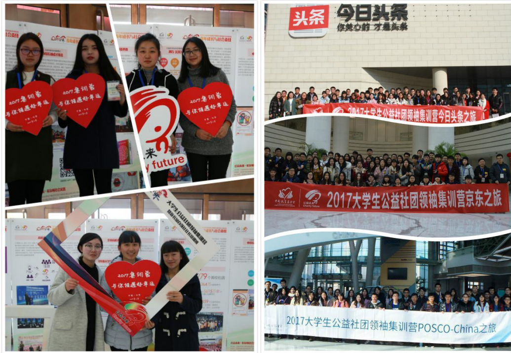
(图：部分营员与企业参观照片)