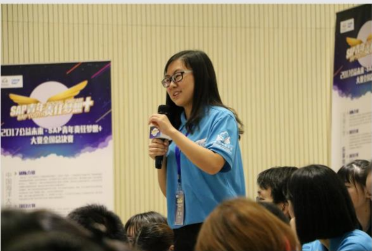
● 京师爱心队在2017公益未来·SAP青年责任梦想+大赛现场作为总冠军发表感想