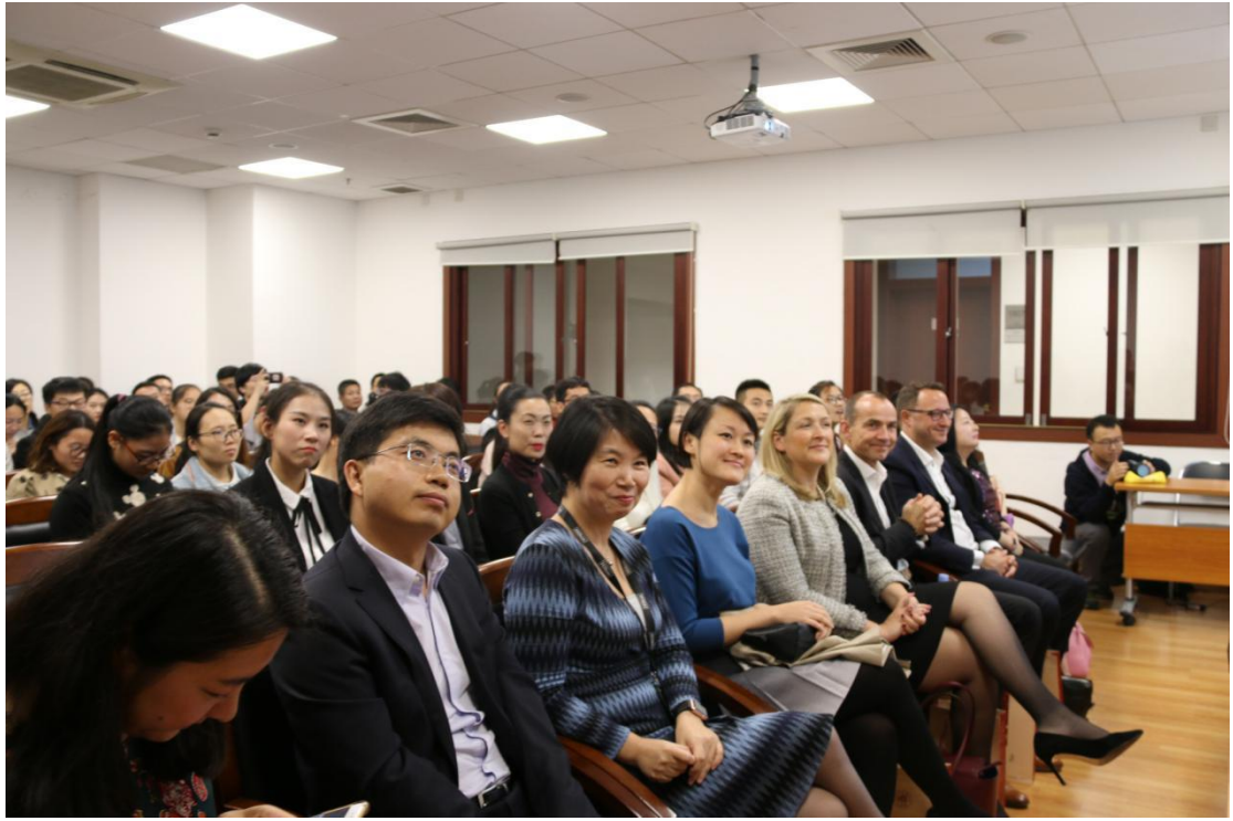
(图：11月全球总裁见面会现场)