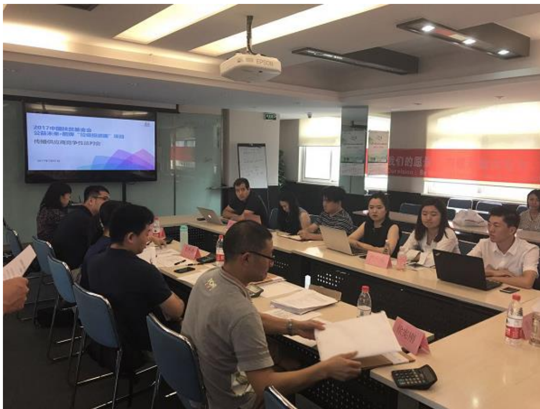
(图：竞争性谈判现场)

最终选定罗德公共关系顾问有限公司为 2017-2018 公益未来·箭牌“垃圾投进趣”项目传播服务中标供应商。