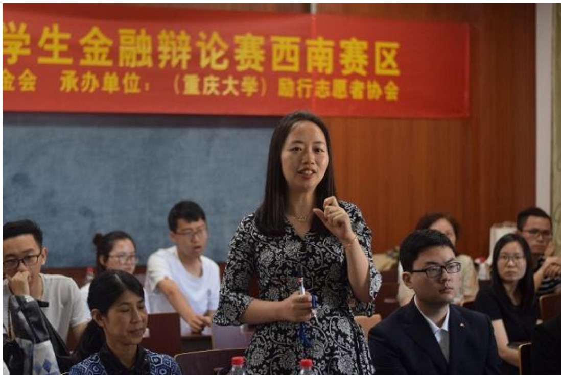
(图：西南赛区辩论赛现场评委点评)