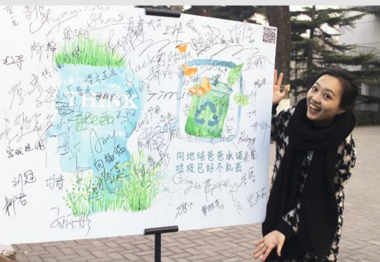
● 2016—2017公益未来·箭牌“垃圾投进趣”大赛冠军iGreen团队实践项目