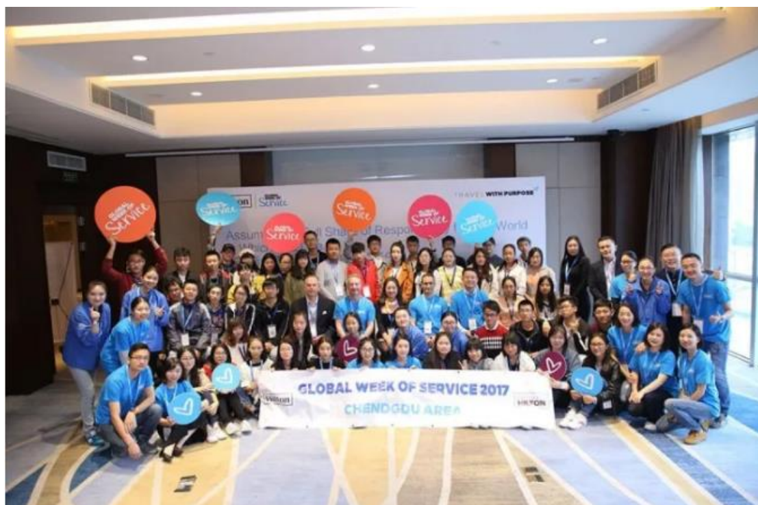
(图：10 月成都地区培训会)