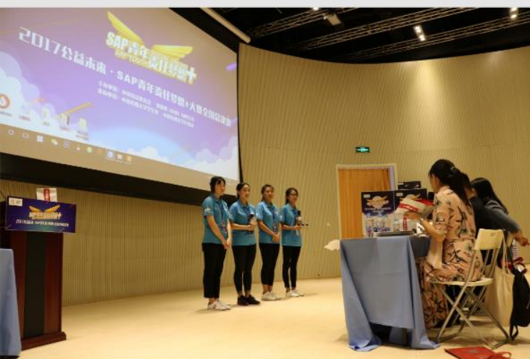
● 小满计划团队现场展示方案