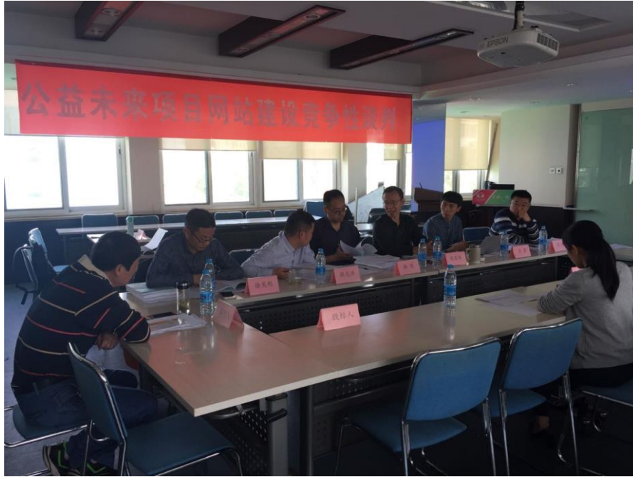
(图：竞争性谈判现场专家讨论)