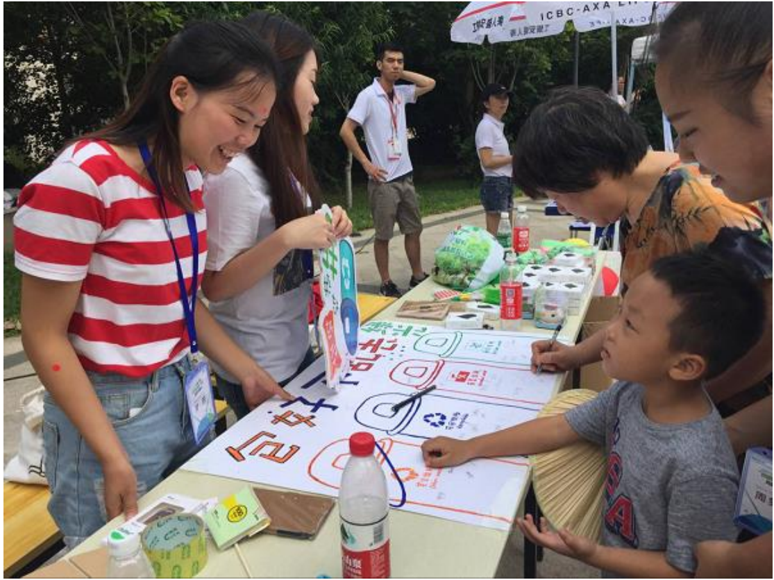
（图：8月进社区倡导垃圾包好不乱丢）