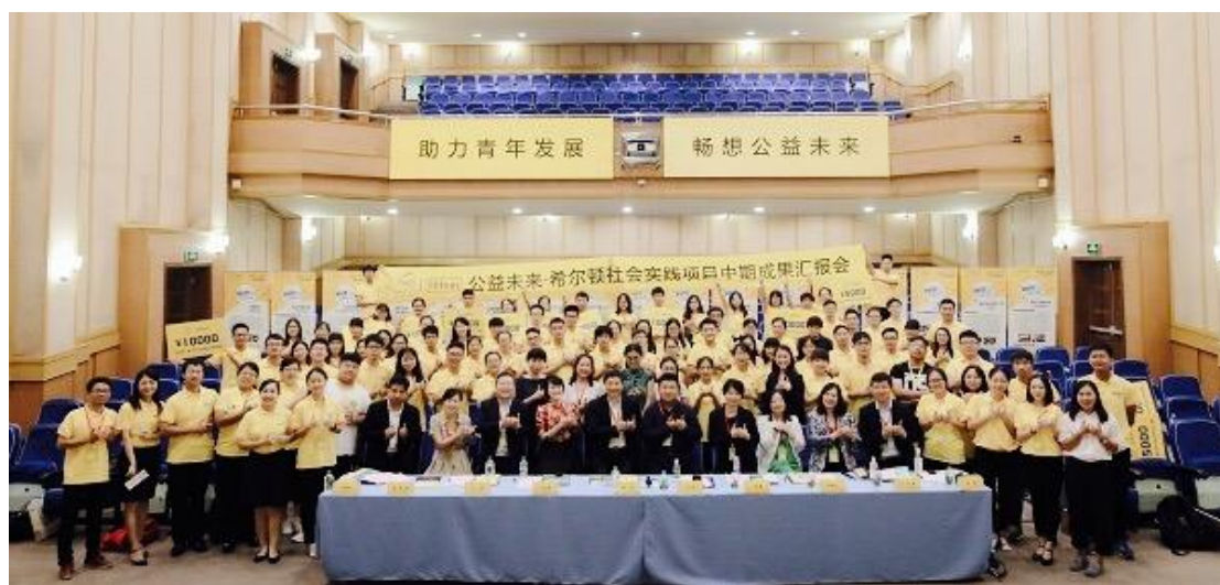
（图：8 月中期成果汇报会现场大合影）

2017 年希尔顿社会实践项目支持 17 城市 48 所高校 60 个社团开展实践活动，使更多的人群能够通过项目实施而受益。高校公益社团可以通过递交项目申请材料向公益未来项目组申请项目经费，根据项目计划开展项目。在项目的申请、执行、总结等过程中，公益社团都将得到公益未来项目组的指导，从而提升社团项目开发能力。此外，举行 3 场落地活动：中期成果汇报会、成都地区培训会、全球总裁见面交流会。