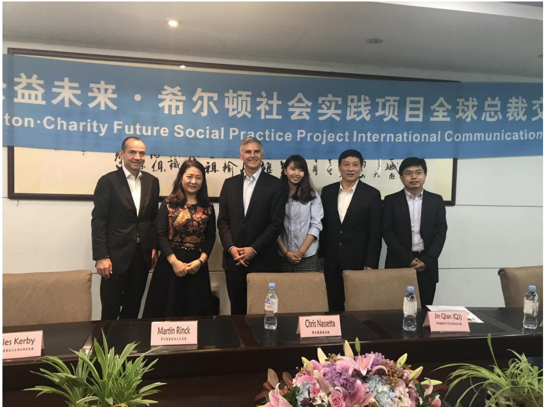
(图：11月全球总裁见面会现场)