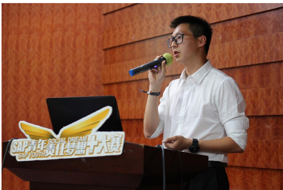
(图：校内赛选手风采)