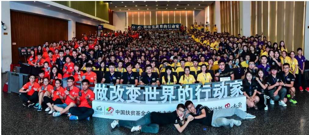
(图：8 月份培训会全场大合影)

全国 341 个社团共同参与“支持万名高校行动家”，累计影响 165667 人次捐赠，筹集善款 1196256.81 元，用于高校青年成才发展。社团将会通过线上筹款、项目设计、执行、反馈等流程。