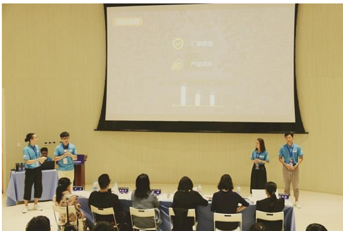
(图：9月学生现场演说)