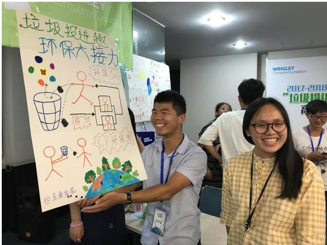
(图：8月社区环保方案现场比拼)