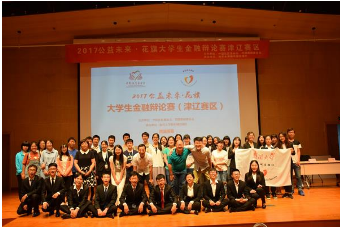
（图：天津赛区辩论赛现场）